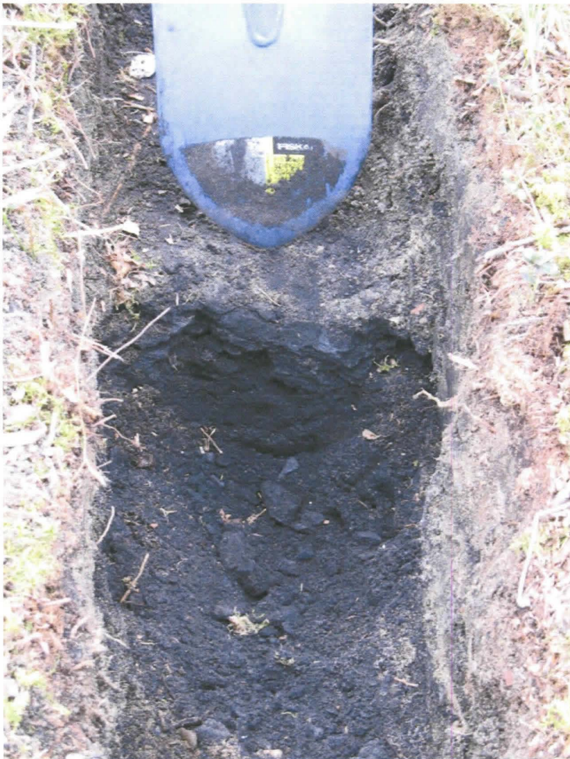
Kuva 7. Koeojan profilissa oli erittäin musta, lähes asfalttimaisen kova palokerros.