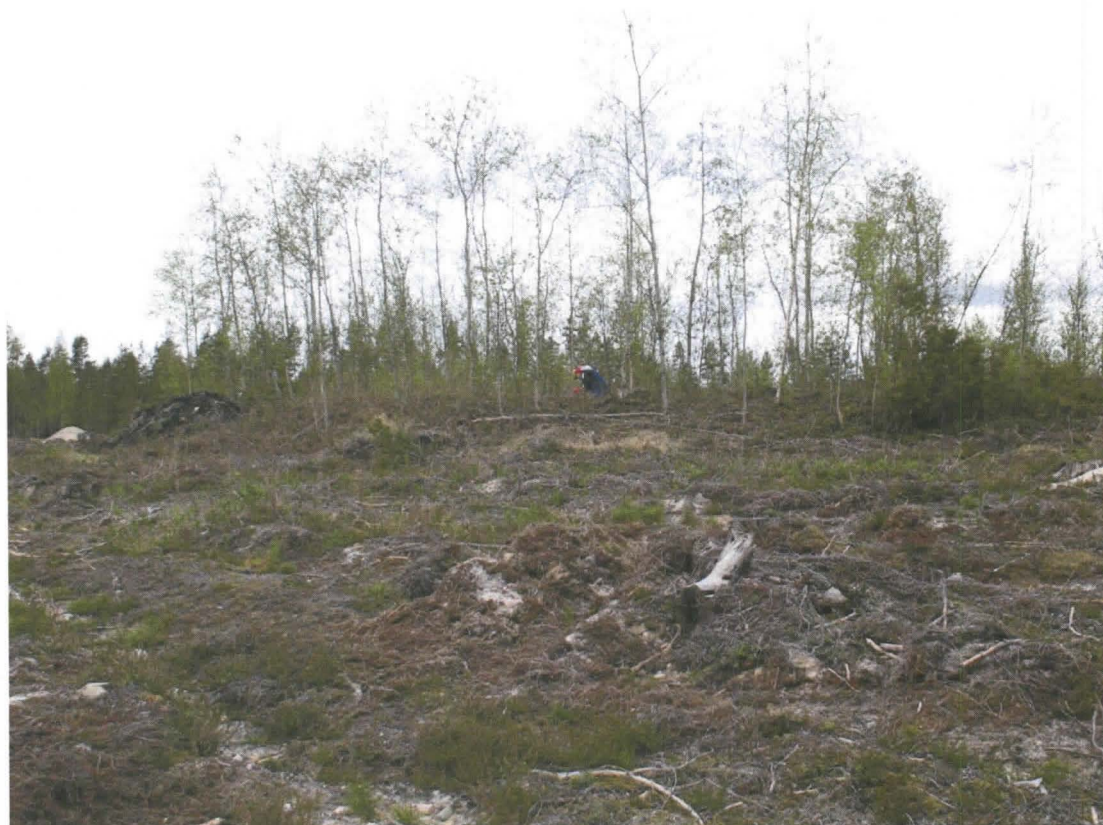
Kuva 2. Tervahaudan päällä kasvaa nuorehkoa lehtipuustoa.