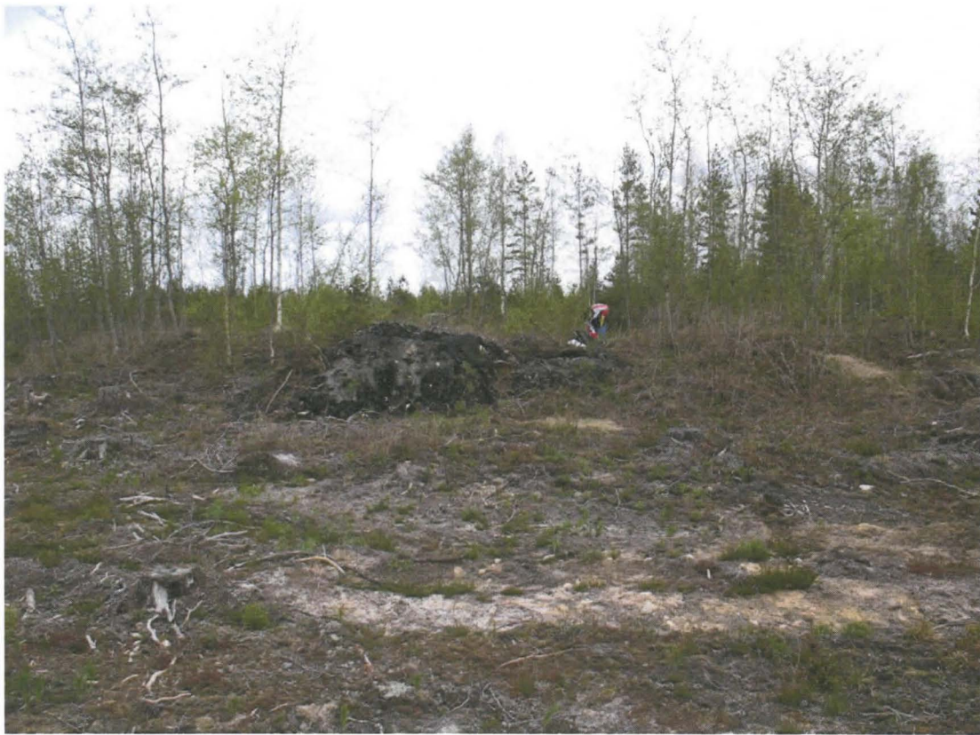
Kuva 5. Edellinen kuoppa kaakosta kuvattuna.