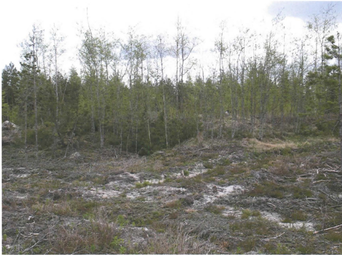
Kuva 3. Tervahaudan suuaukko on kohdassa, jossa kasvaa tiheää nuorta kuusta.