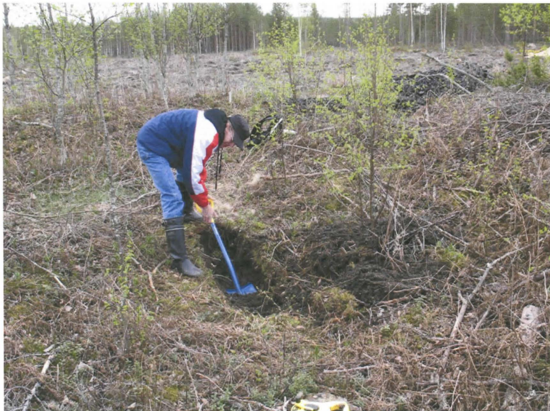
Kuva 6. Amanuessi Risto Käsälä kaivamassa koejaa.