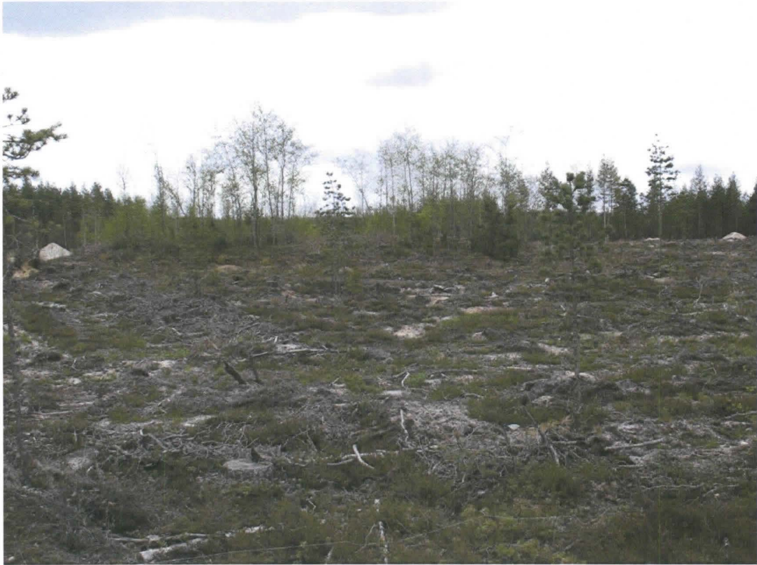
Kuva 1. Tervahauta sijaitsee tasaisella hiekkakankaalla.

KERTOMUKSEEN LIITTYVÄT KUVAT: