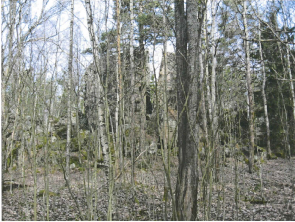
1. Turku, Kärsämäki, Pirunpesä. Haljennut siirtolohkare etelästä kuvattuna. Valok. Heljä Brusila. DT2009:35:003