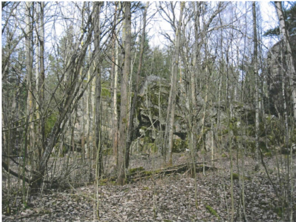
2. Turku, Kärsämäki, Pirunpesä. Pirunpesän länsipuolista louhikkoa etelästä kuvattuna. DT2009:35:004