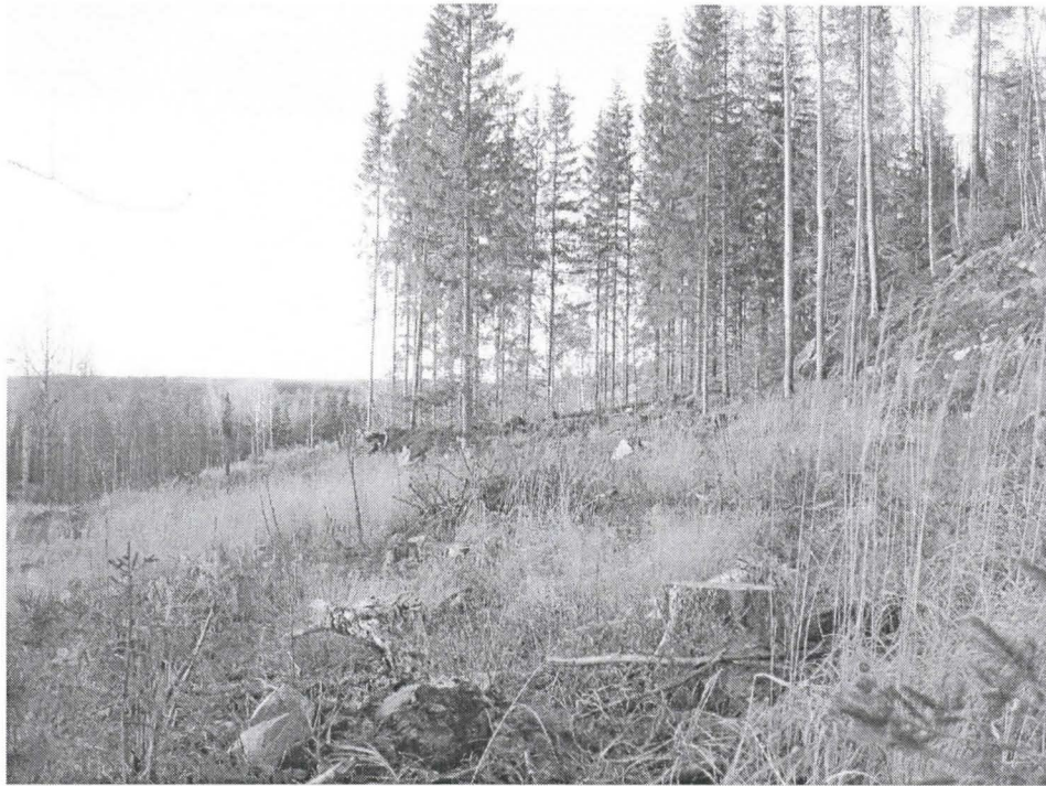
Kuva 1. Röykkiöalueen sijaintitasanne keskellä kuvaa.. Kuvattu kaakosta.