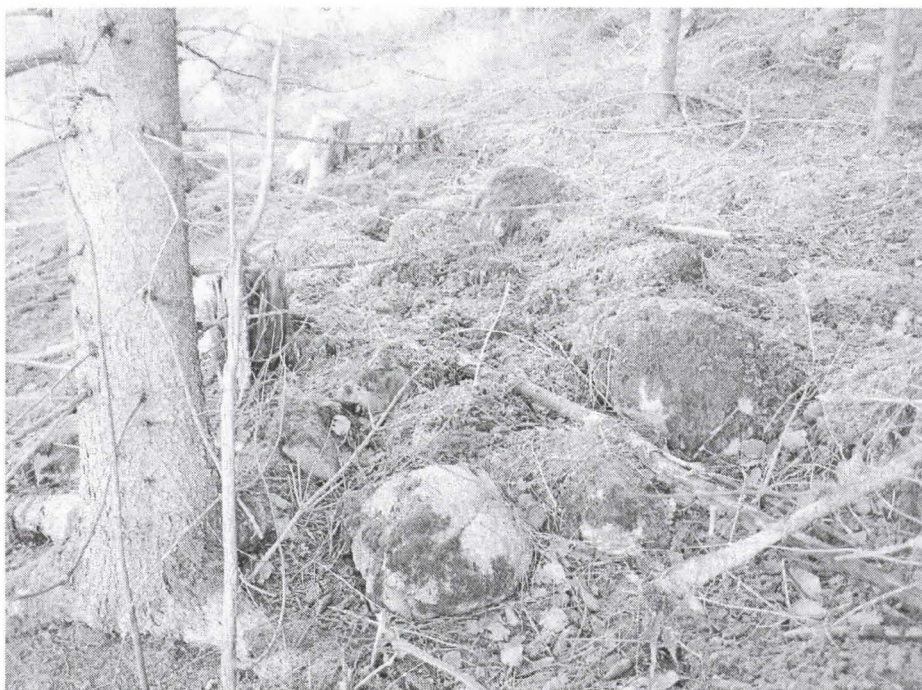
Kuva 6. Yksi kohteen röykkiöistä. Kuvattu kaakosta.