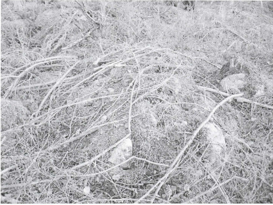
Kuva 3. Hakuutähteen peittämä röykkiö kohteessa. Kuvattu lounaasta.