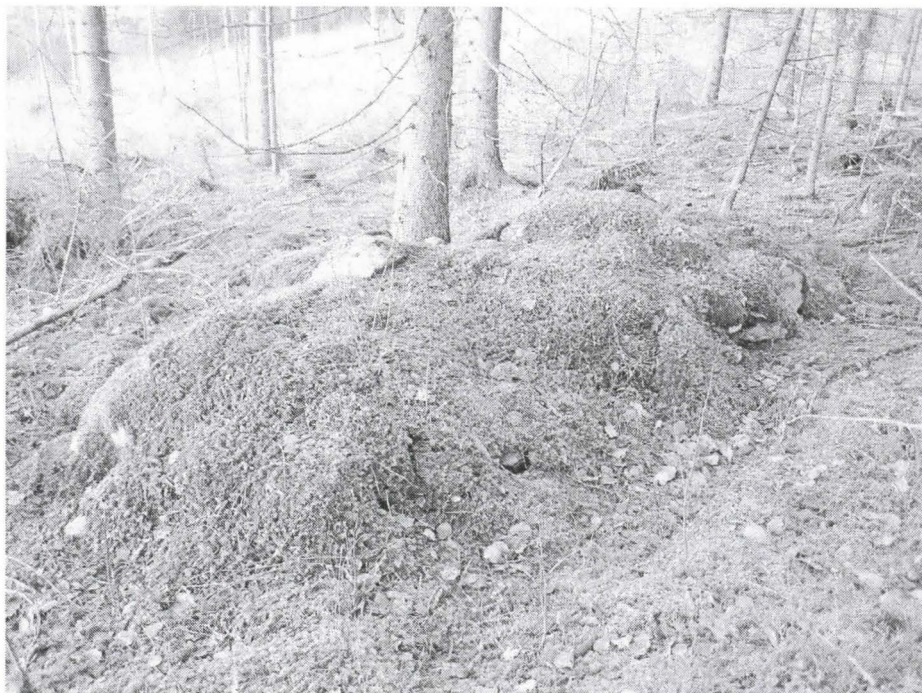
Kuva 5. Pitkänomainen röykkiö kohteessa. Kuvattu kaakosta.