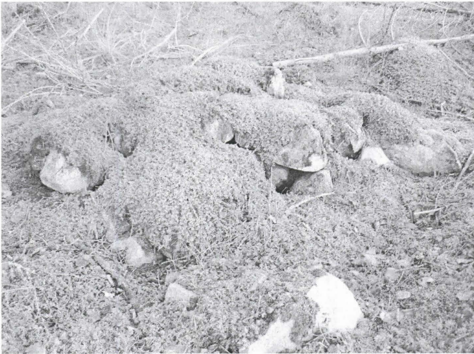
Kuva 4. Yksi kohteen röykkiöistä. Kuvattu lännestä.