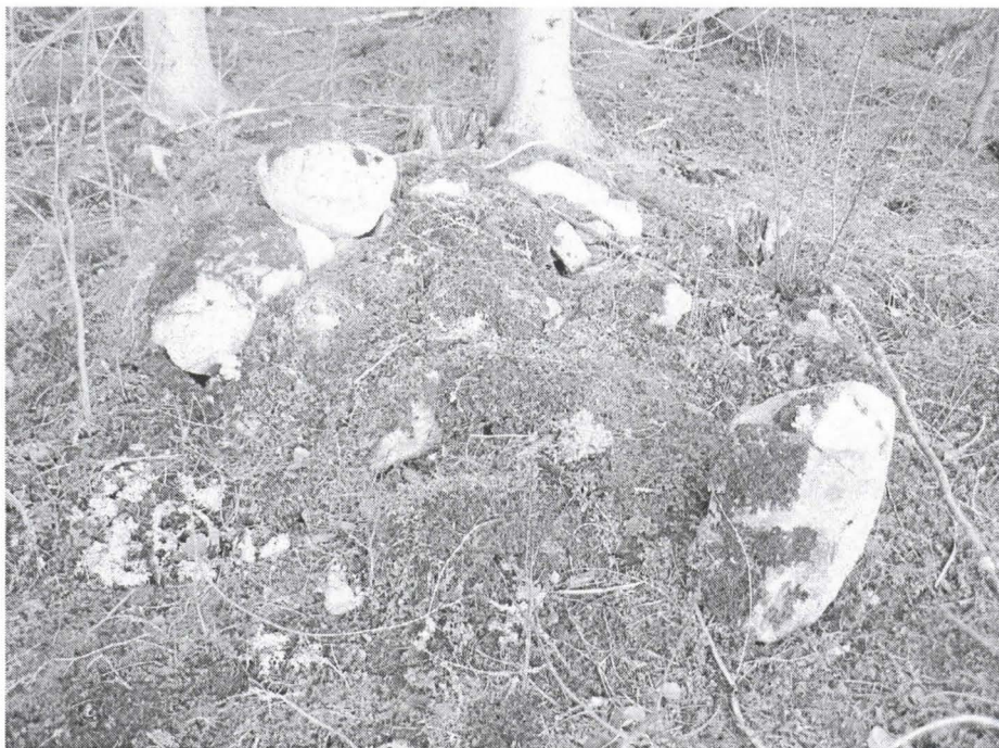
Kuva 2. Yksi kohteen röykkiöistä. Kuvattu lännestä.