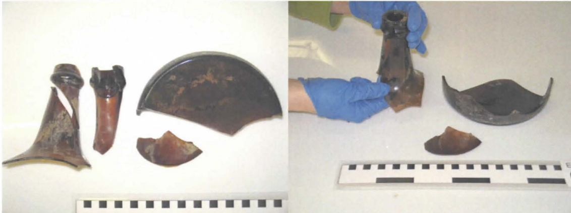
Kuvat 2. ja 3. Vaasa, Sundom, hylystä löytyneet pullon osat.

Pullon osat olivat liejukerroksen peitossa hyllyn rakenteiden välissä mutta pohjalaudoituksen päällä. Löytöpaikka oli pohjatukkien välissä, aivan kölilinjan vieressä eli kohdassa johon alusten pilssiin joutuneet esineet ja roskat päätyvät. Pullon joutumista hylkyyn jälkikäteen ei voida sulkea pois, mutta minusta vaikuttaa siltä että se liittyisi aluksen käyttöajankohtaan.