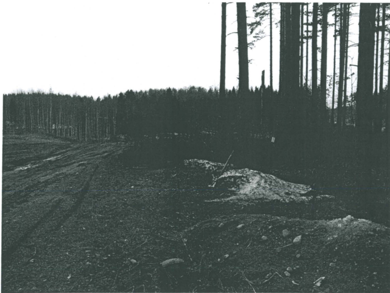
Kuoritun alueen länsireunaa, jossa muinaisjännöskyltti.