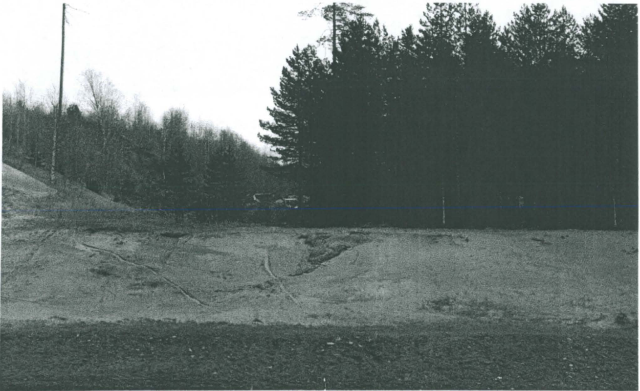
Kanavan asuinpaikan itäinen osa kuvattuna vt 5 länsipuolelta.

Tarkastus aloitettiin tielinjauksen länsipuolelle jäävältä alueelta. Siellä maanpinta on säilynyt ehjänä ja asuinpaikan laajuutta osoittavat muinaisjäännöskyltit olivat paikoillaan. Läntisellä alueella havaittiin maa-aineksen läjitystä muinaisjäännösalueen pohjoisosassa. Alueella ei enää ollut nähtävissä muinaisjäännöskylttejä, jotka oli laitettu paikalle vuoden 2003 kaivausten yhteydessä. Läntisen alueen keskivaiheilla pintamaata on poistettu noin 180 m pitkältä ja 35 m leveältä kaistaleelta, jolla on ajettu maansiirtokoneilla. Paikalla oli kauhakuormaaja. Tarkastuksen yhteydessä rikkoutuneesta maasta ei tehty löytöjä eikä havaittu värjäätynyttä maata. Maa oli käynnin yhteydessä hyvin märkä. Kuoritun alueen länsireunalla seiso i yksi muinaisjäännöskyltti. On oletettavaa, että tämä kyltti ei ole alkuperäisellä paikallaan.