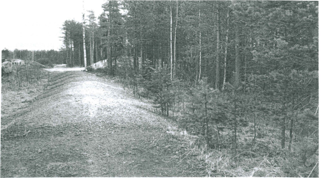
Läjitysalueita läntisen muinaisjäätännöksen pohjoisosassa. Kuvattu lännestä.