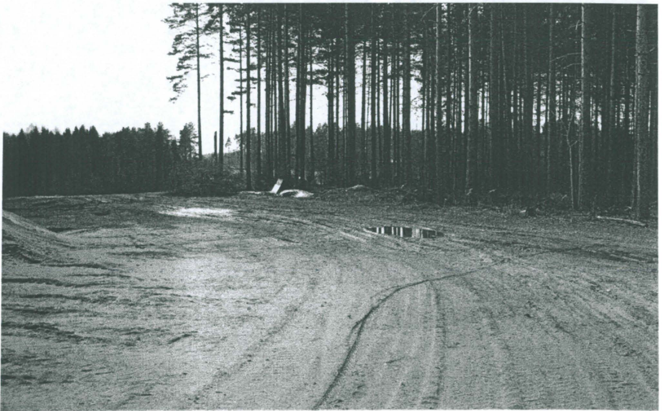
Kuorittu alue kuvattuna koillisesta.