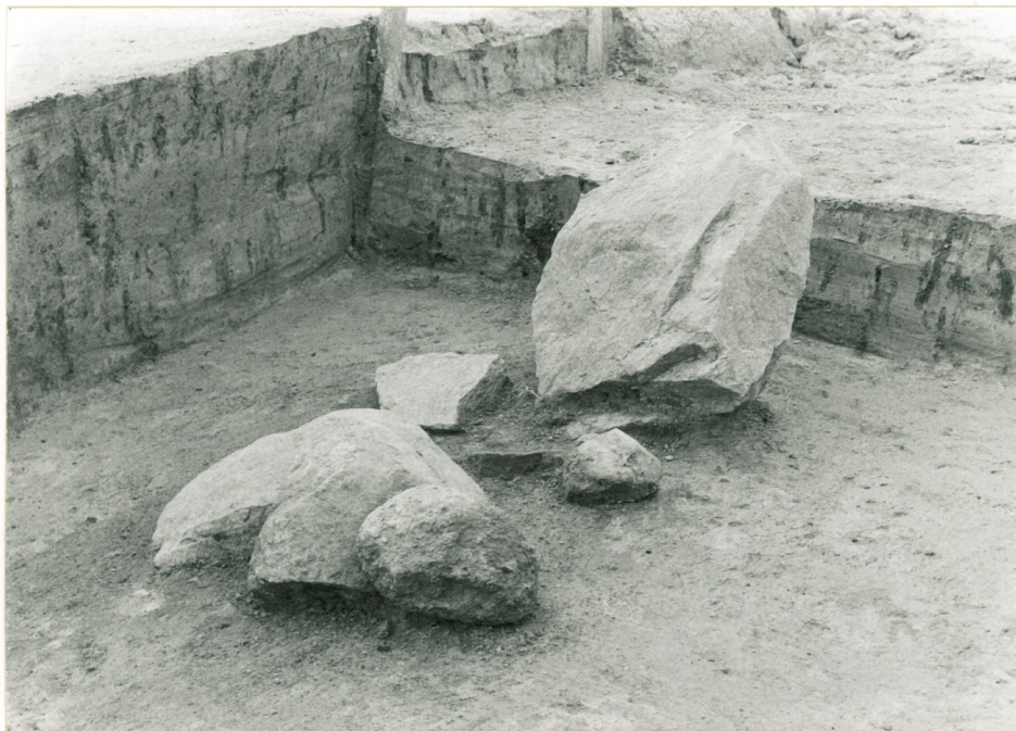
Kivitys ruudussa +10/-134. Kuvattu koillisesta.