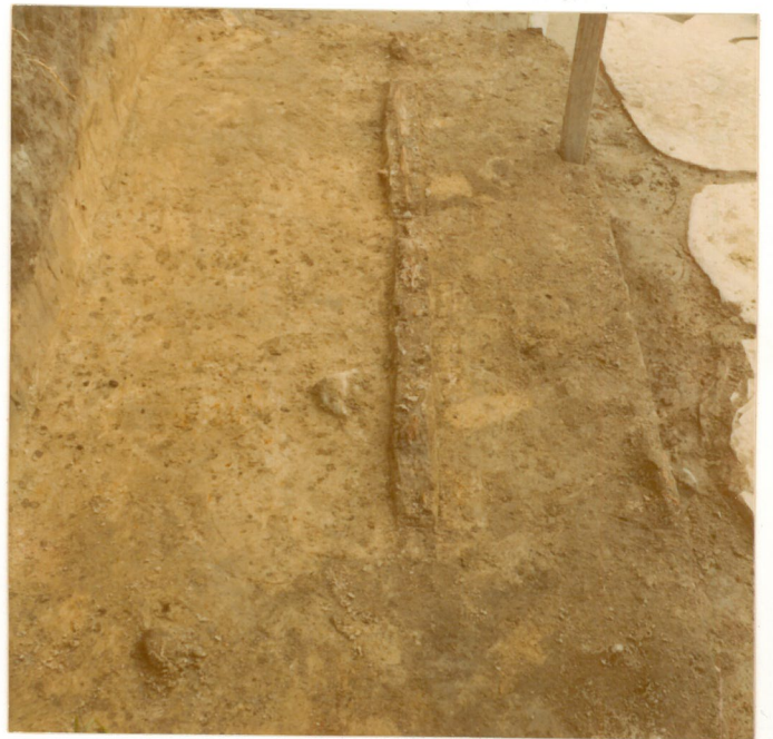
Puuseinämää ruuduissa +8/-120. neg. 209247 Kuvattu lännestä.