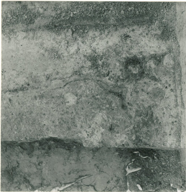
laattakivetyksen koilliskulman hilyjuova ja pystyruum jäänteitä. Ruutu + 101/-120. Kuvattu etelästä