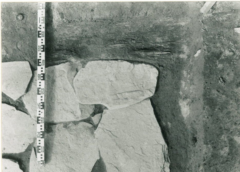
laattakivetyksen luoteismurkka. Kuvattu idästä.