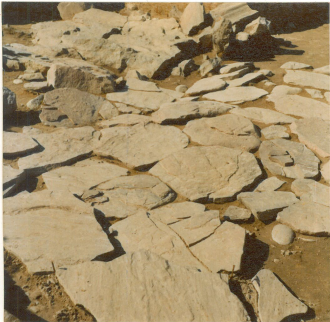
laattakivetyksen pintaa. neg. 209246 Kuvattu koillisesta.