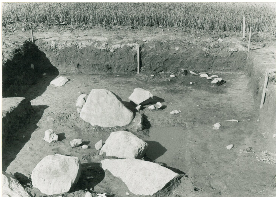
Ruudut +2, +4/-122, -124. Kuvattu idästä. neg. 209248