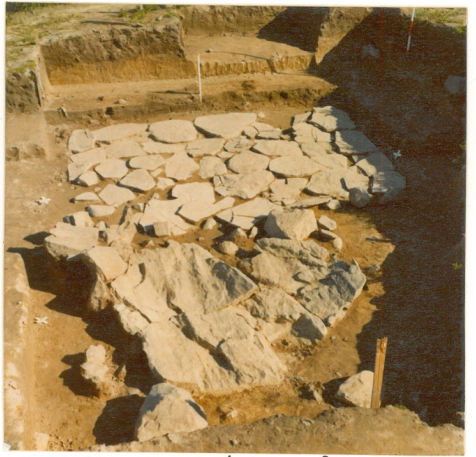
laattakivetyksen paljastettuna. neg. 209244 Kuvattu etelästä