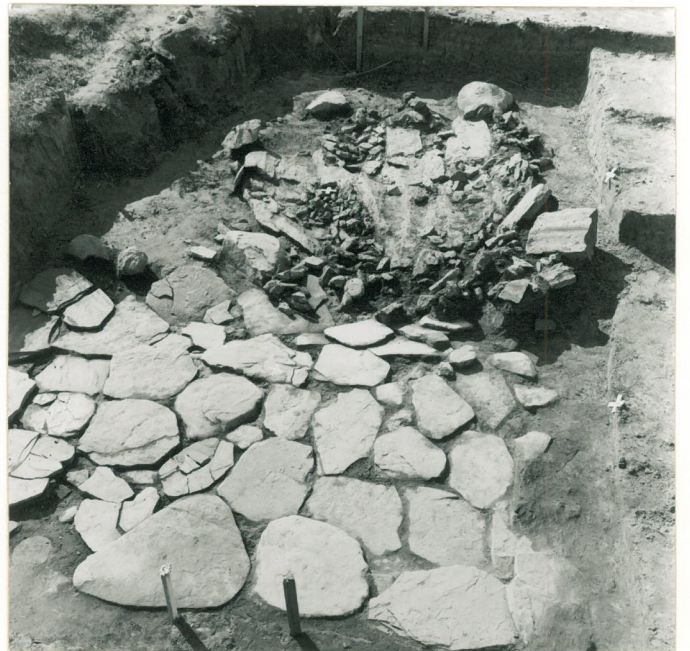
laattakivetyksen ja skirtlohkare lähe paljastunutta. Kuvattu pohjoisesta.