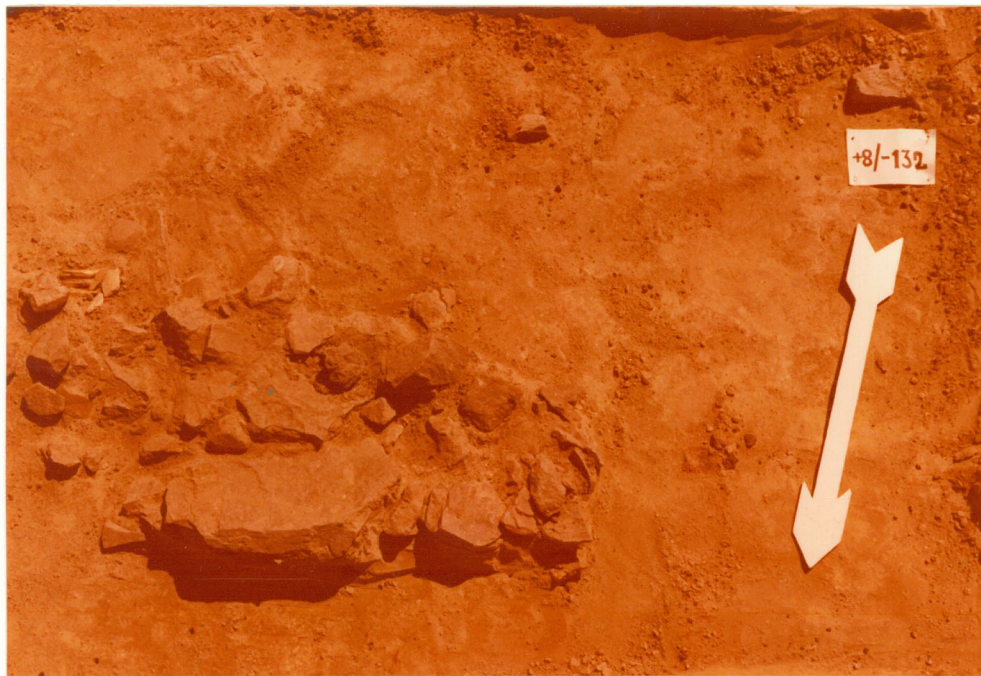
Kivitys ruuduissa +8/-132. Kuvattu pohjoisesta