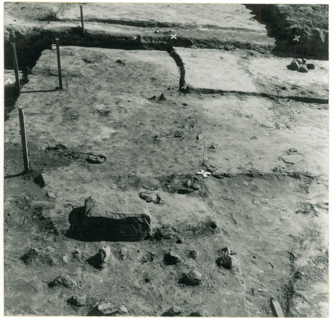
Ruudut +6, +8/-122, -124, -126, kuvattu pohjoisesta.