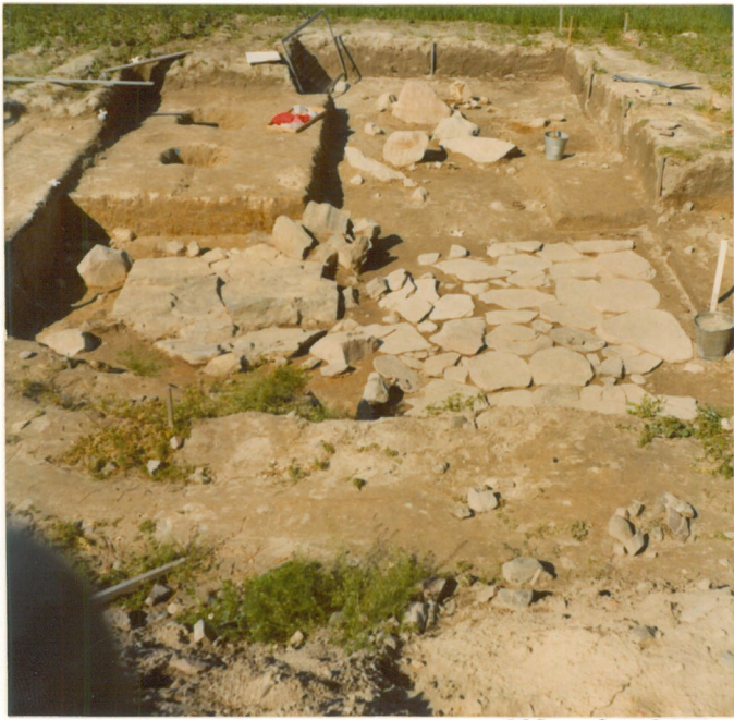
neg. 209245 Kaivausalueen pohjoisosa, kuvattu idästä.