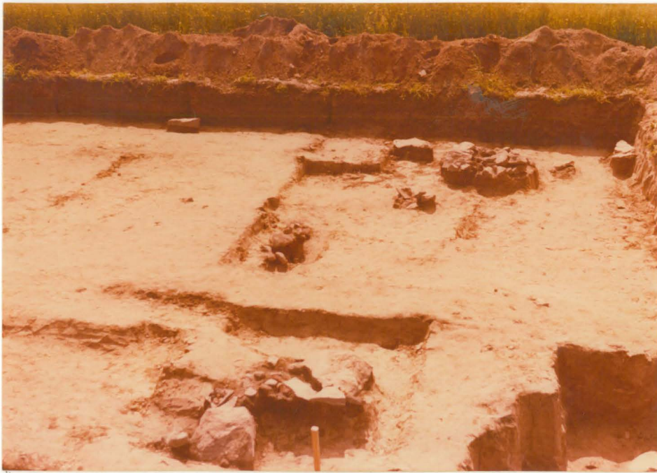
5. Alue a. Kuvattu pohjoisesta.