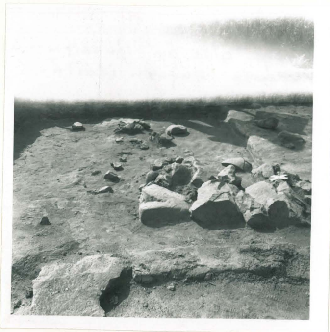
9. Kiveys alue a:n lounaisnurkassa. Kuvattu idästä.