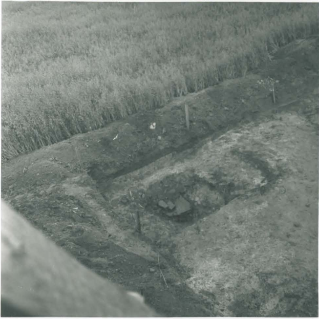
11. Alue a:n koillisnurkasta pal- jastunut kuoppa. Kuvattu luoteesta.