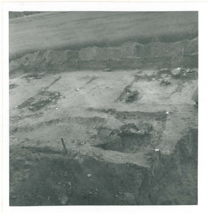
2. Alue a:n keskiosa, yleiskuva. Kuvattu pohjoisesta.