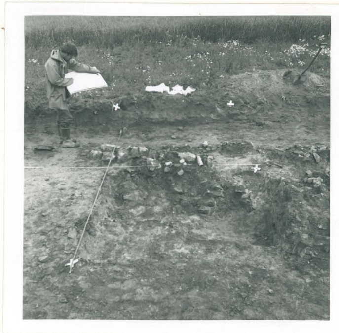
13. Kiveys alueella b. Kuvattu kaakosta.