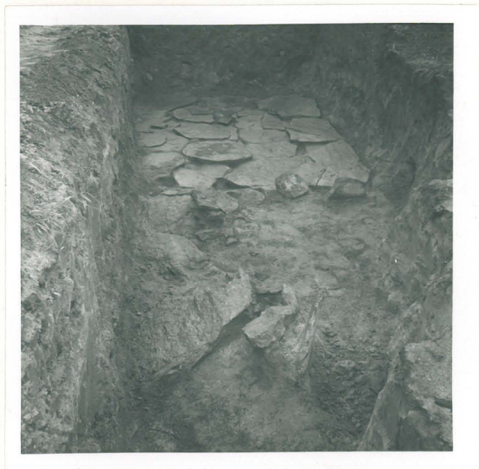
7. Laattakiveys alue a:n luoteisnurkassa. Kuvattu etelästä.