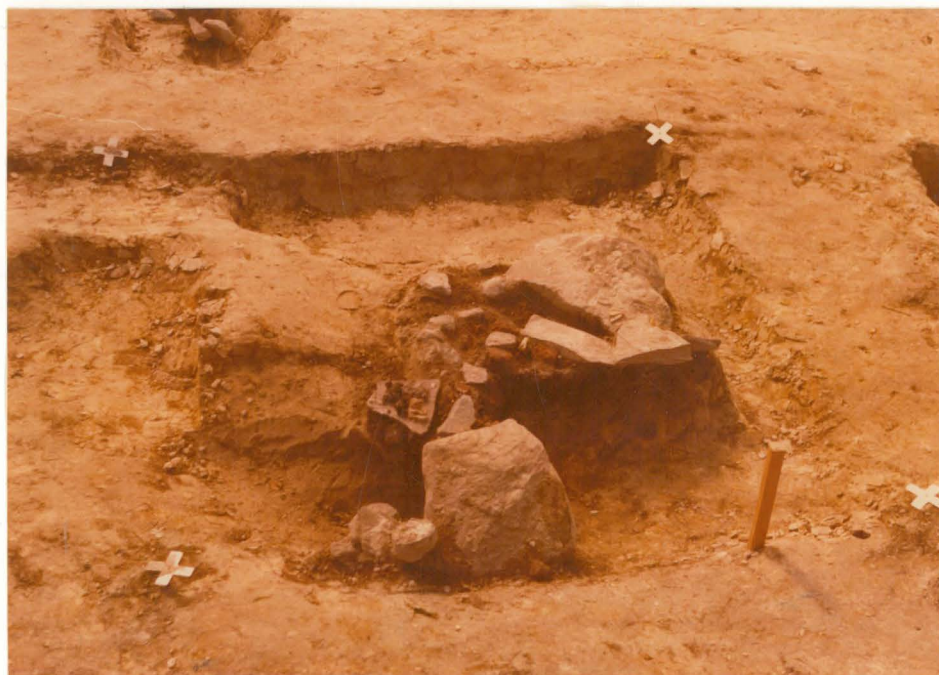
10. Kiveys ruudussa 12/-126. Kuvattu pohjoisesta.