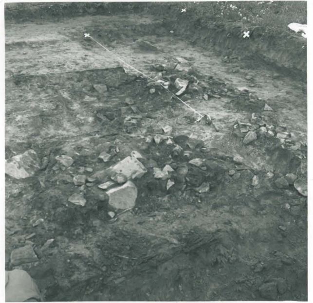
12. Kiveys alueella b. Kuvattu kaakosta.