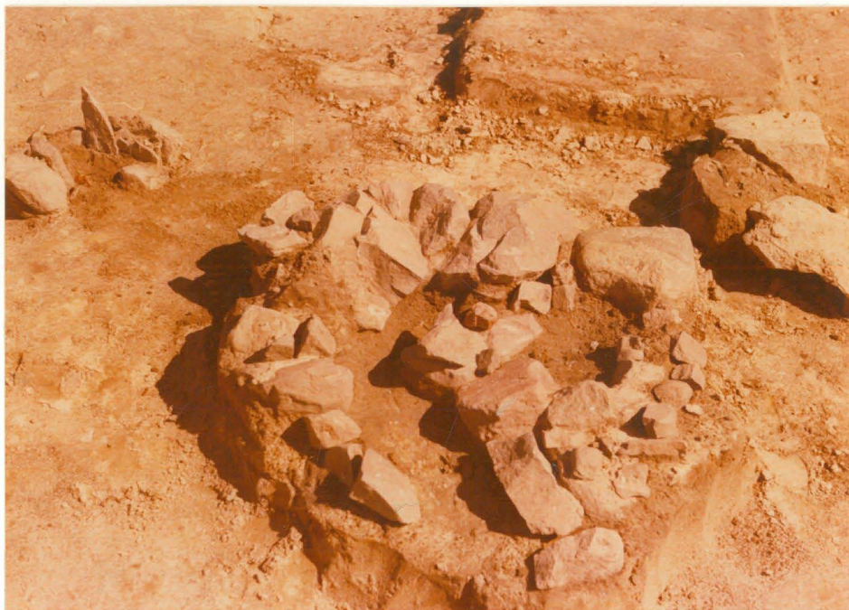
8. Kiveys alue a:n lounaisnurkassa. Taustalla paalunreikäkiveys. Kuvattu lännestä.