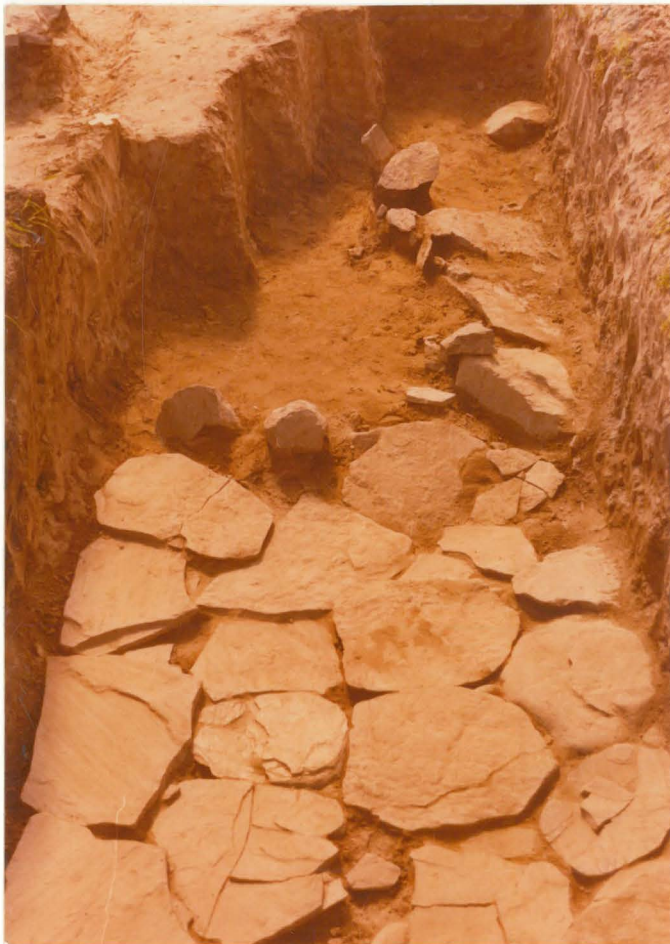
6. Laattakiveys alue a:n luoteis- nurkassa. Kuvattu pohjoisesta.