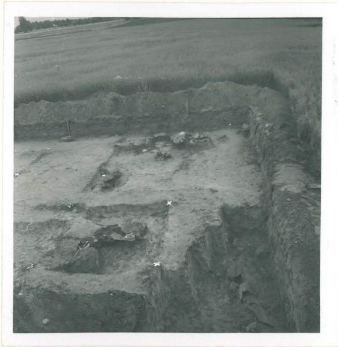
1. Alue a:n länsiosa, yleiskuva. Kuvattu pohjoisesta.