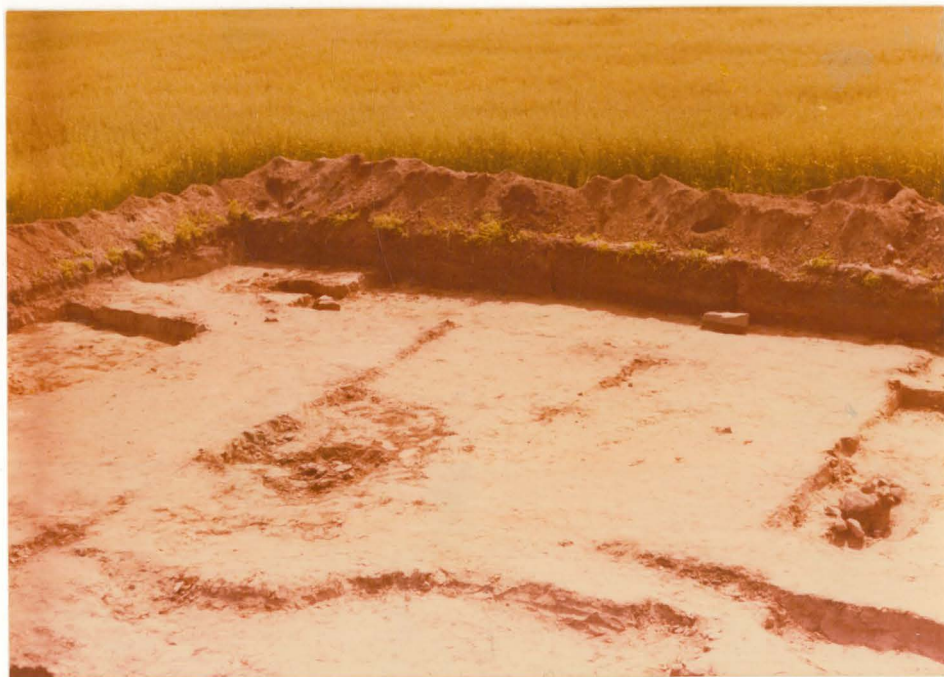
4. Alue a. Kuvattu pohjoisesta.