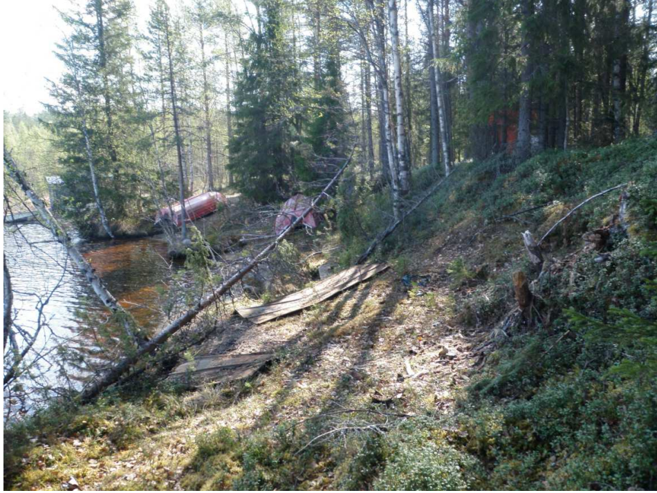
Kuva 1. Siikalahden muinaisjäännösalueen itälaitaa. Kuvassa rannan terassit.