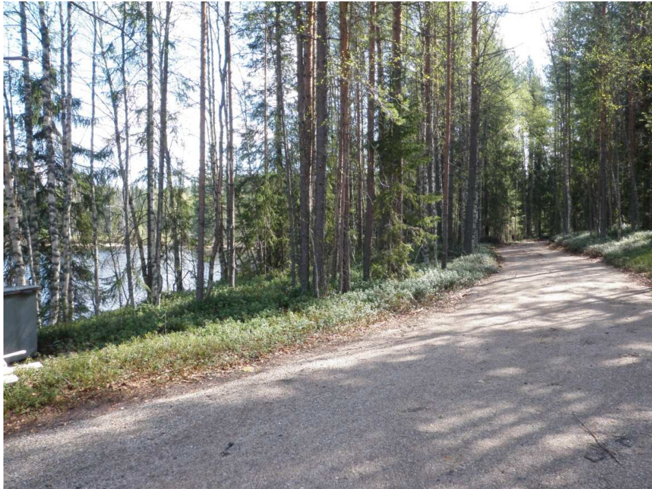
Kuva 2. Ylempi terassi, jota halkoo mökille johtava tie. Alue on nykyistä muinaisjäännösalueetta.