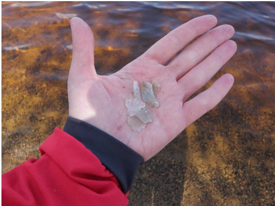
Kuva 4. Rannalta löydettyjä kvartsi-iskoksia