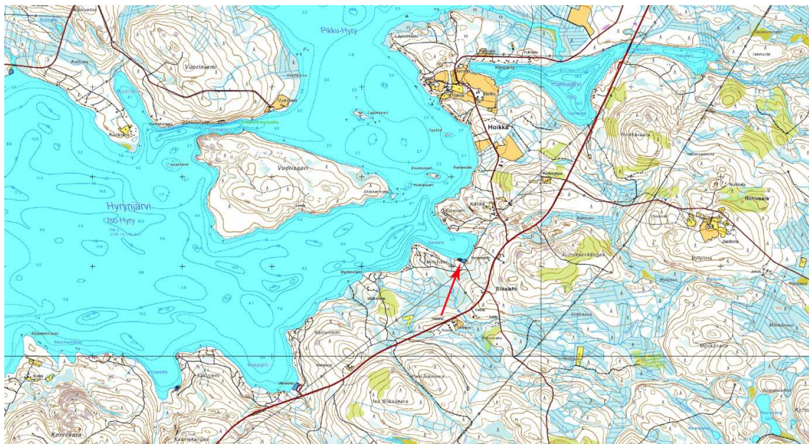
Kartta 1. Siikalahden kivikautisen asuinpaikan sijainti Hyrynjärven rannalla.

Hyrnsalmen Siikalahden kivikautisen asuinpaikan rajausta kattaa noin 88 metriä pitkä ja 44 metriä leveä alue Hyrynjärven rannalla (kartta 1). Järvi on säännöstelty, jonka takia maa rannassa on hyvin kulunutta. Muinaisjäännösalueen itäpäässä on kaksi terassia, joista alempi on noin 0,5 m ja ylempi noin 2-2,5 metriä veden yläpuolella. Ranta paikalla on matala ja se on paikoin hiekkaisa ja paikoin hyvin kivistä.