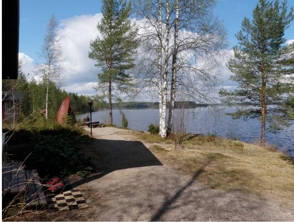
Kuva 5. Mökin piha-alue. Kuvassa vasemman puoleisen männyn ja koivujen välissä on hiekkaranta, josta iskokset löytyivät.