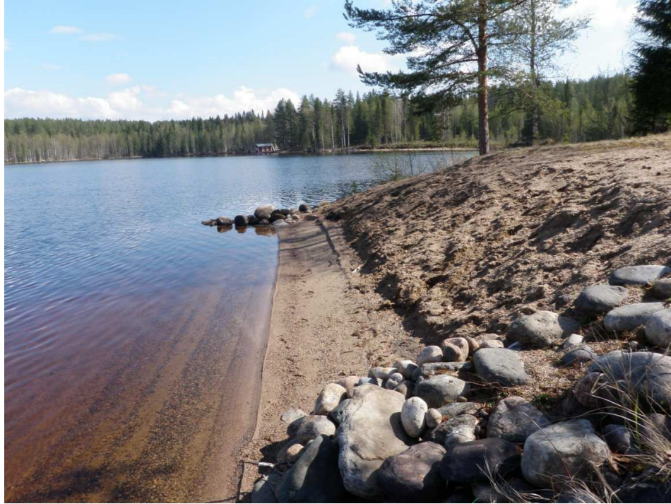
Kuva 3. Mökin ranta, josta löytyi kvartsi-iskoksia.