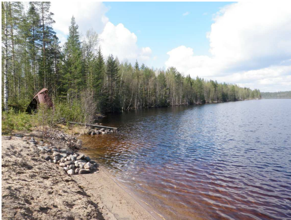
Kuva 6. Mökin ranta. Kuvan keskivaiheilla näkyy rannassa hieman notkallaan oleva koivu, jonka vieressä on joki/oja. Huurteen vuoden 1960 inventointiraportin kuvassa näkyy tämä nimenomainen alue. Alue on tuolloin ollut kuiva