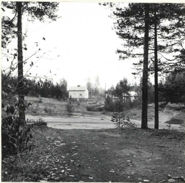
VIRREISEN KUVAN PÄÄSSÄ OLE- VA MUTKA