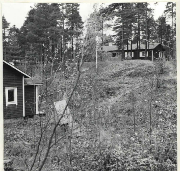
ELÄINL. A. KOKKOSEN TALO RAVELLIININ PÄÄLLÄ