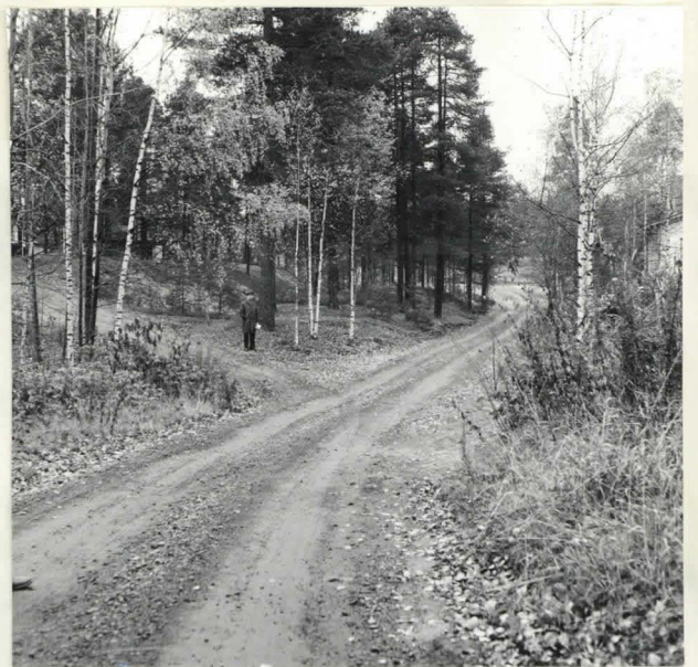
KOULULLE JOHTAVA TIE, VASEN- MALLA RAVELLIINI