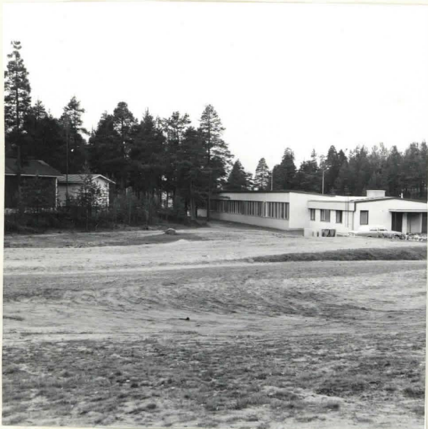
KANSAKOULU VALM. 1965.