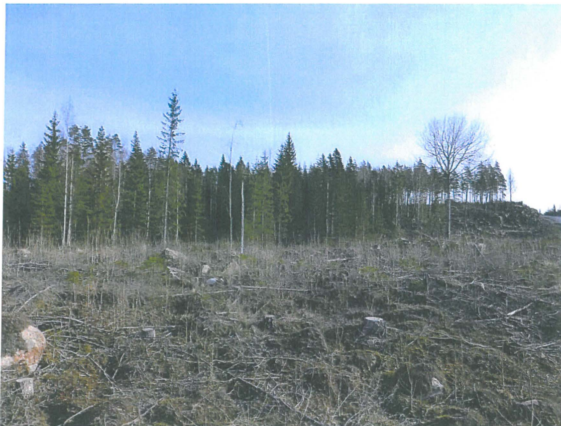
Hakkuualue ottamisalueen keskiosassa.