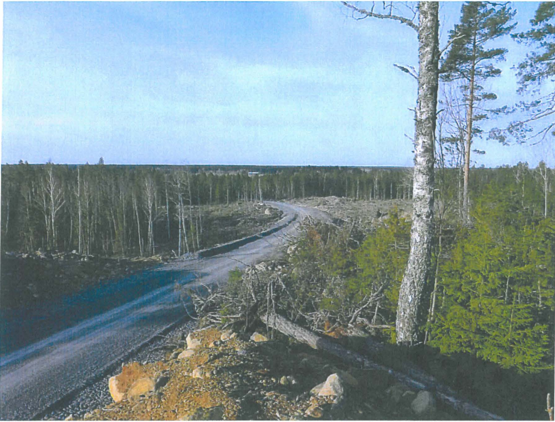
Yleiskuva tarkastusalueelta. Tuleva maa-aineksen ottamisalue tien kummallakin puolella.