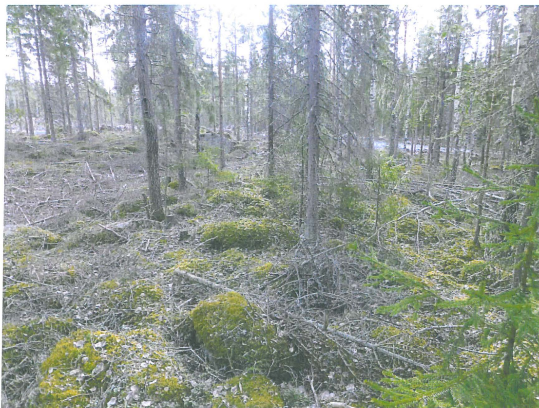
Alarinteiden louhikkoista maastoa.