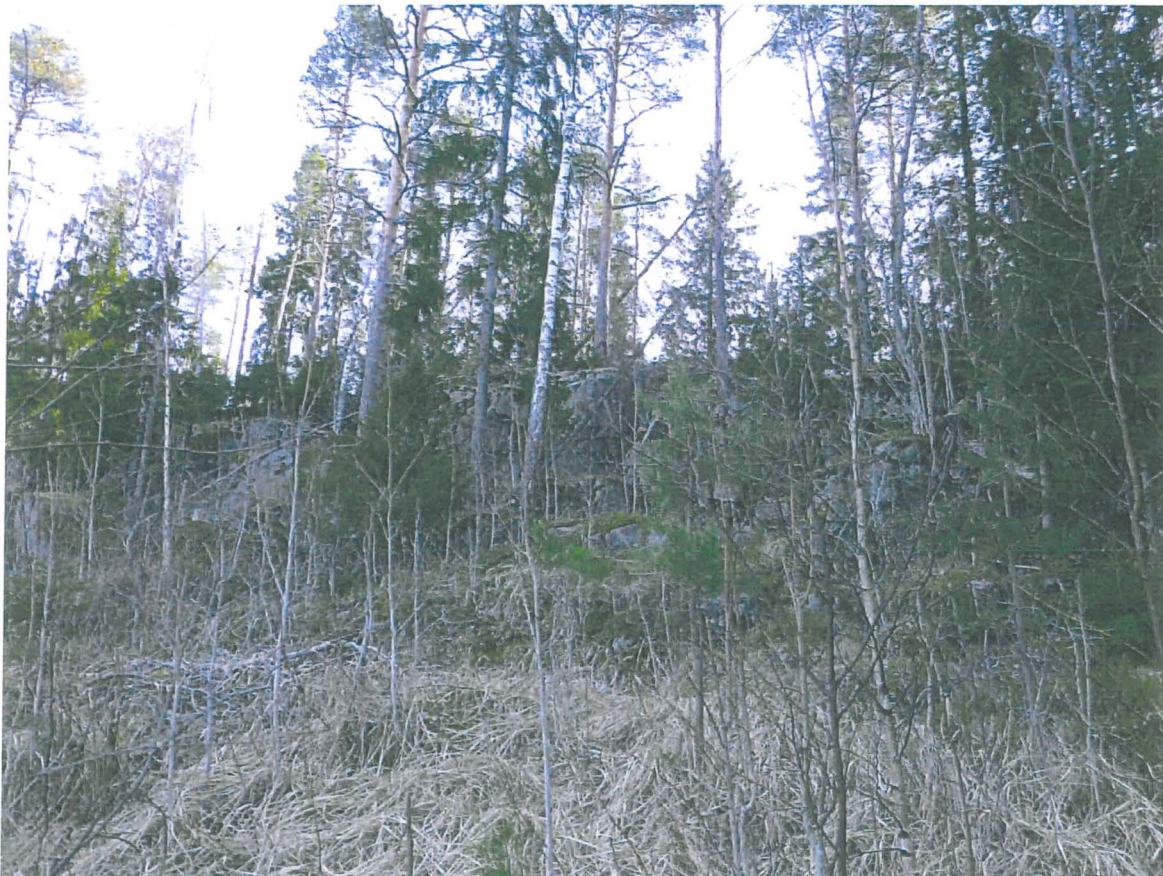
Kalliojyrkännettä tarkastusalueen keskiosassa.