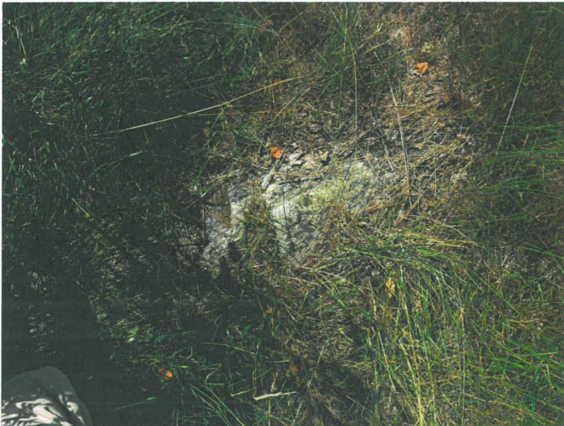
Asuinpaikan poikki kulkevan metsätien pinnassa oleva kvartsipitoinen kivi, josta tien pinnalta tavatut pienet kvartsin palat saattavat olla peräisin.