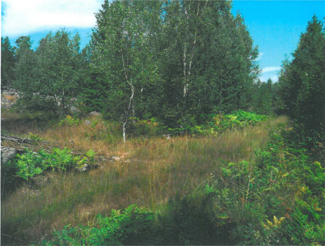
Dummeldalenin asuinpaikka etelästä kuvattuna.