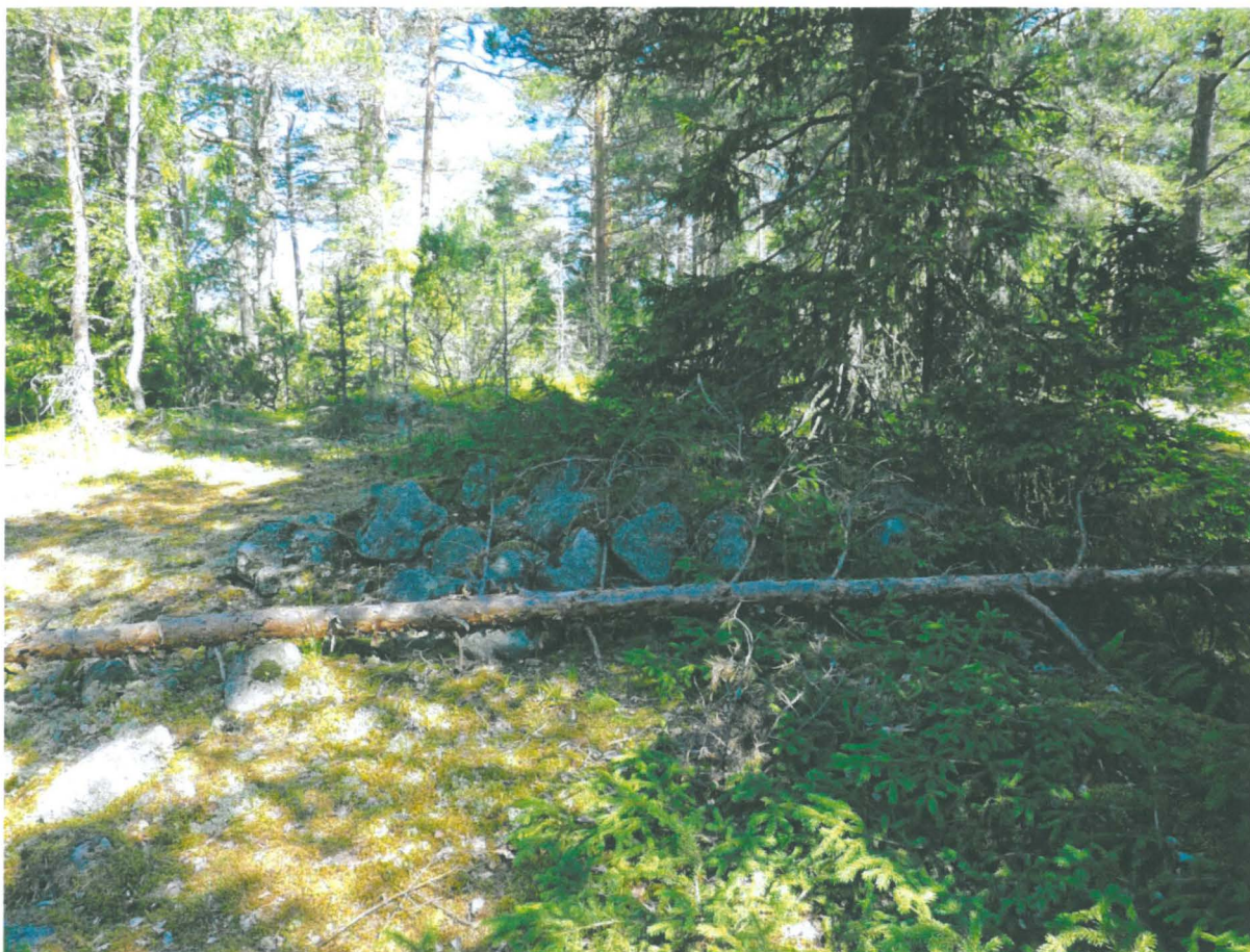
Hautaröykkiö luoteesta kuvattuna.