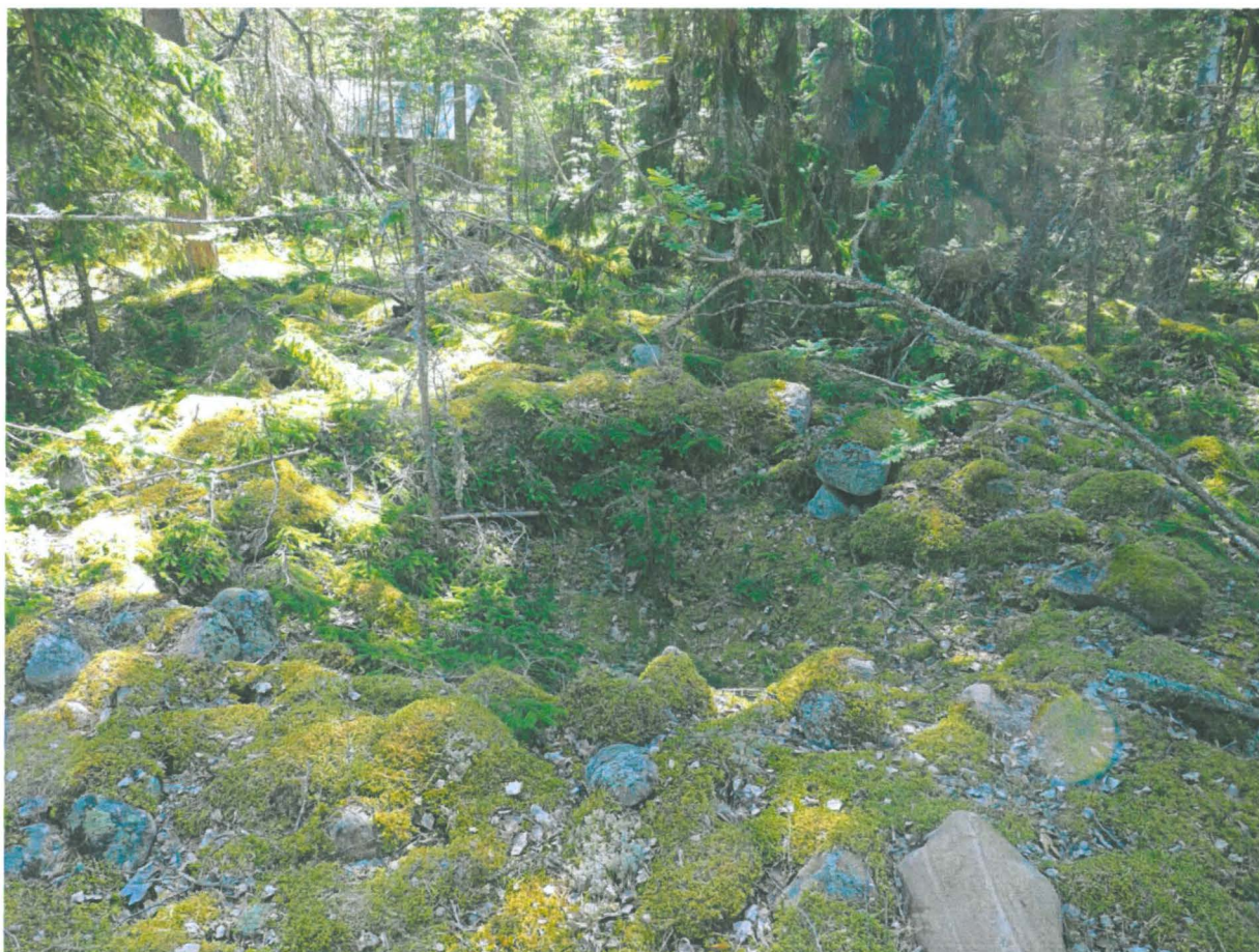
Iso rakkakuoppa muinaisrantakivikossa hautaröykkiön itäkoillispuolella. Kuvattu pohjoisesta.