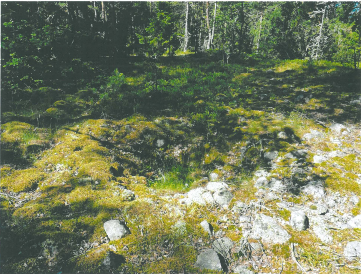
Pienempi rakkakuoppa muinaisrantaikivikossa hautaröykkiön koillispuolella. Kuvattu etelästä.