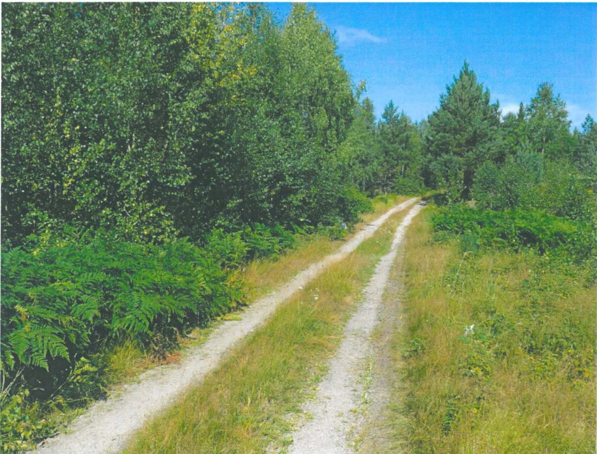
Rauvaisten asuinpaikkaa etelästä kuvattuna.