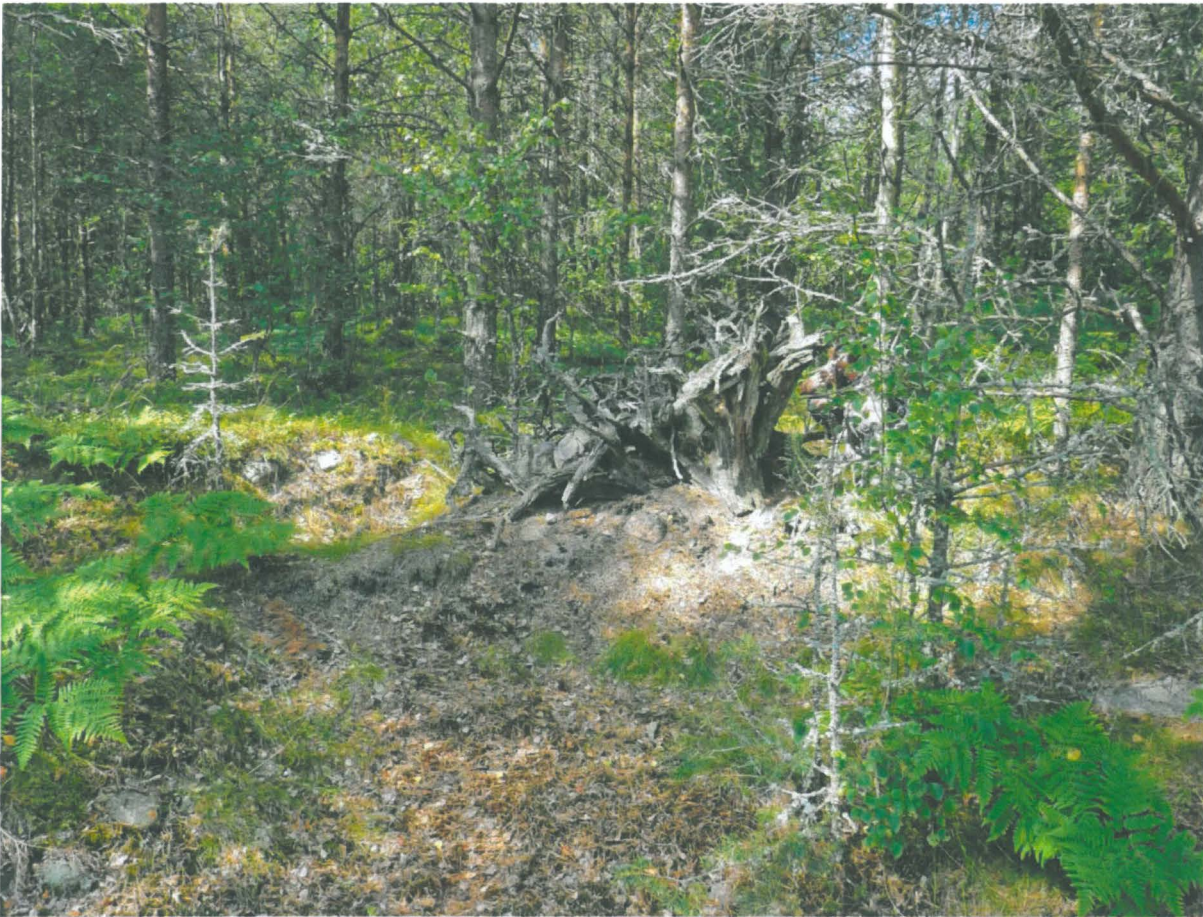
Asuinpaikalla oleva kaatuneen puun juurakko, josta löytyi kivilaji-iskos ja keramiikanpala. Kuvattu koillisesta.