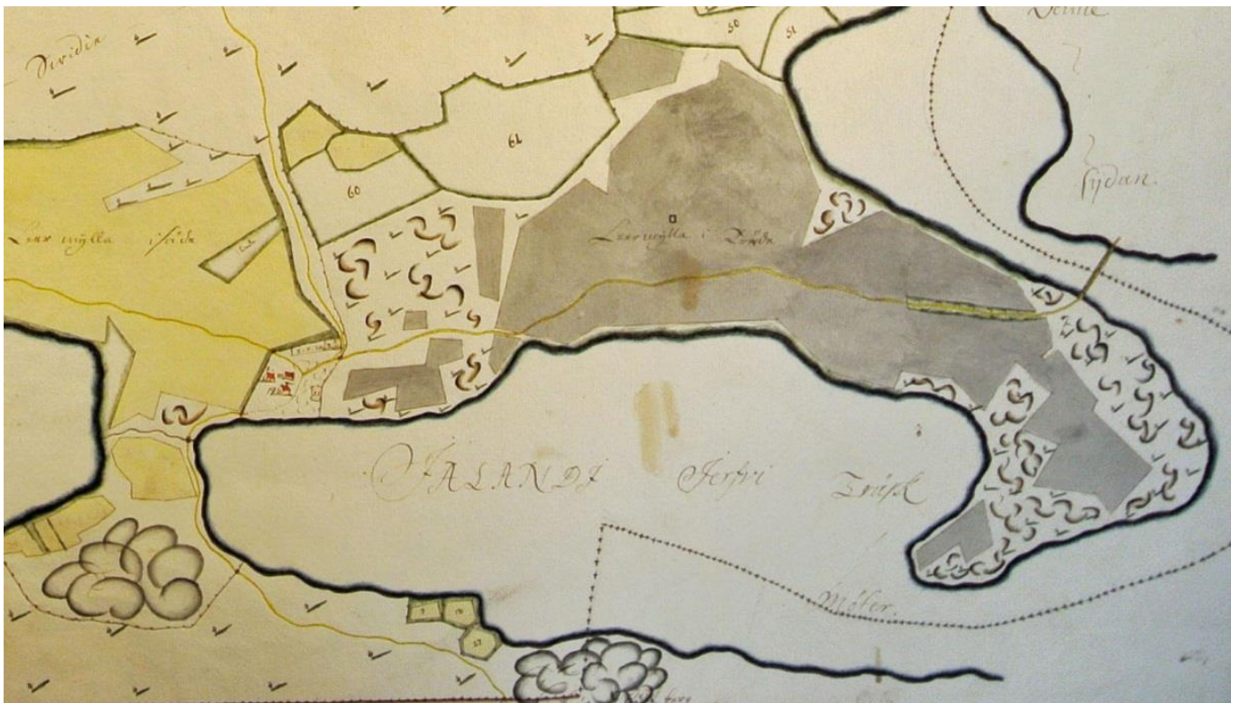
Kuva 5. Järviön kylä vuonna 1700 laaditussa kartassa. Kylään on merkitty kolme rakennusta sekä niiden pohjoispuolella kulkeva tie tai polku. Polun linjaus noudattelee nykyistä Järviöntien linjausta. Kylätontin itäpuolelta kohti pohjoista (luodetta) johtaa tielinja.