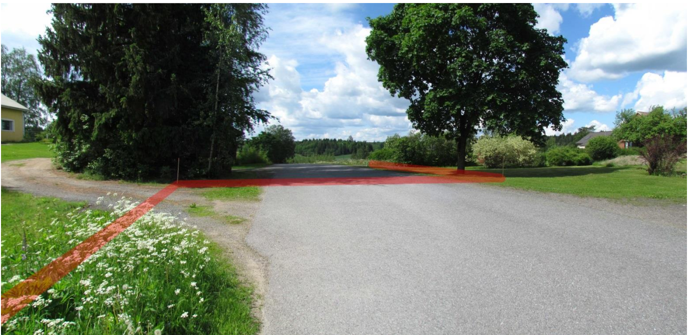
Kuva 3. Järviön kylä, Järviöntie 21:n kohdalla suunniteltu vesihuoltolinjaus alittaa tien. Molemmilla puolilla tietä on hoidettuja pihoja. Kuvaan on punaisella merkitty suunniteltu vesihuoltolinjaus. Kuvattu idästä.

Kulttuuriympäristöpalvelut Heiskanen & Luoto Oy