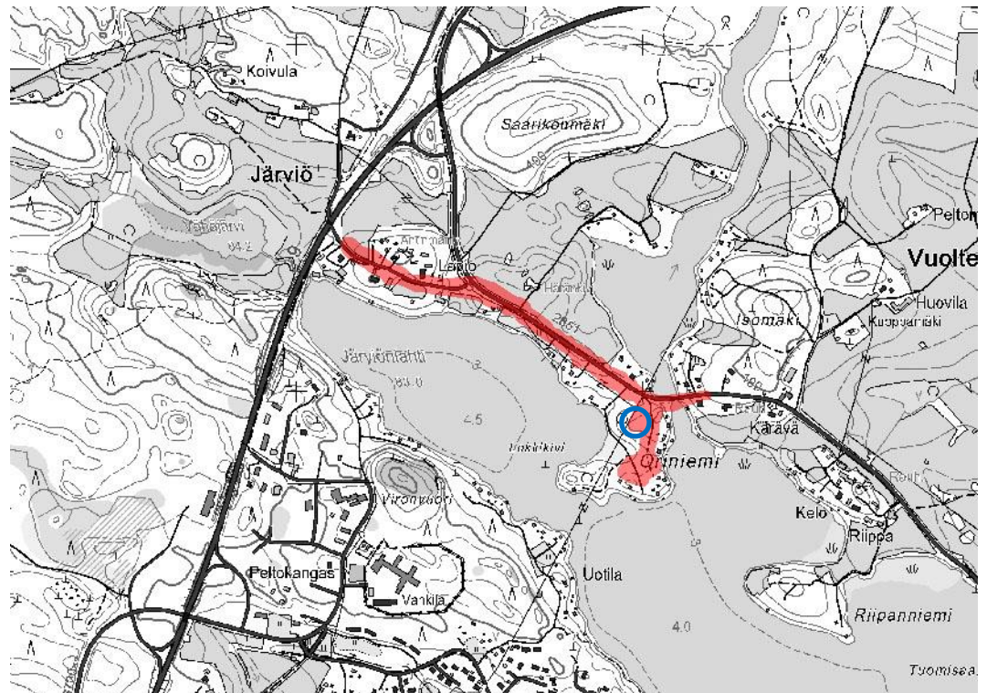
Kartta 3. Maastossa tarkemmin tarkastetut alueet (punaisella). MK 1 : 20 000. Sinisellä ympyrällä on merkitty tarkemmin koekuopitettu alue.