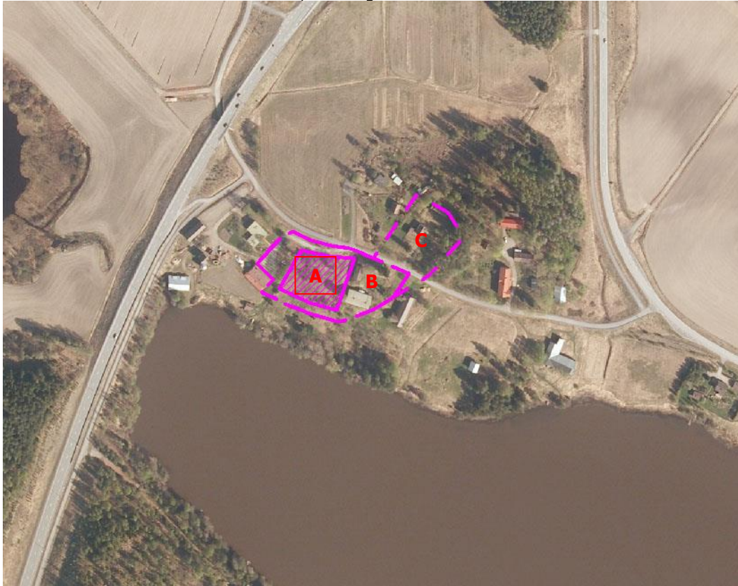
Kuva 8. Kylän tonttimaiden ajoittuminen ja ehdotettu muinaisjäännösraja. MK 1 : 5000.

A = Muinaisjäännös. Kylän tonttimaan autiona oleva osa. Tällä paikalla on sijainnut karttojen perusteella Naakkalan ja osin Hannulan tonttimaa 1700-luvun alussa.