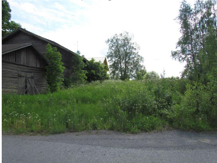
Kuva 4. Kylätontin aution osan itäpuolella on vanhoja talousrakennuksia.