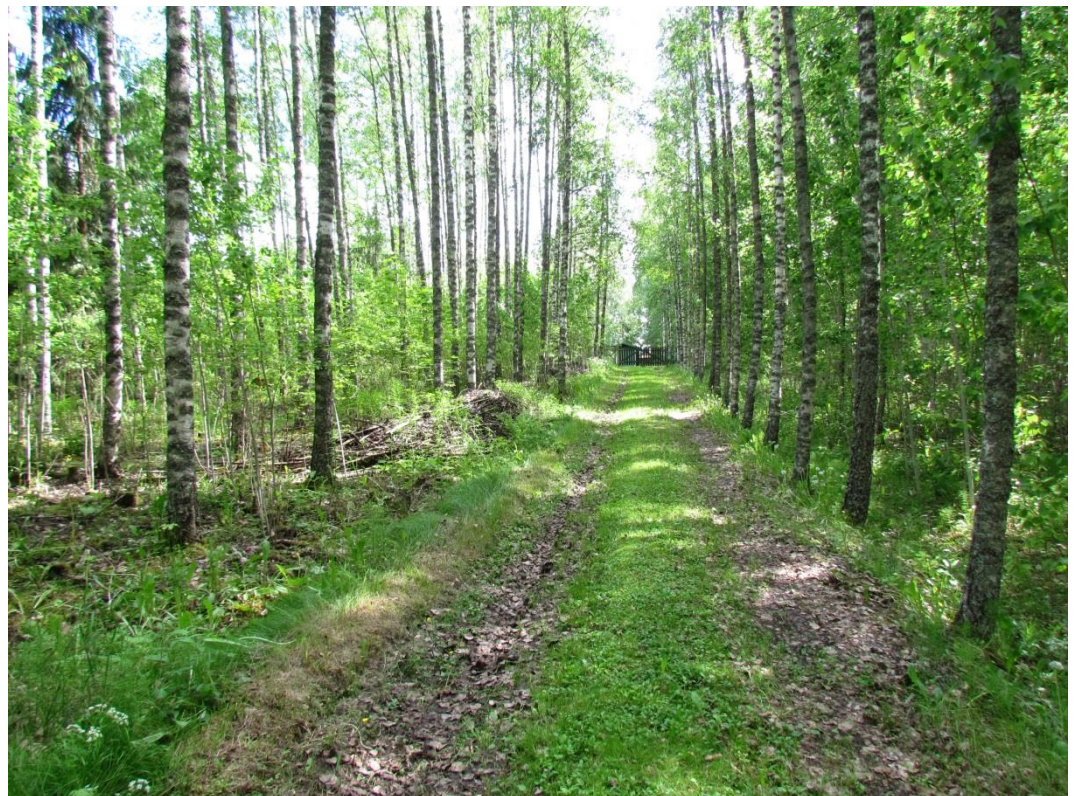
Kuva 1. Oriniemessä vesihuoltolinjaus on suunniteltu kulkemaan mökkien laidassa.

Kohteita ja inventoinnin kulkua dokumentoitiin sanallisen kuvauksen lisäksi ottamalla digitaalivalokuvia ja paikantamalla tehdyt havainnot satelliittipaikanninta (tarkkuus +/- 5 - 10 m) käyttäen. Kohteiden koordinaatit on ilmoitettu ETRS-TM35FIN -tasokoordinaatteina. Jälkityövaiheessa digitaalivalokuvat luetteloidiin Kulttuuriympäristöpalvelut Heiskanen & Luoto Oy:n arkistoon ja kartat piirrettiin puhtaaksi käyttäen Map Info- GIS paikkatieto-ohjelmistoa.