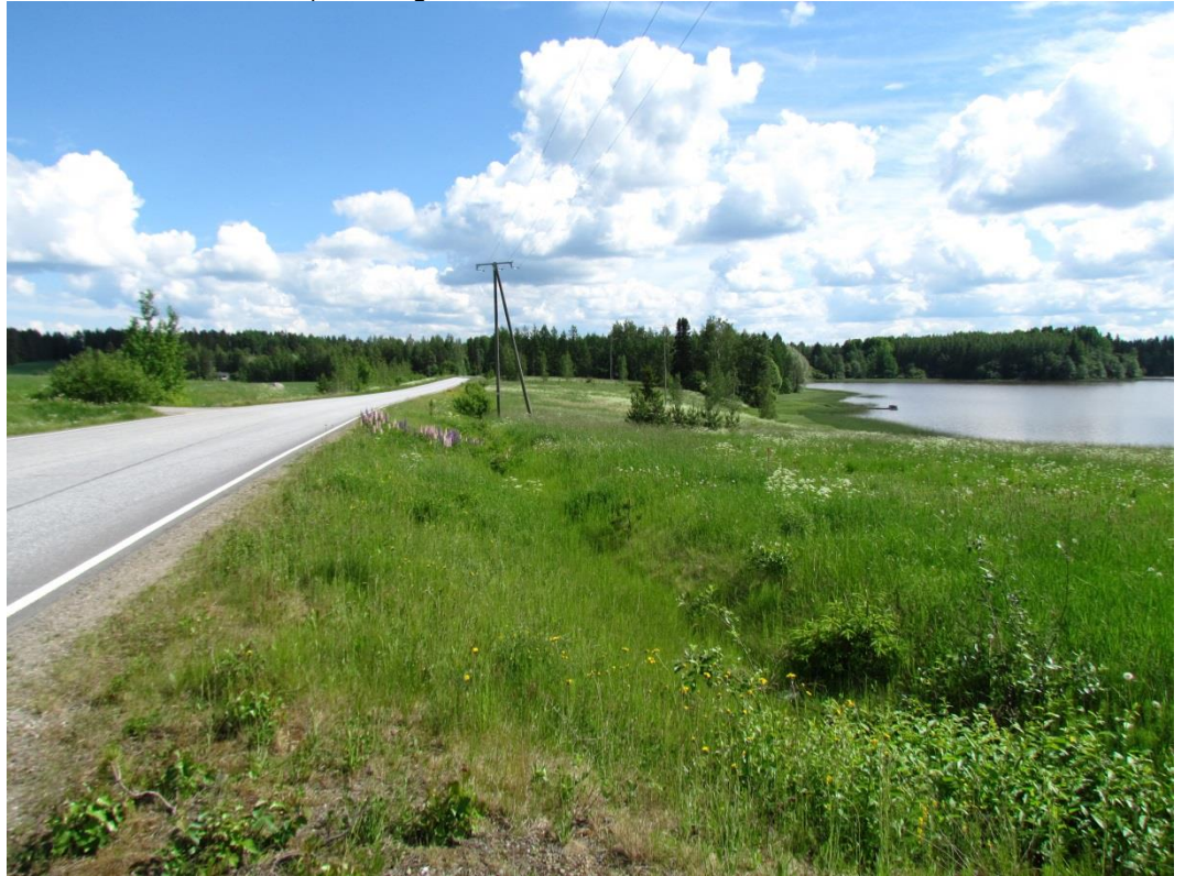
Kuva 2. Sontulantien eteläpuolella pellot olivat kesannolla. Suunniteltu linjaus on merkitty kulkemaan tien etelä, eli kuvassa oikealla puolella.