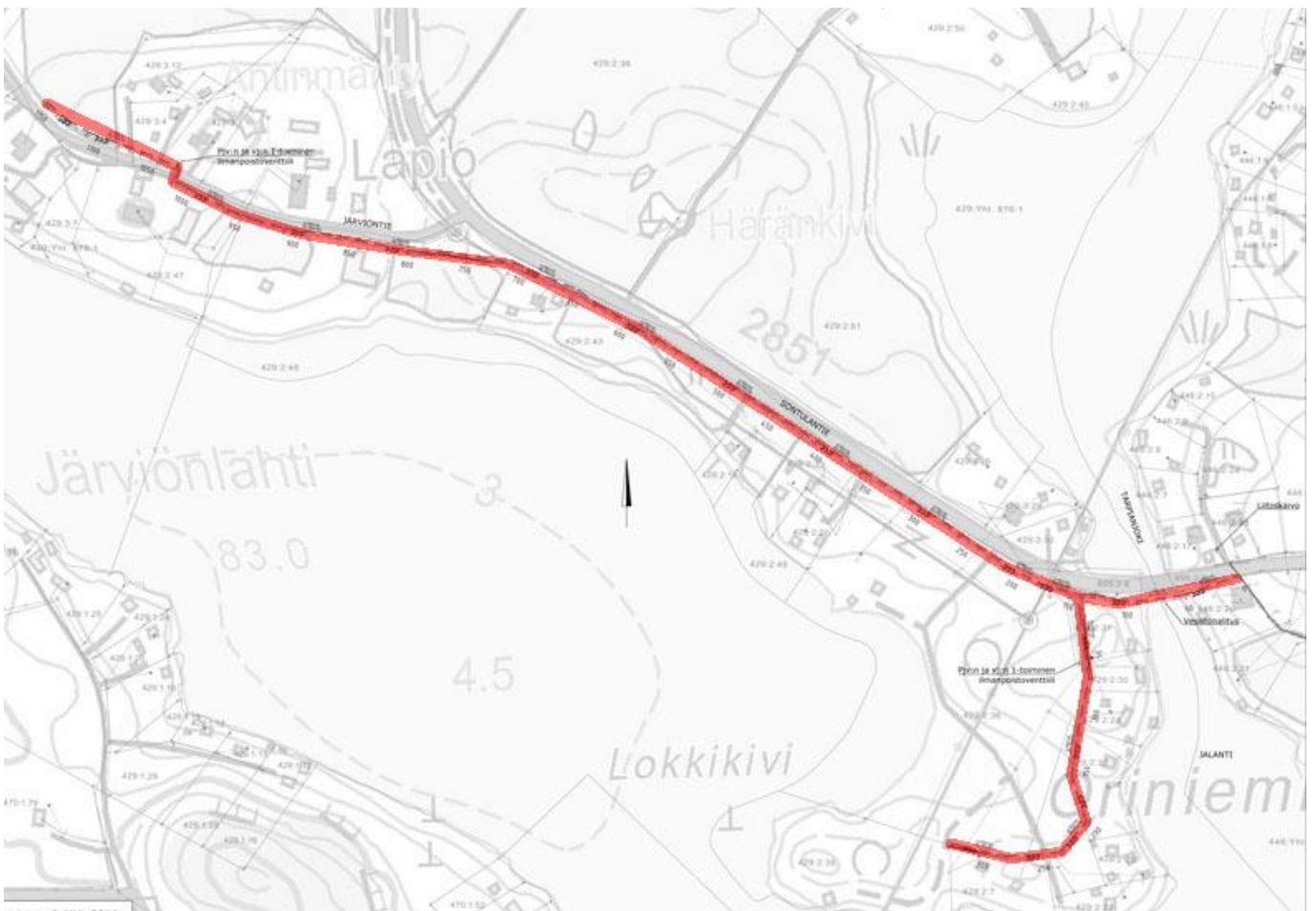
Kartta 2. Asemapiirustuksen (3.4.2014) mukainen suunnittelualue. Ei mittakaavassa. Vesihuollon linjaus korostettu punaisella värillä.

Alueella on aiemmin inventoitu vuonna 1996 (Jussila & Lähdesmäki), jolloin toteutettiin Kylmäkosken arkeologinen perusinventointi. Inventoinnissa ei mainita kohteita, jotka sijaitisivat suunnittelualueella. Lähistön muinaisjäännöksistä voidaan mainita Riipanniemen rökkiöalue (muinaisjäännösrekisterinumero 310010005) ja Tarpian kivikautinen asuinpaikka (mj. rek. nro 310010007).