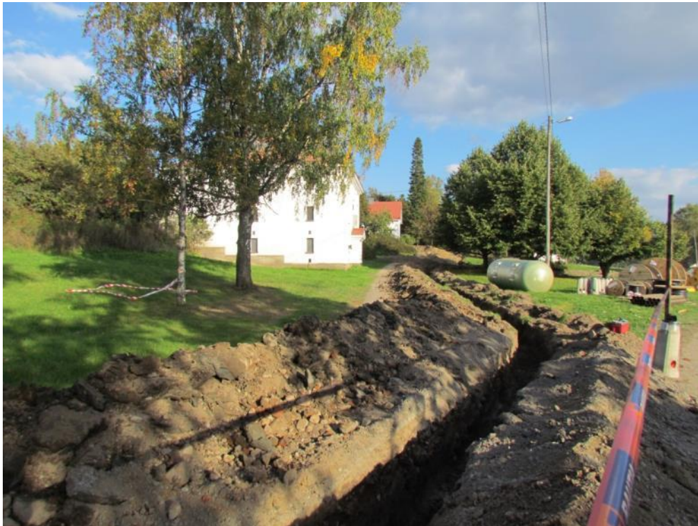
Kuva 2. Hinsalantien risteyksestä kohti kartanon piha-alueetta. Koivun takana näkyy viljamakasiini.

Kenttätyövaiheessa tehdyt havainnot dokumentoitiin kirjaamalla niistä muistiinpanoja, valokuvaamalla digitaalikameralla sekä piirtämällä alueesta ja havainnoista karttaluonnos. Jälkityövaiheessa kartat piirrettiin puhtaaksi käyttäen MapInfo GIS -paikkatieto-ohjelmistoa ja digitaalikuvat talletettiin Kulttuuriympäristöpalvelut Heiskanen & Luoto Oy:n arkistoon. Valvonnan yhteydessä tehtyjä löytöjä ei luetteloitu kansallismuseon kokoelmiin, esimerkkinä talletetut löydöt valokuvattiin ja kuvat liitettiin raportin yhteyteen.