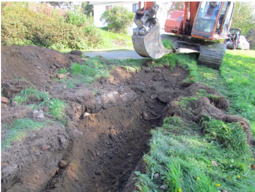
Kuva 6. Tilanhoitajantalon eteläpuolella (F1) havaittiin rakennuksen nurkkakivi sekä runsaasti tiilenpaloja.

Nurmen alta paljastui lohkokivi, joissa havaittiin porausjälkiä. Todennäköisesti kallion päällä on sijainnut kiviperusteisen rakennuksen nurkka. Nurkkakivien ympäröstössä havaittiin tiilenpaloja, posliinia, luunpaloja ja hiiltä. Esineistön ja lohkokivien työstötekniikan perusteella rakennuksen nurkkakivi ajoittuvat 1800-luvun lopulle tai 1900-luvun alkuun.