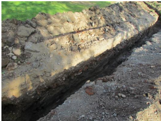
Kuva 4. Kaivettua ojaa Viljamakasiinin länsipuolella pihatien kohdalla. 18.9.2014.

Paikalla havaittiin täyttökerroksia aina 1 m syvyyteen saakka, luontaista maan- nosta ei tavoitettu. Kaikki kerrostumat liittyvät 1900-luvun maanrakennus-, pur- ku- tai korjaustoimintaan.