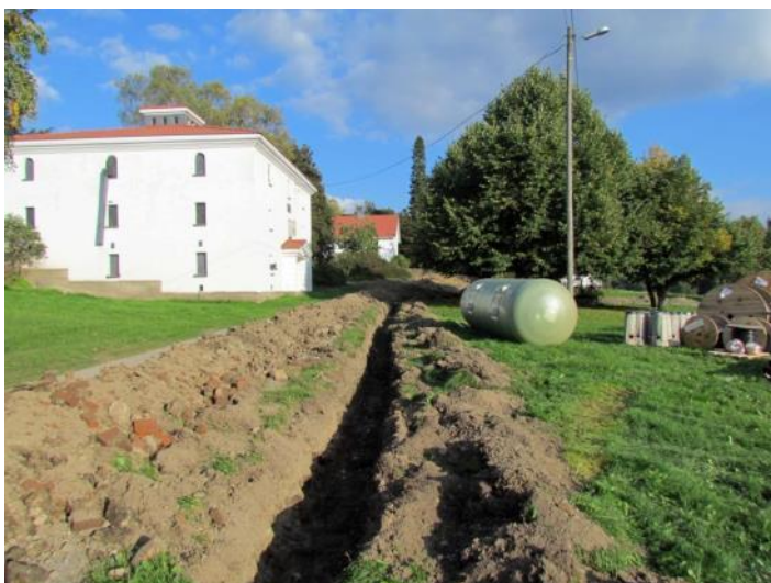
Kuva 1. Laukon kartanon Viljamakasiini, jonka ympäristöön valvontatyö keskittyi.