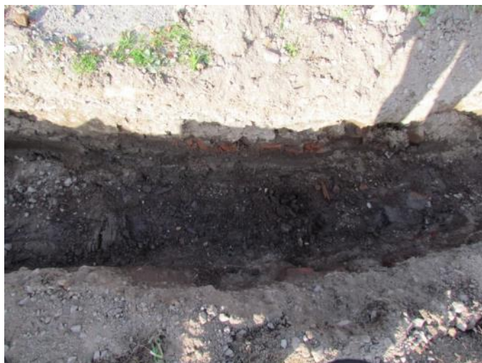
Kuva 5. Kaivannosta paljastuneen tiili ja laastikerroksen alapuolella oleva hii- likeros, jossa todennäköisesti päreiden jäännöksiä. Kerrostuma ajoittuneen Viljamakasiinin katon uusimisen aikaa.