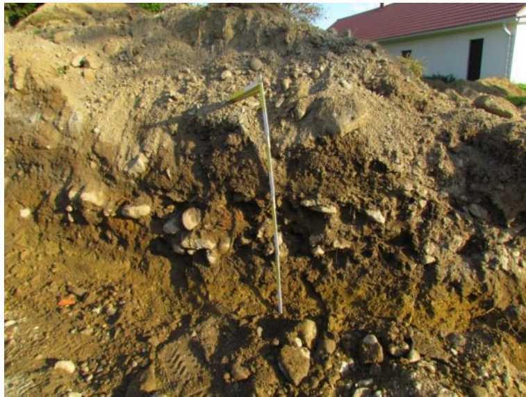
Kuva 7. Pihatien profiili. 18.9.2014.

Kivi ja tiilikerros on todennäköisesti syntynyt vuoden 1918 tapahtumien jälkeisten purku- ja rakennustöiden tuloksena. Tällä kohtaa ei havaittu merkkejä aiemmasta tielinjasta.