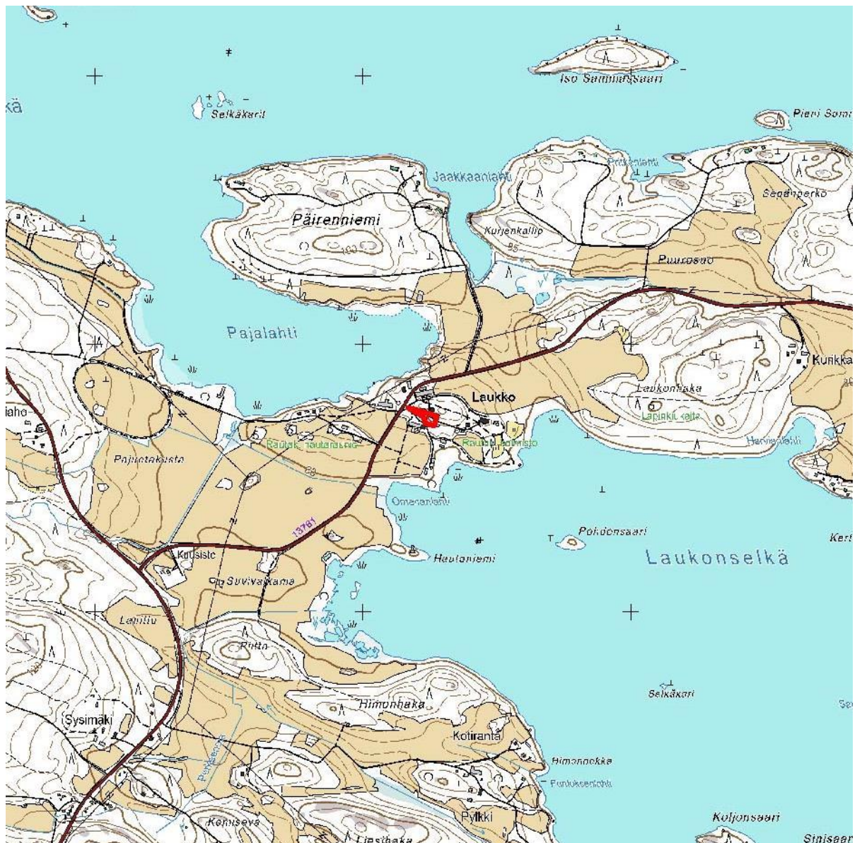
Kartta 2. Arkeologisesti valvotun alueen sijainti. MK 1 : 20 000.

Valvottu alue kuuluu kokonaisuudessaan Laukon kartano -nimiseen valtakunnallisesti merkittävään rakennettuun ympäristöön (RKY-1993 ja RKY-2009). Entuudestaan Laukon kartanon alueelta tunnetaan rautakautisia löytöjä sekä kalmistoja. Esihistorian ohella Laukon maisemahistoriaan liittyy keskiaikainen kylä, kartano ja kivistä rakennettu kellari.