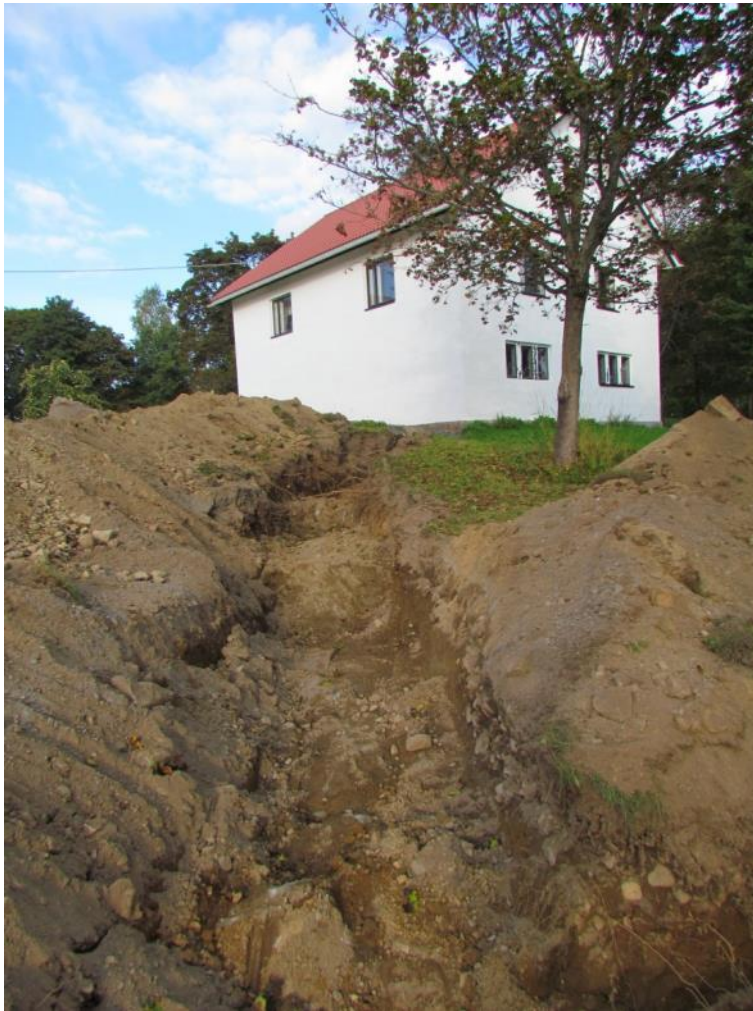
Kuva 8. Pehtoorin talolle johtava kaivanto. Kallio on paikoittain hyvin lähellä maanpintaa. 18.9.2014.