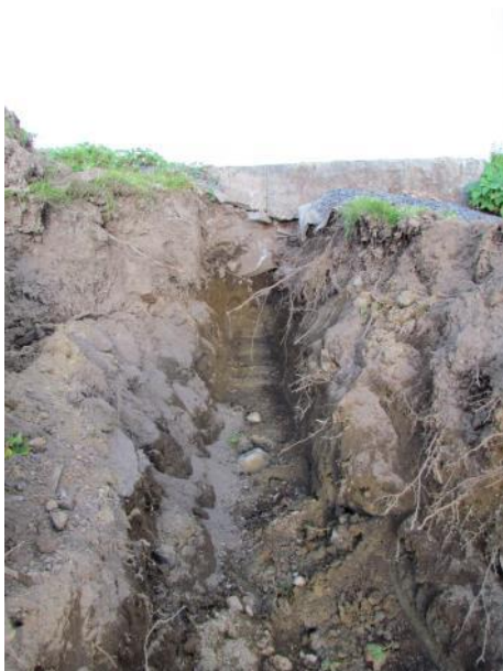
Kuva 3. Pehtoorin talon kiviperustus.

Pehtoorin talon ja Verstaan välisellä alueella peruskallion pinta oli korkealla ja paikoin melko epätasainen. Varsinkin Laukontien ja verstaan ympäristössä pihanurmen alapuoliset kerrostumat olivat sekoittuneet 1900-luvun alkupuolen rakennustöissä. Selkeästi 1900-lukua vanhempia kerrostumia ei tavattu. Pehtoorin talon ympäristöä oli sen rakentamisen aikana laajalti kaivettu ja myös täällä maakerrokset olivat nuorehkoja.