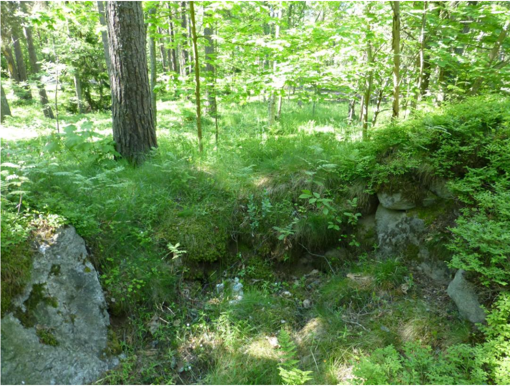
Tuliasema. Kuvattu koillisesta.