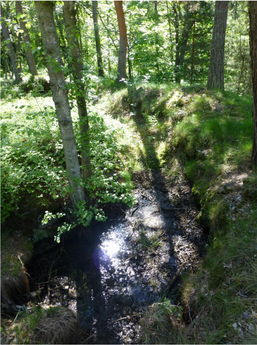
Lounaista taisteluhautaa luoteesta päin kuvattuna