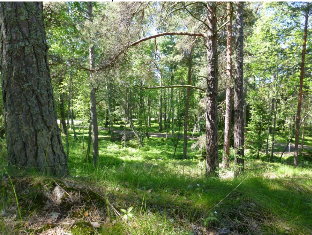
Näkymä torjuntasuuntaan etelälounaaseen.