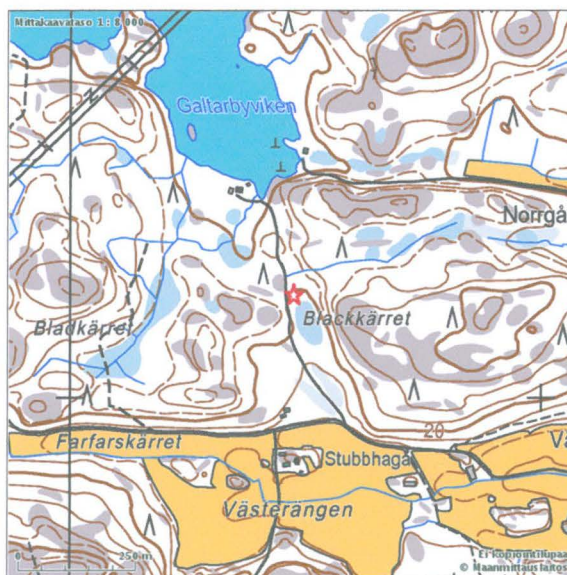
Kimito Galtarby VI. Fyndplatsen utmärkt med en röd stjärna på östra sidan om stugbilvägen som leder från Västerängen till Galtarbyviken.

Den förhistoriska boplatsen Galtarby VI ligger i Galtarby i skogsmiljö på östra sidan en stugbilväg som leder från åkerområdet Västerängen till stranden av Galtarbyviken (Björkboda träsk). Vegetationen består av högvuxen gran och tallskog. Undervegetationen består av ris och mossa. Jordmånen är mycket stenig men här och där finns områden med mjäla och lera. Under senneolitisk stenålder har boplatsen legat på fastlandet i vikbottnet av en djup havsvik.