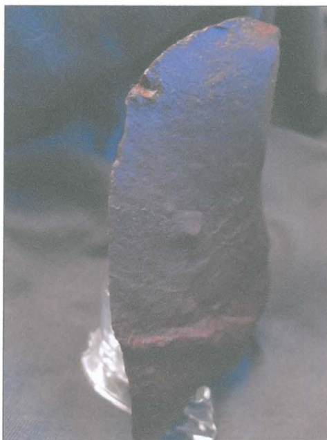
Avslag av rödbrun porfyr med eventuella svaga slitspår på vänstra sidan (NM 40374:10 )

Provgrävningens föremålsfynd består uteslutande av rätt små avslag av kvarts. Avsaknaden av större kvartsavslag och kärnor tycks peka på att man endast reparerat redskap på platsen. Fyndet av det stora porfyraavslaget visar svaga spår av användning på en sida och kan mycket väl ha används som en kniv.