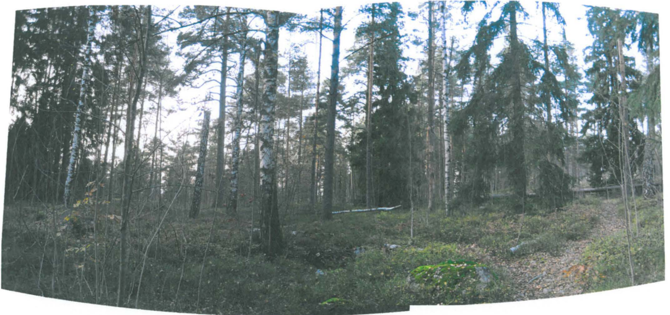
Kuva 1. Yleiskuva Tukikohta XXI Asema 6 lounaispuolelta, missä painanteet sijaitsevat. Asemalle vievä polku näkyy kuvan oikeassa laidassa. Kuva Päivi Maaranen, kuvattu kaakosta.