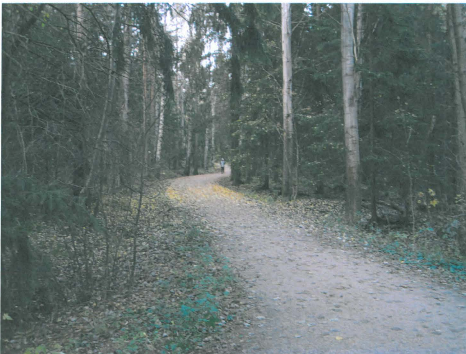
Kuva 2. Tukikohta XXI Aseman 6 ohikulkevaa ulkoilureittiä, joka on paikoin vanhan tykkien päälle rakennettu. Ulkoilureitin reunoilla näkee paikoin tykkien oja ja mukulakiveystä. kuvattu etelästä.