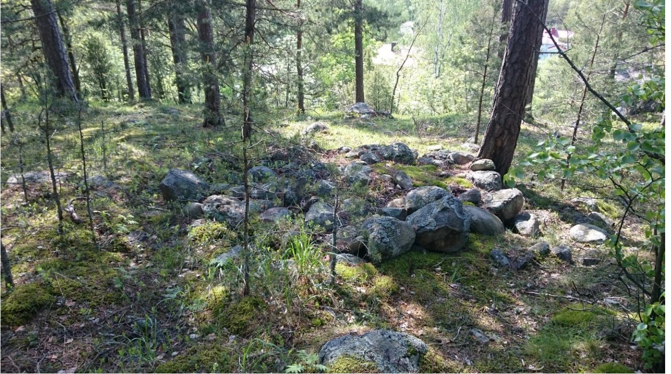
Kuva 1. Rökkiö, kuvattu kohti länttä. Taustalla näkyy rinteessä olevaa omakotitaloasutusta.