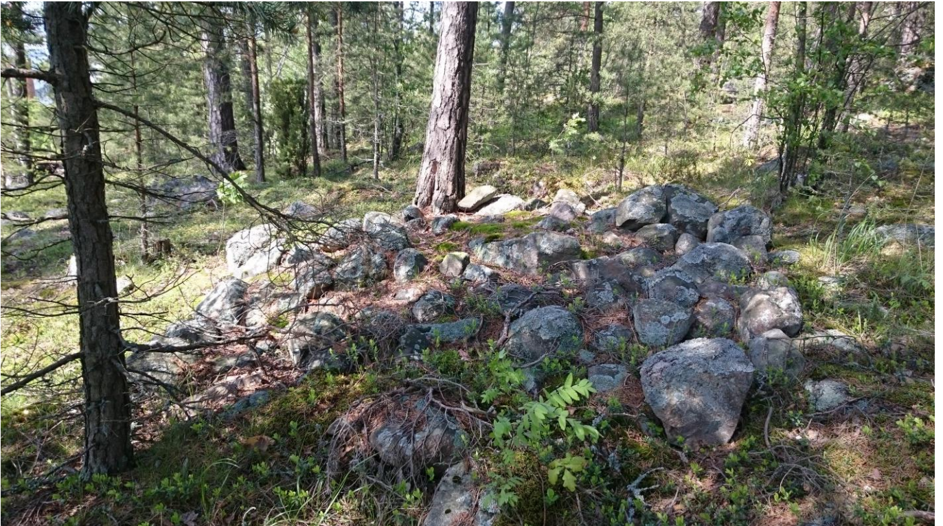
Kuva 2. Rökkiö kuvattu kohti pohjoista.