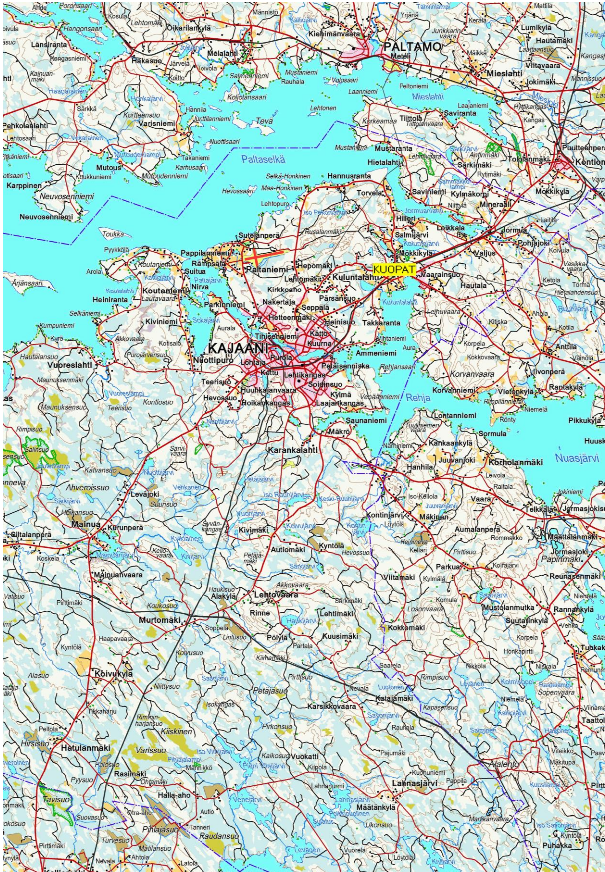
Ote Kansalaisen karttapaikasta 14.3.2013 ladatusta kartasta Uq5l_rvk. 1:250 000.