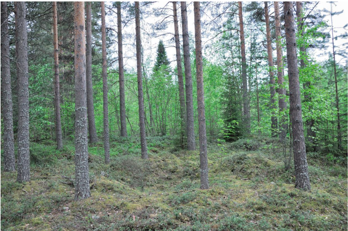
Kuva 2. Kuoppa 2 koillisesta. KaiM 8016:3.