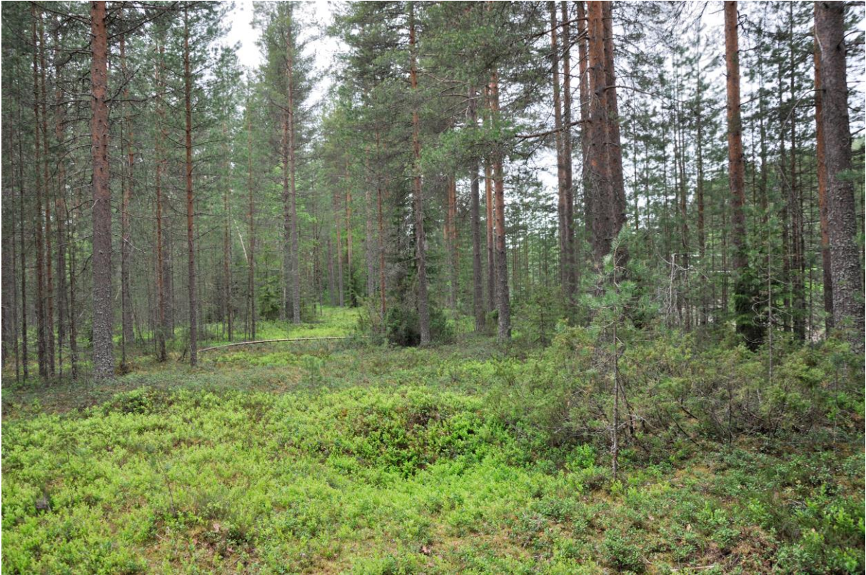
Kuva 5. Kuoppa 5 idästä. KaiM 8016:11.