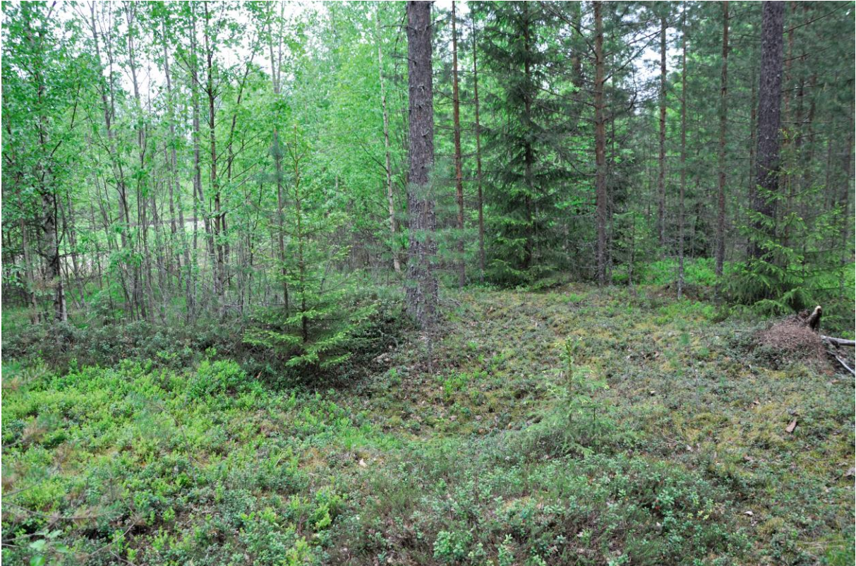
Kuva 1. Kuoppa 1 etelästä. KaiM 8016:1.