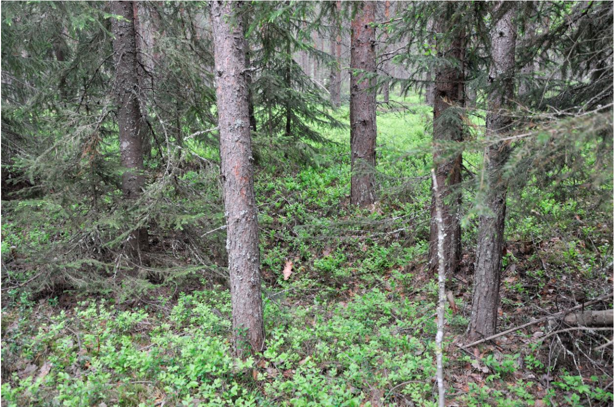
Kuva 3. Kuoppa 3 koillisesta. KaiM 8016:7.