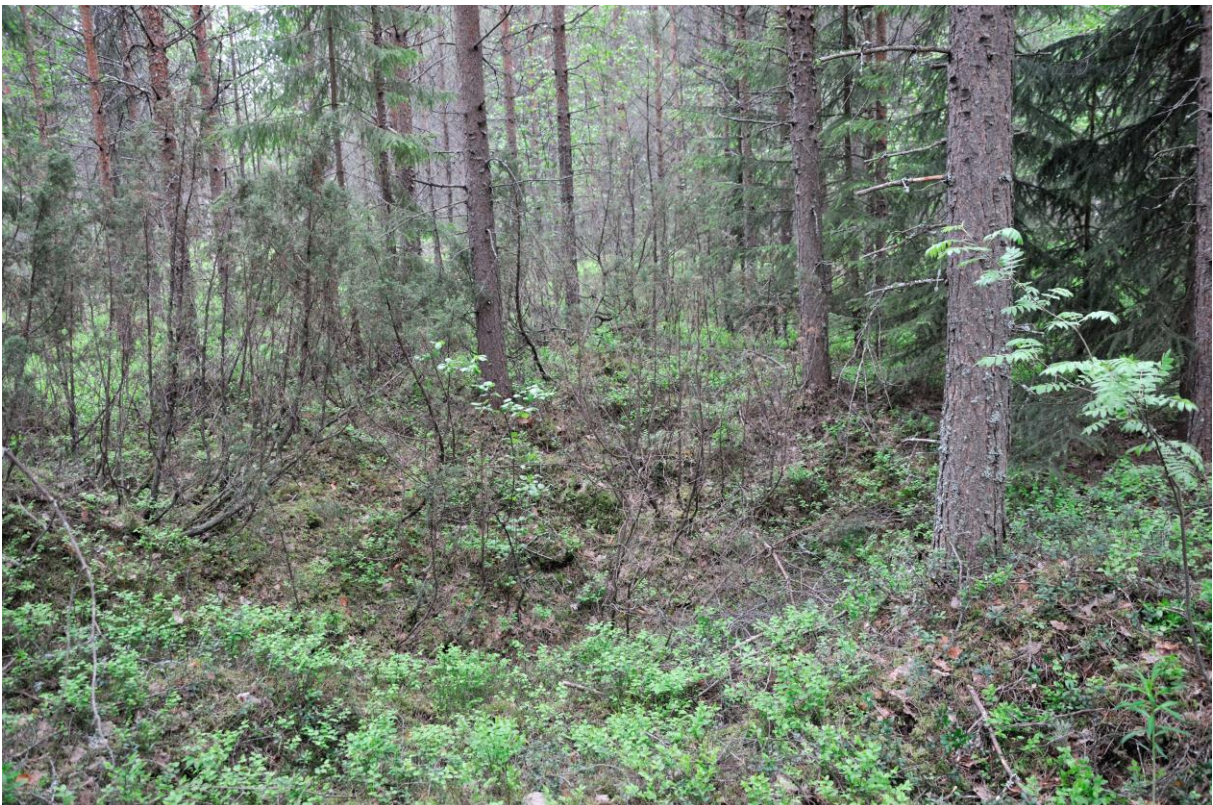
Kuva 4. Kuoppa 4. KaiM 8016:9.