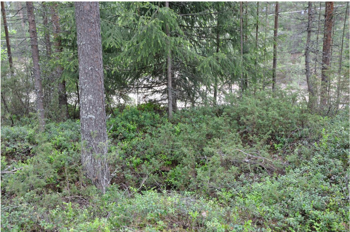
Kuva 6. Kuoppa 6 kaakosta. KaiM 8016:12.