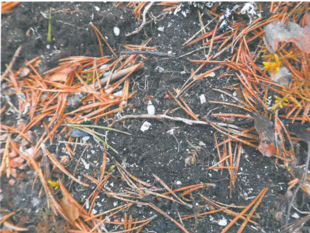
Kuva 4. Löytöpaikalla havaittua palanutta luuta.