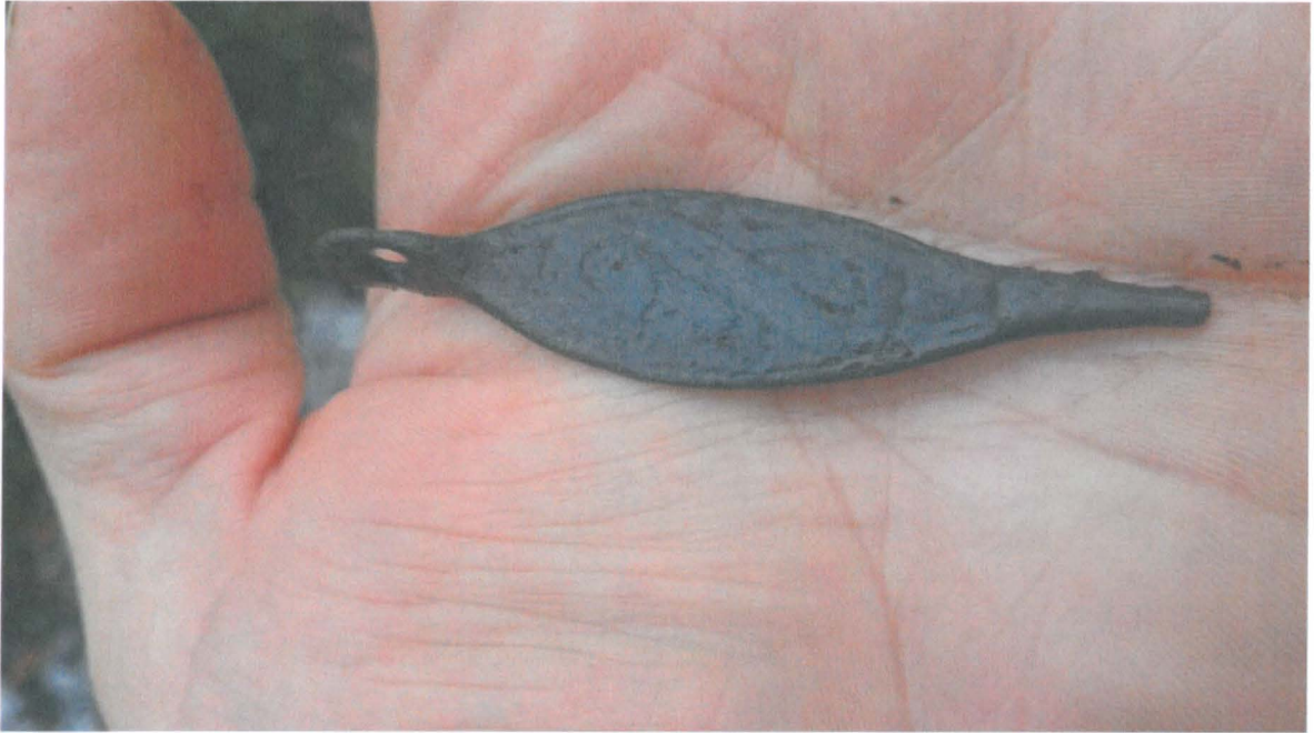
Kuva 1. Märännönkankaalta löydetty pronssinen korvalusikka.