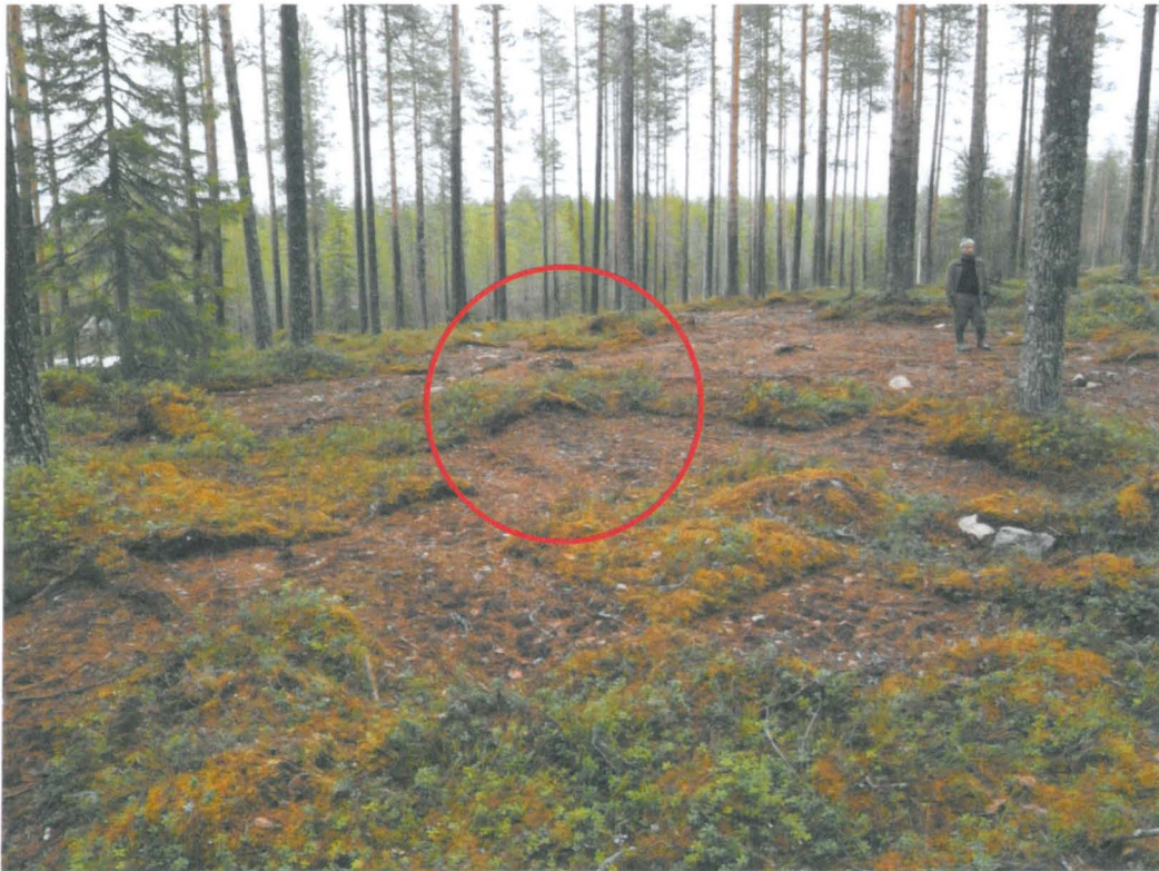
Kuva 3. Löytöpaikka kuvattuna lounaasta.