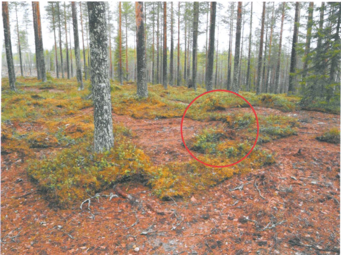
Kuva 2. Korvalusikan löytöpaikka kuvattuna eteläkaakosta.