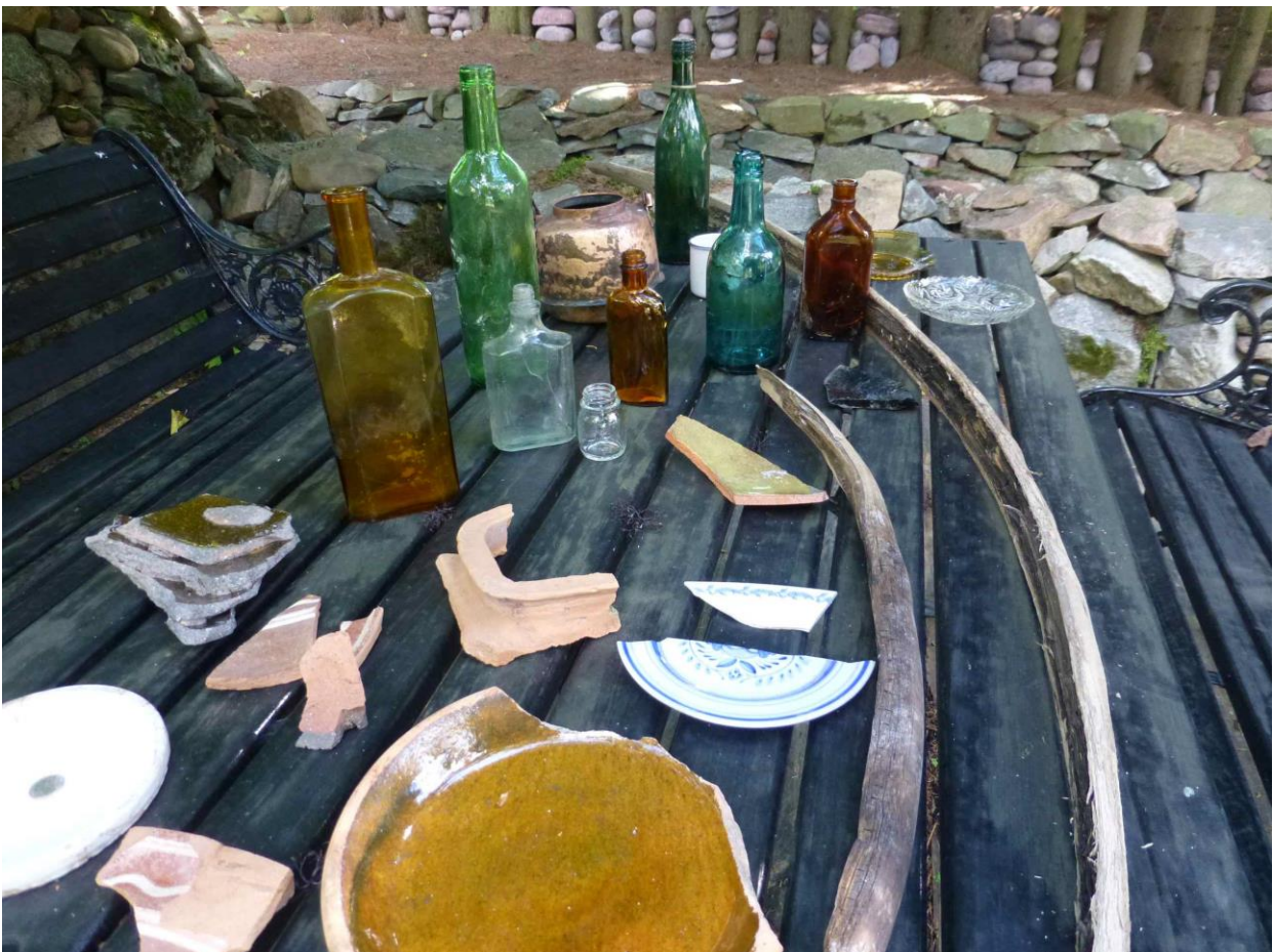
Kuninkaanlähteestä tyhjennyksen yhteydessä löytyneitä esineitä.