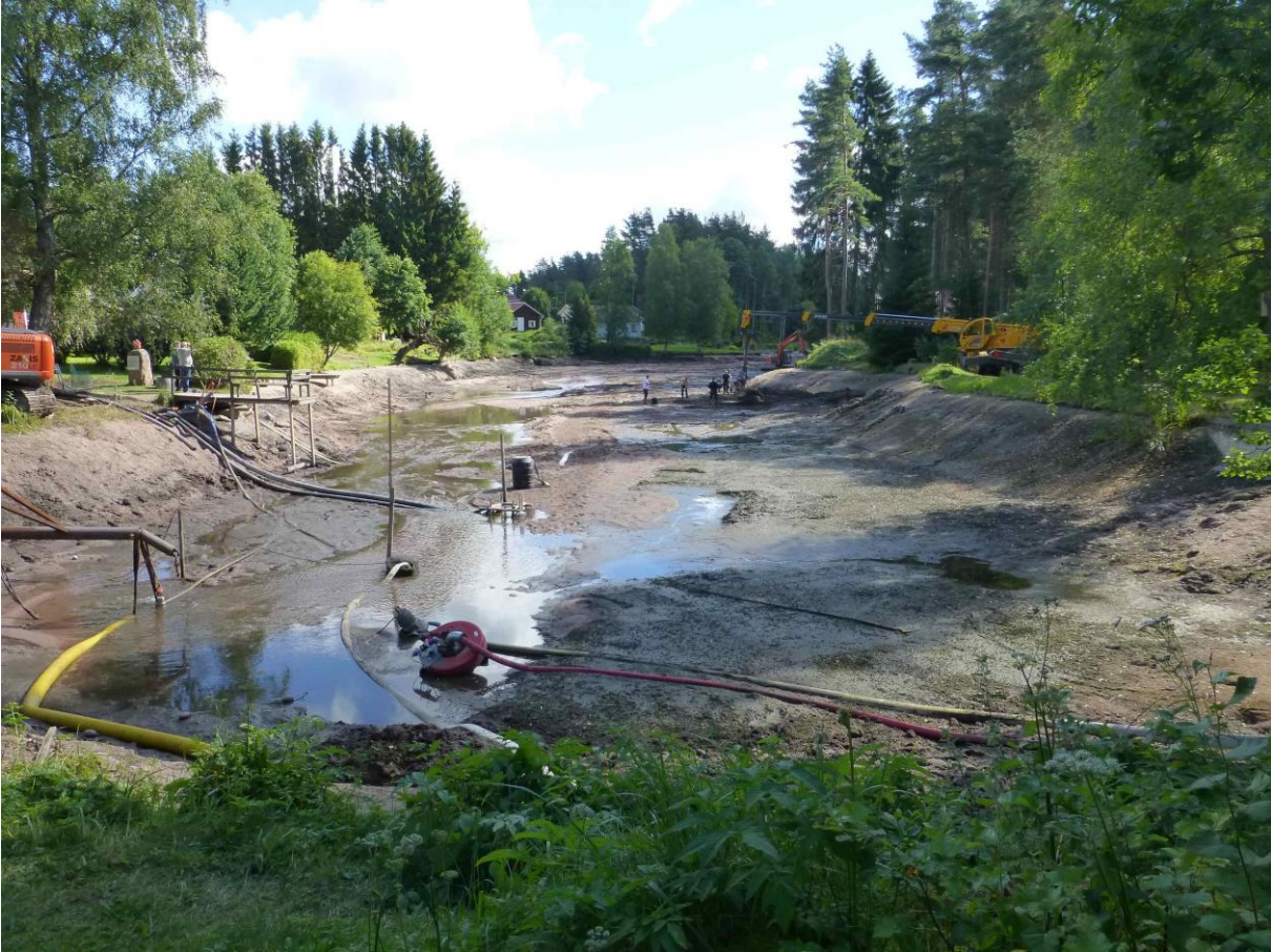
Kuninkaanlähde tyhjennettynä. Kuvattu lännestä.