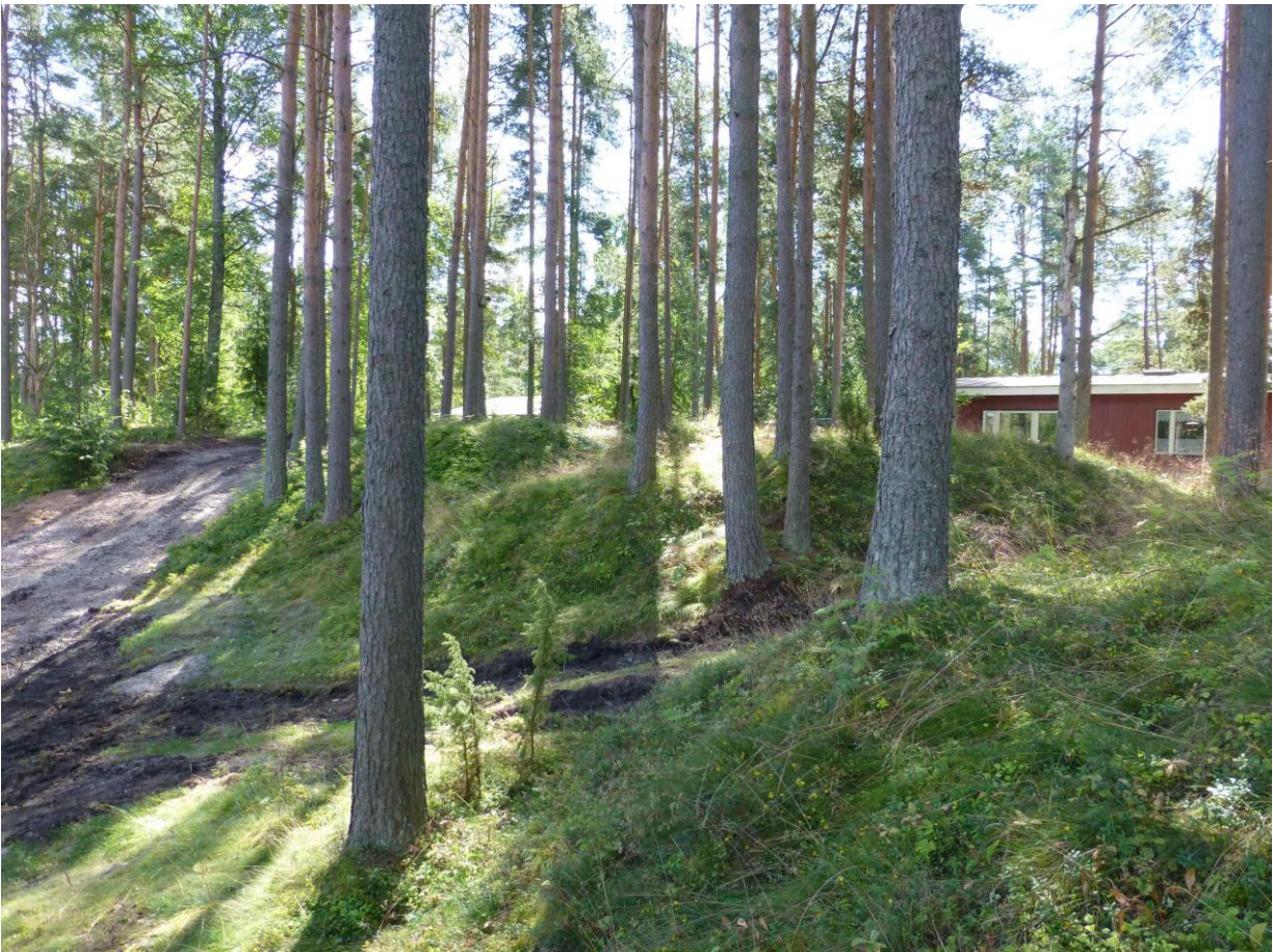
Itäisempi tervahauta Kuninkaanlähden etelärannalla.