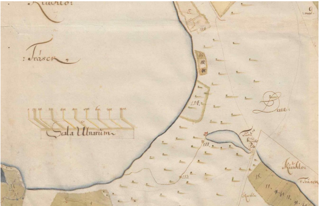
Kartta vuodelta 1707, jossa merkittynä tervanpolttopaikka. Kankaanpää, Tiluskartta ja selitys 1707-1707 (A48:3/1-2)