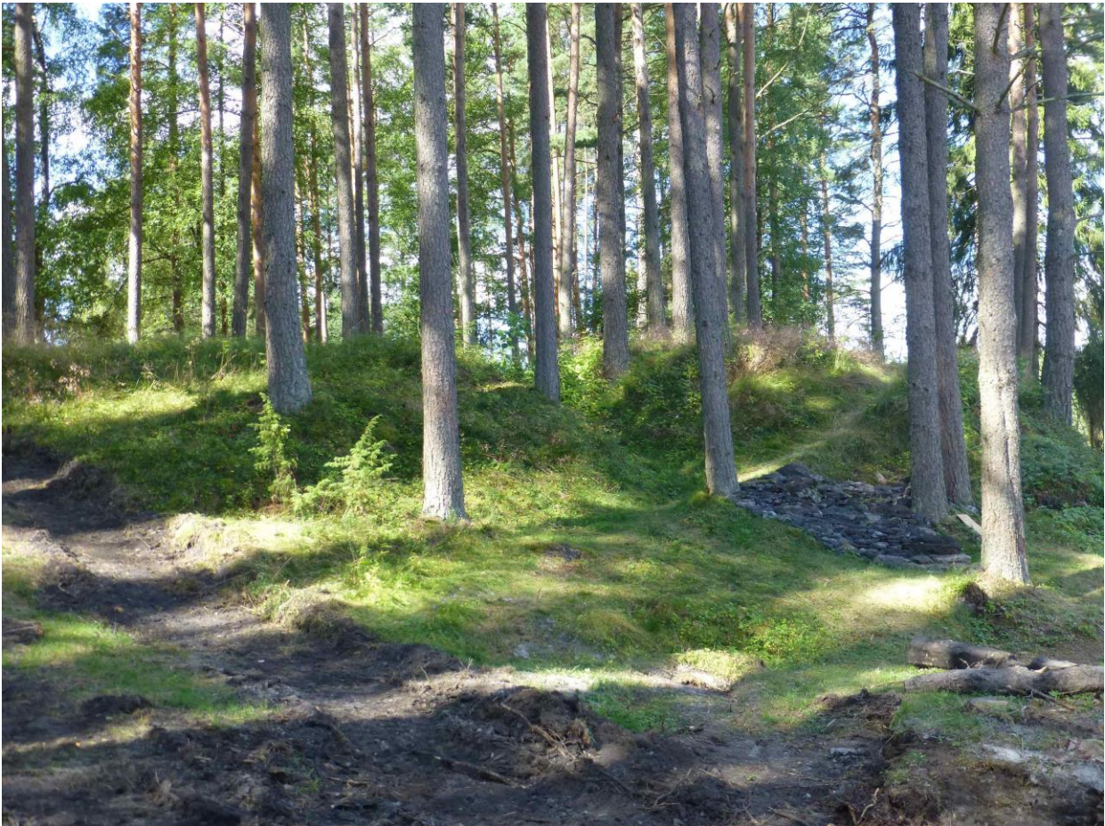
Läntinen tervahauta. Rinteessä siihen kasattuja "tervakiviä".