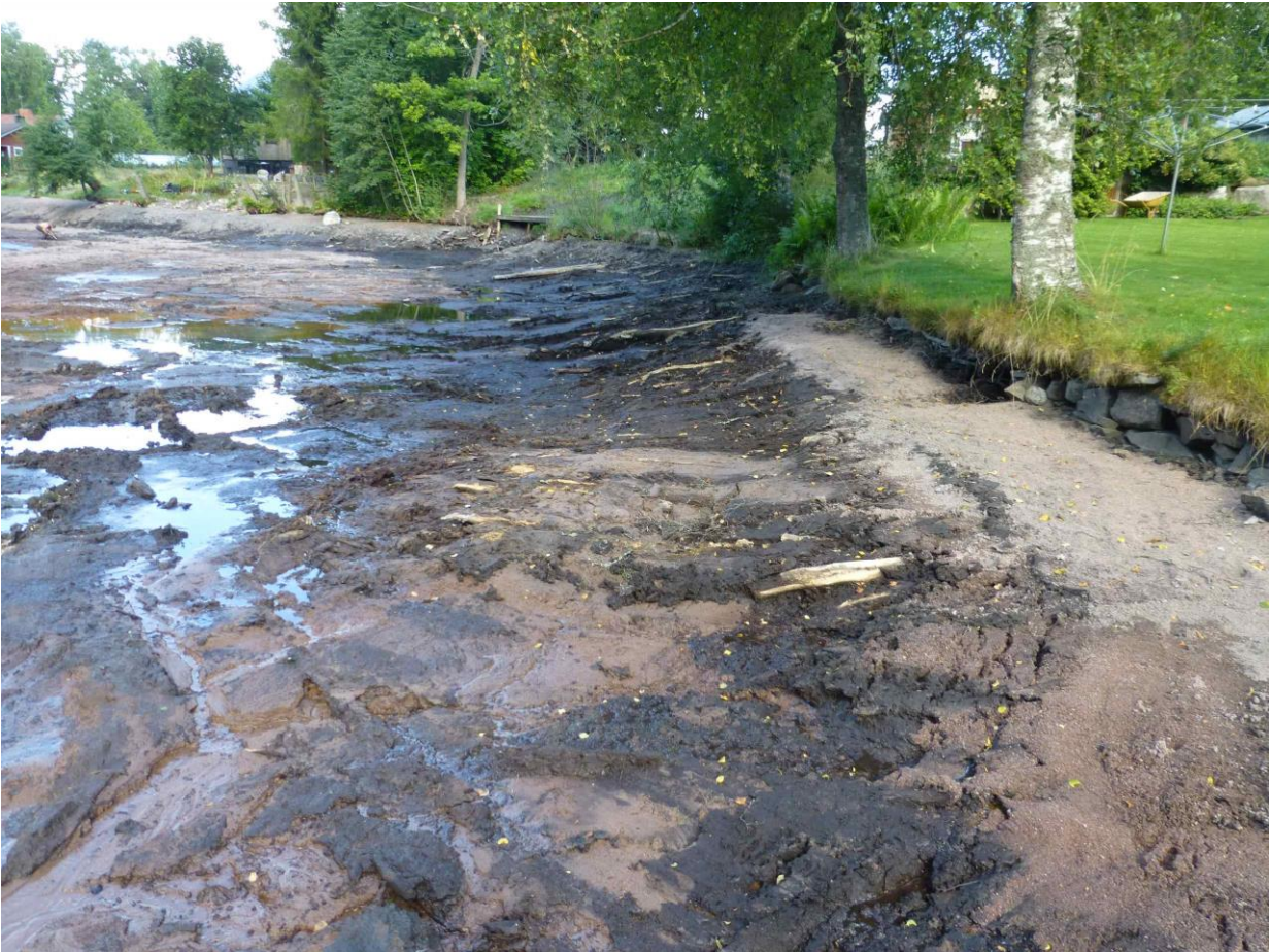
Veden alta paljastuneita terva-aittojen jäännöksiä lähteen pohjoisreunalla.