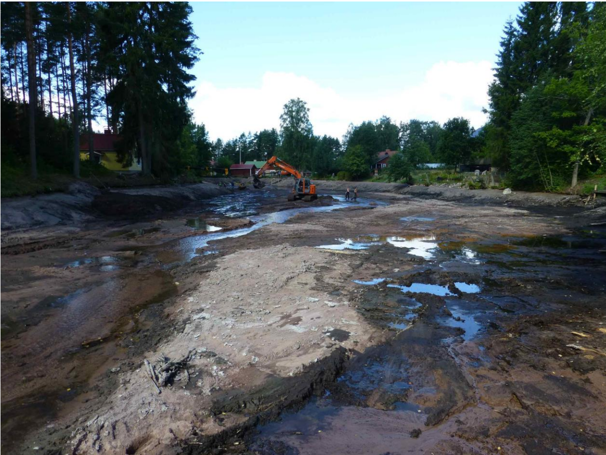
Kuvattu idästä kohti Kyliönjärveä