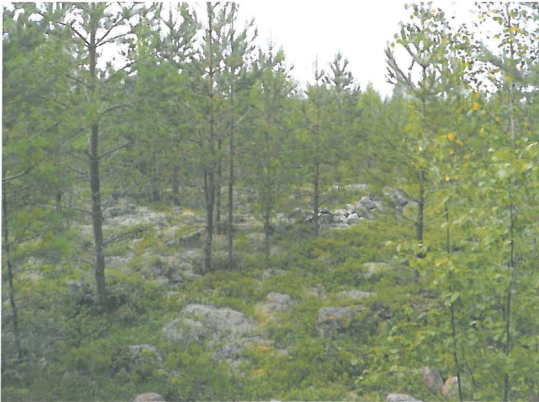
Seljänharju SW, kehävalli pohjoisesta

aukkoja. Rakennelma on pyöreä ja läpimitaltaan n. 5x5m. Kehävallin keskellä on laakea n. 60cm läpimittainen kivi kyljellään. Kehävallista n. 20m pohjoiseen on mahdollinen röykkiö, jonka yli aurattu.