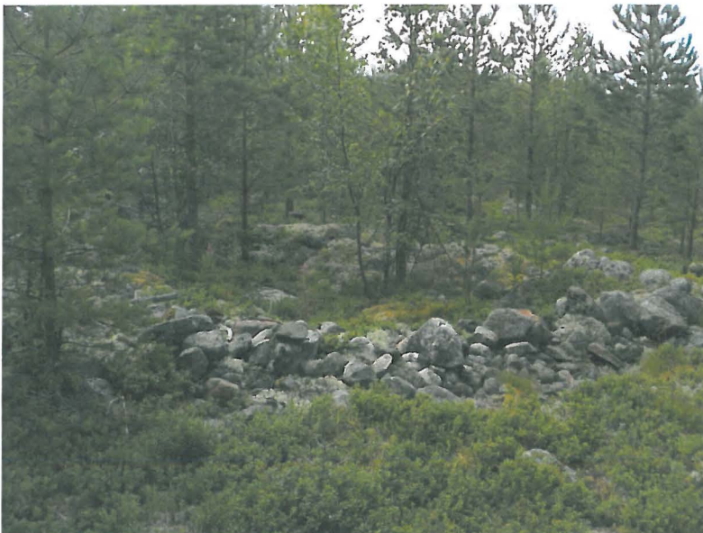
Seljänharju S, kehävalli lännestä