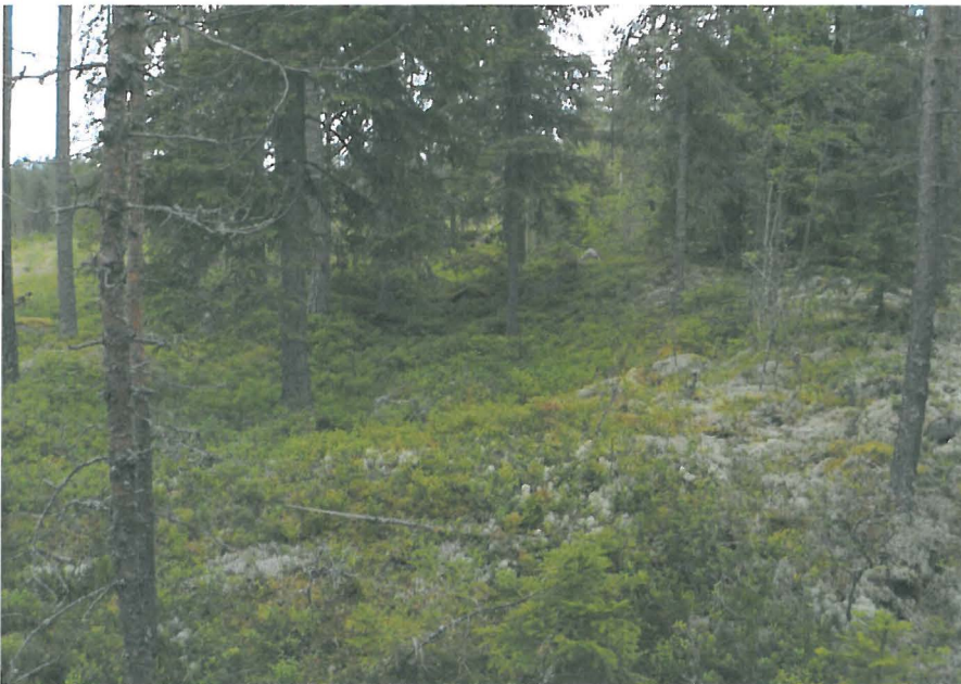
Seljänharju asumuspainanne 1 koillisesta