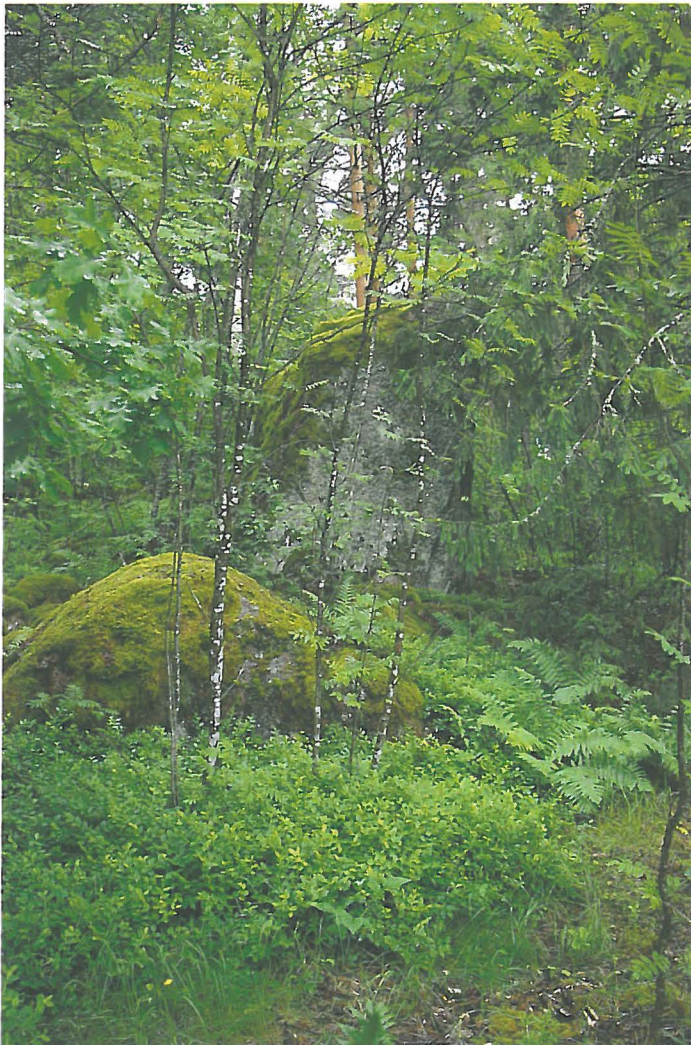
Kuva 1: Siirtolohkare suunnasta N.

Keskipisteen koordinaatit: N 6725605, E 486202 (ETRS-TM35FIN -tasokoordinaatit)