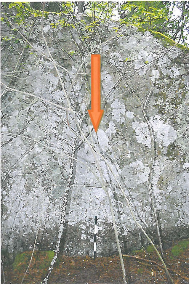
Kuva 3: Hakkaus siirtolohkareen W-sivustalla. W.