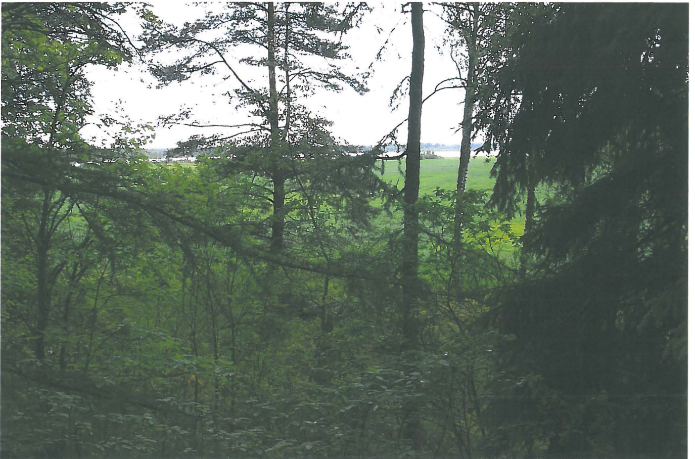
Kuva 5: Näkymä siirtolohkareen päältä Muhjärven suuntaan. E.