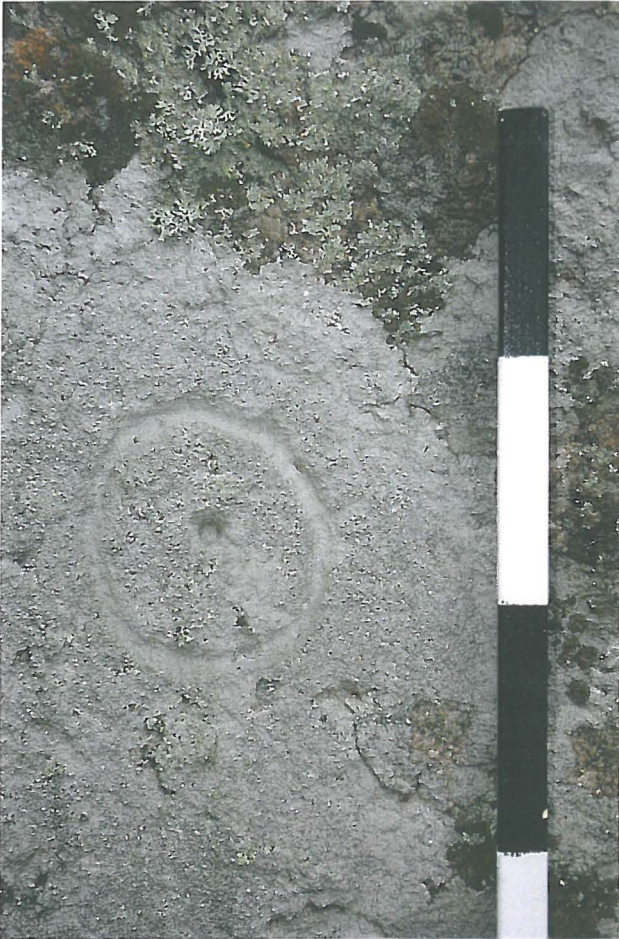
Kuva 4: Lähikuva hakkauksesta. W.