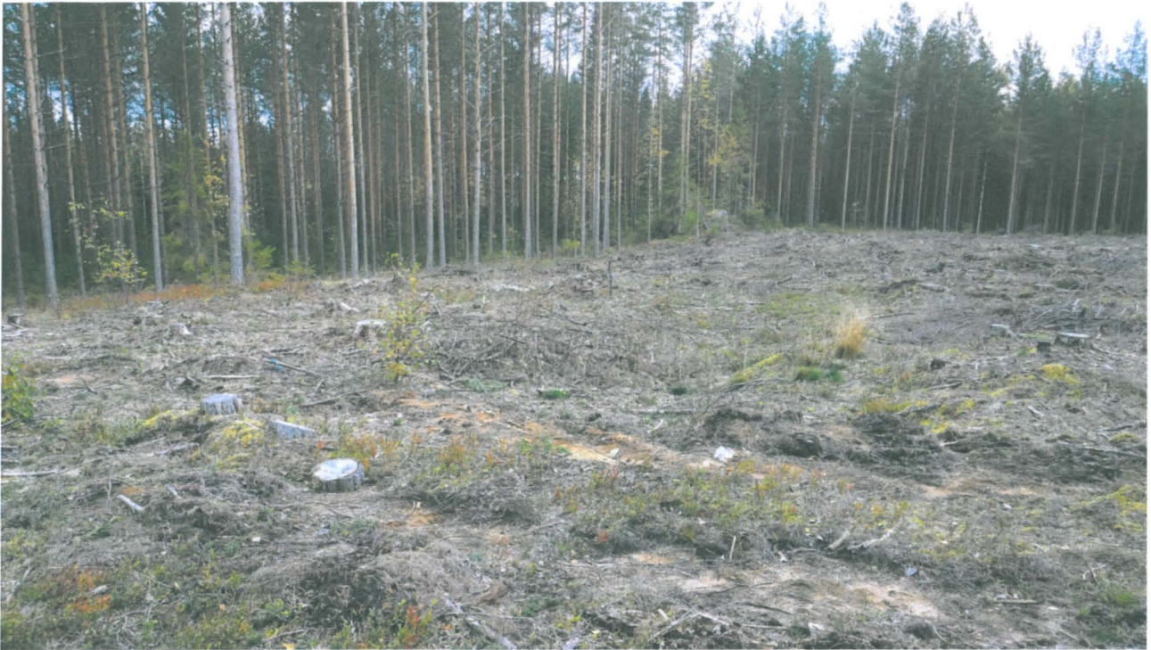
AKDG 4376:1. Kumpuniemensuon ylimmän asuinpaikan toiseksi läntisin painanne, jonka sisäosa on säästynyt merkitsemisen ansiosta äestykseltä. Äestetyiltä valleilta löytyi runsaasti keramiikkaa.