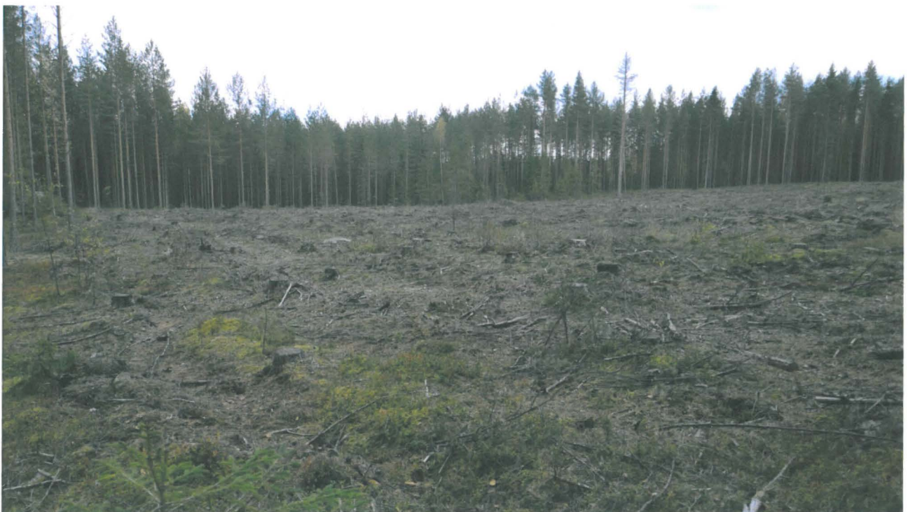
AKDG 4376:2. Äestettyä Kumpuniemensuon kivikautista asuinpaikkaa, kaakkoon.