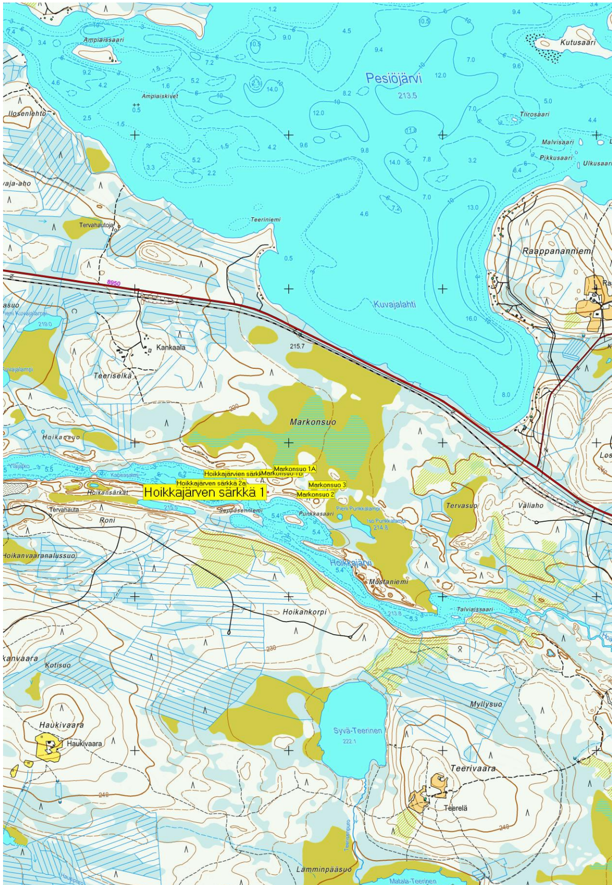
Kartta 2. Kopio Maanmittauslaitoksen avoimien aineistojen tiedostopalvelusta 10.9.2014 ladatusta kartasta R5233L_RVK_1. 1:25 000.