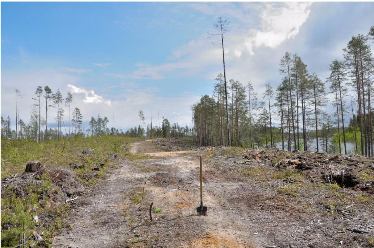
Kuva 2 Löytökohta kepeillä merkityllä alueella lapion vasemmalla puolella. Kuvattu luoteesta. KaiM 8028: 18.