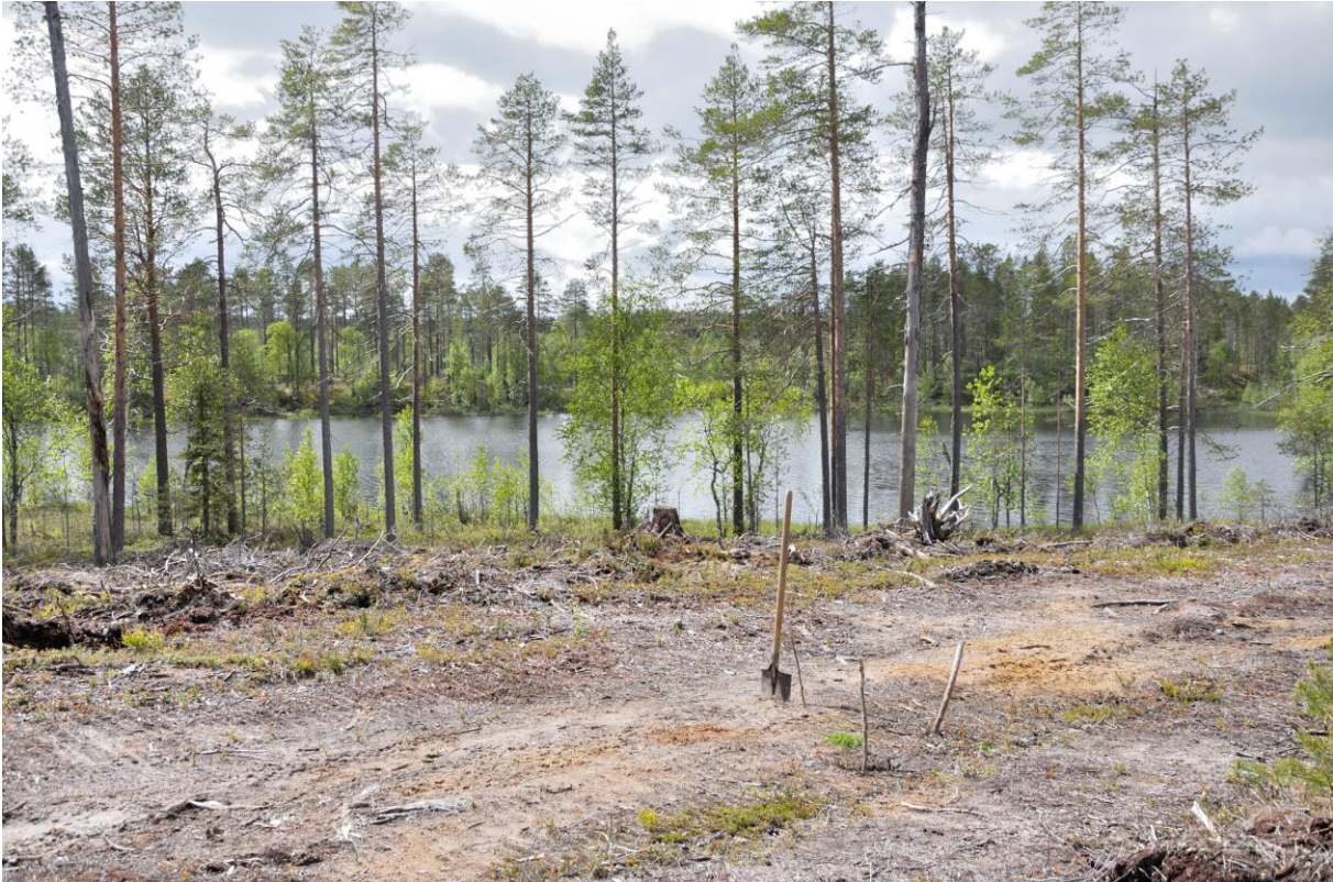
Kuva 1 Löytökohta kepeillä merkityllä alueella lapion oikealla puolella. Kuvattu koillisesta. KaiM 8028: 15.