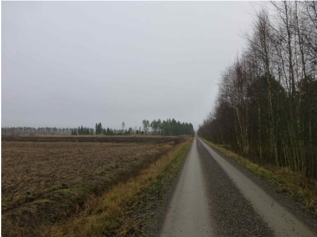
Kakkurisuon maisemaa kuvattuna aluetta halkovalta tieltä