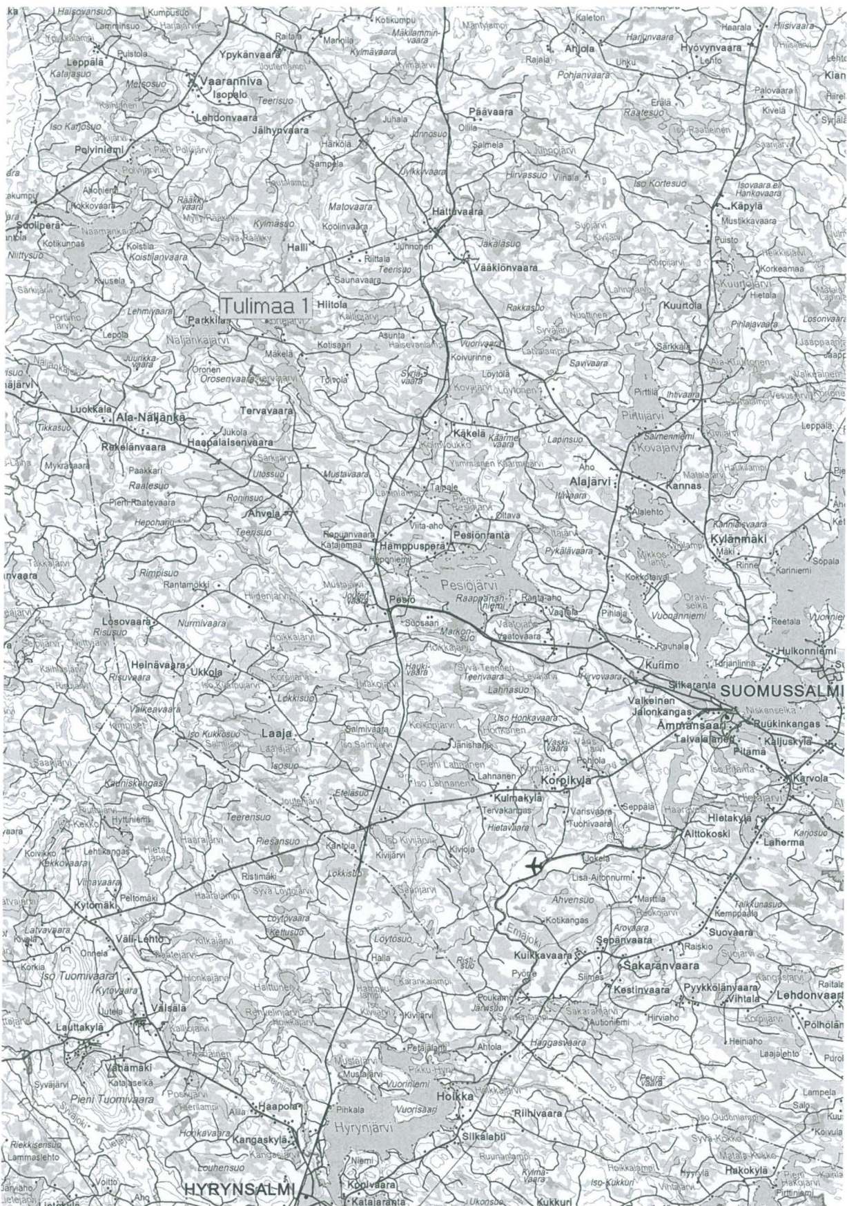
Kartta 1. Kopio Maanmittauslaitoksen avoimien aineistojen tiedostopalvelusta 27.8.2014 ladatusta kartasta UR5L_RVK. 1:250 000.