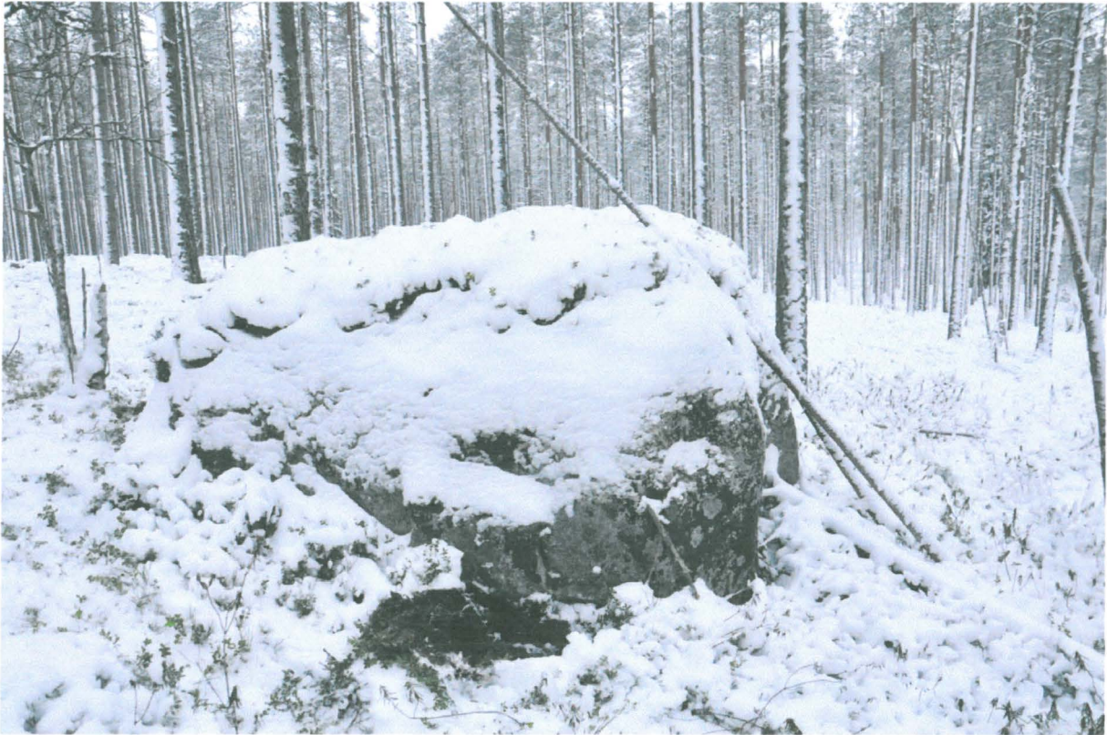
Kuva 3. Kolikon 2 löytöpaikka näkyy mustana läikkänä kiven vieressä kuvan keskivaiheilla. Kuvattu idästä. KaiM 8088:2.