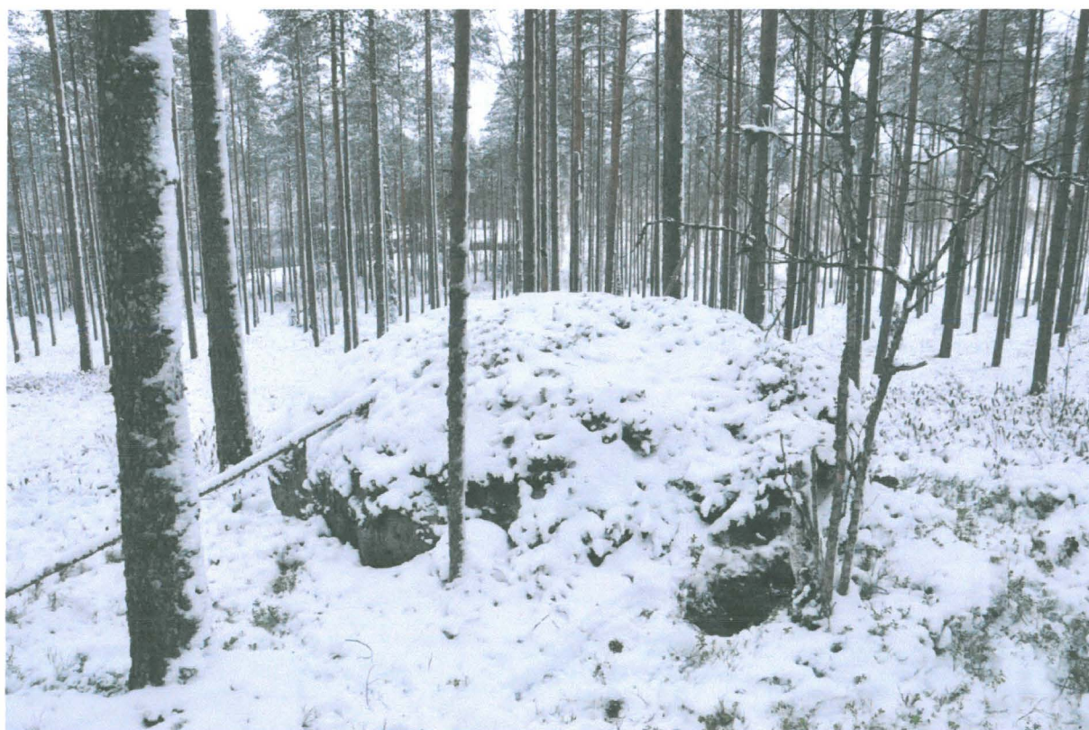
Kuva 2. Kolikon 1 löytökohta näkyy mustana läikkänä kuvan oikean puolen alaosassa. Kuvattu etelästä. KaiM 8088:3