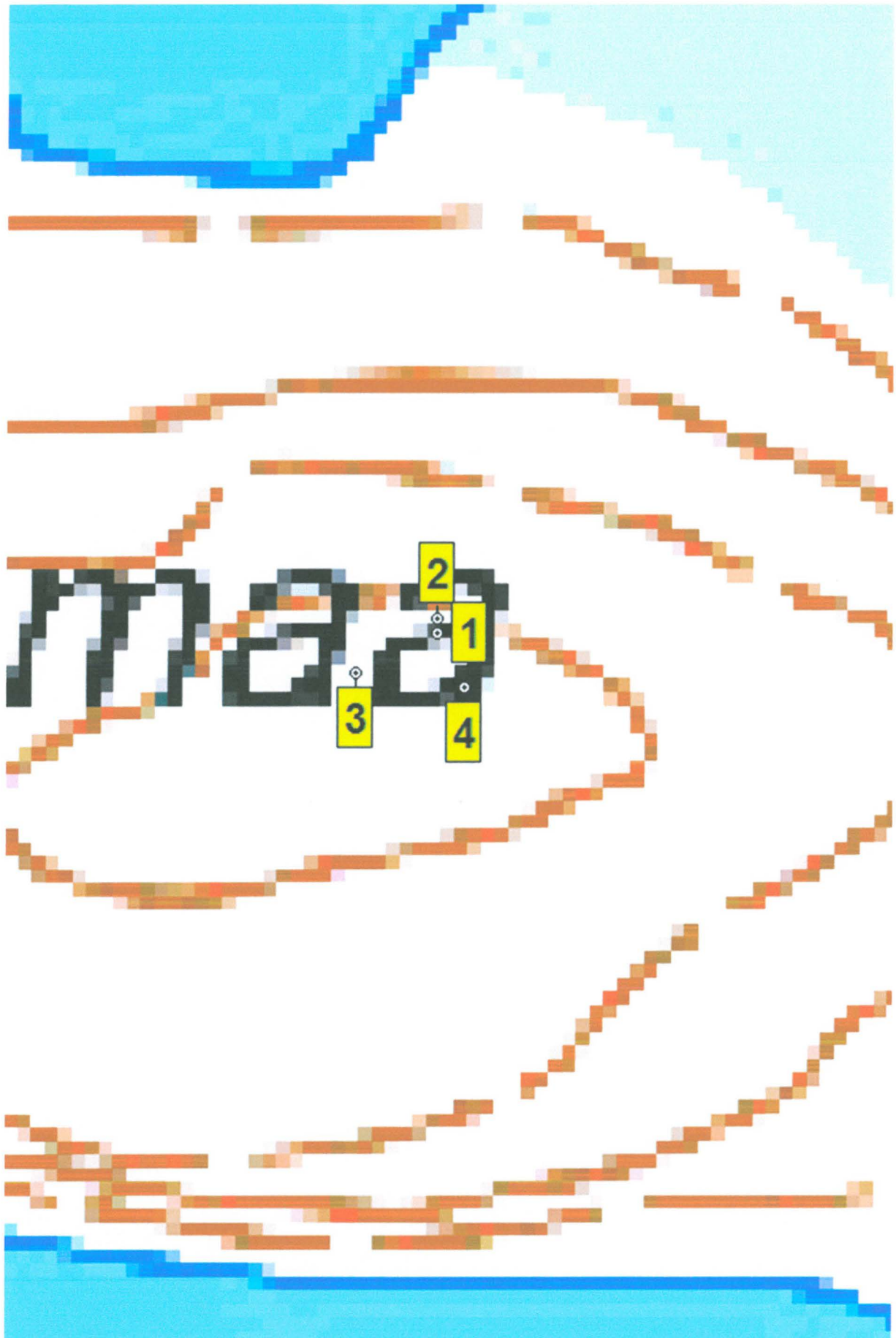
Kartta 3. Suurennos Maanmittauslaitoksen avoimien aineistojen tiedostopalvelusta 24.11.2015 ladatusta kartasta R5232R. 1:1000.