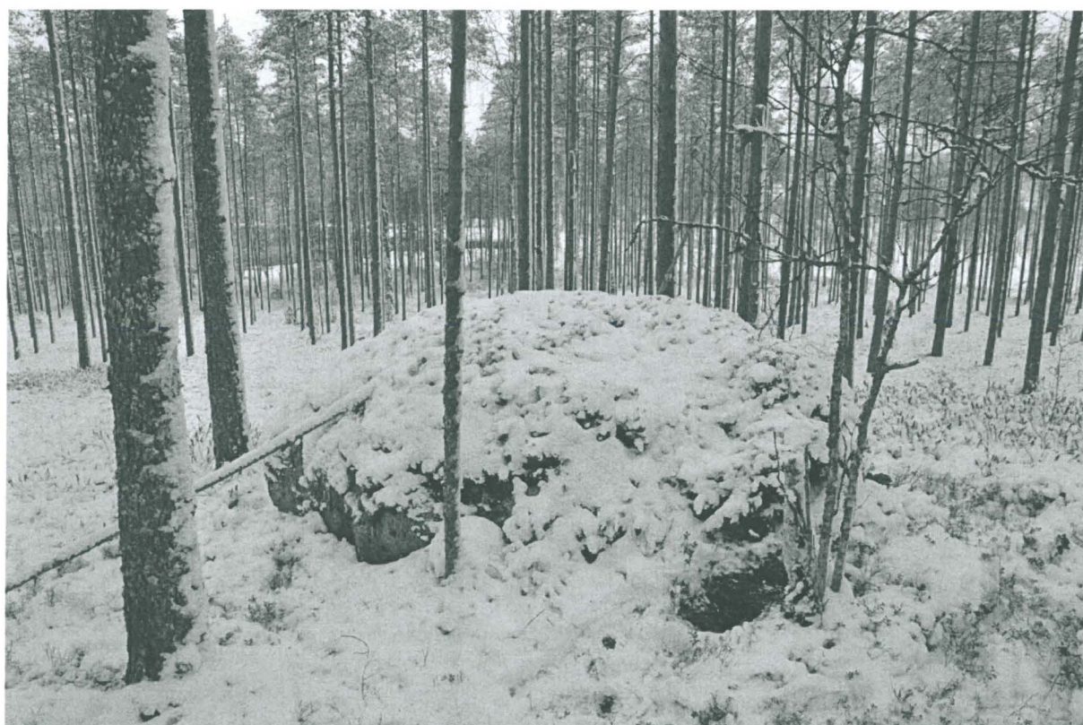
Kuva 2. Kolikon 1 löytökohta näkyy mustana läikkänä kuvan oikean puolen alaosassa. Kuvattu etelästä. KaiM 8088:3