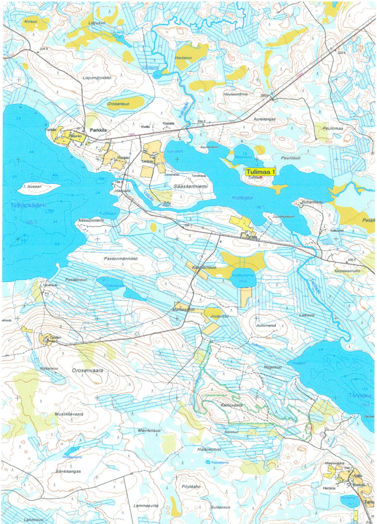
Kartta 2. Kopio Maanmittauslaitoksen avoimien aineistojen tiedostopalvelusta 24.11.2015 ladatusta kartasta R5232R. 1:25 000.