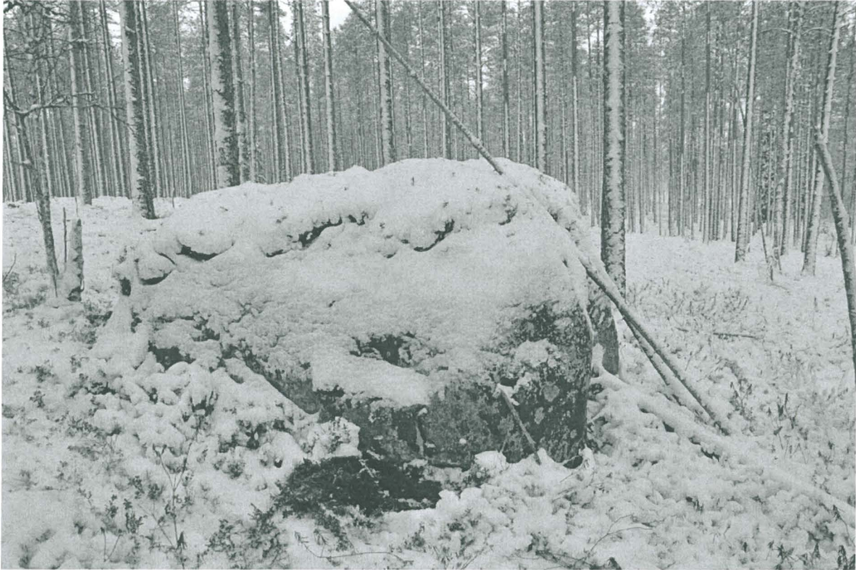
Kuva 3. Kolikon 2 löytöpaikka näkyy mustana läikkänä kiven vieressä kuvan keskivaiheilla. Kuvattu idästä. KaiM 8088:2.