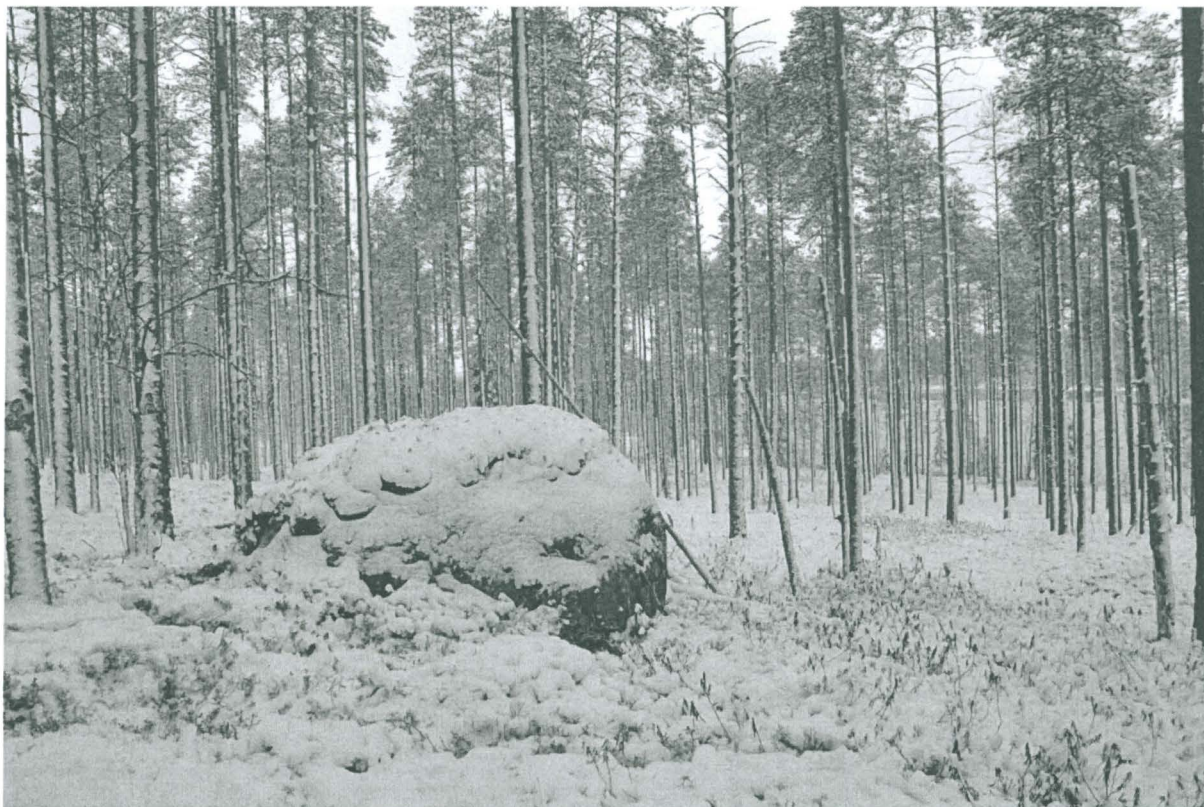
Kuva 1. Kivi, jonka vierestä kolikot löytyivät, taustalla Matinlampi. Kuvattu kaakosta. KaiM 8088:1