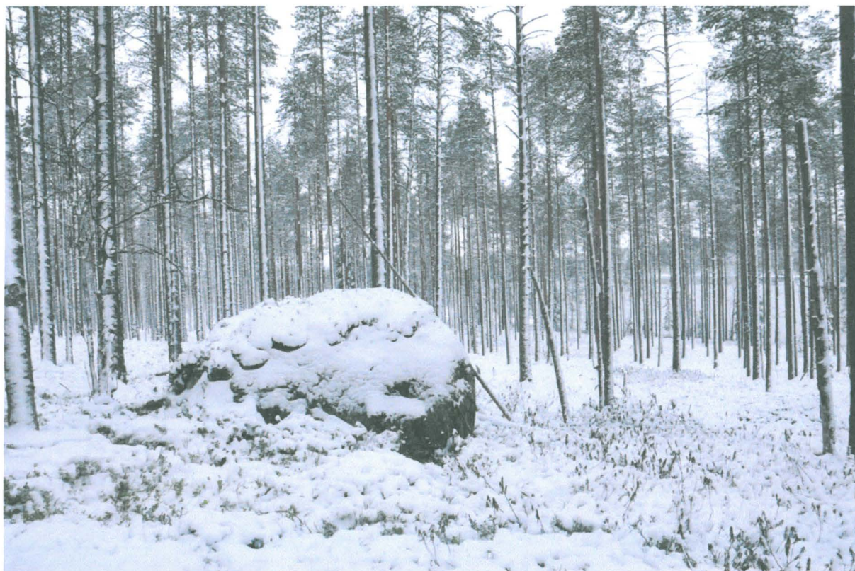
Kuva 1. Kivi, jonka vierestä kolikot löytyivät, taustalla Matinlampi. Kuvattu kaakosta. KaiM 8088:1