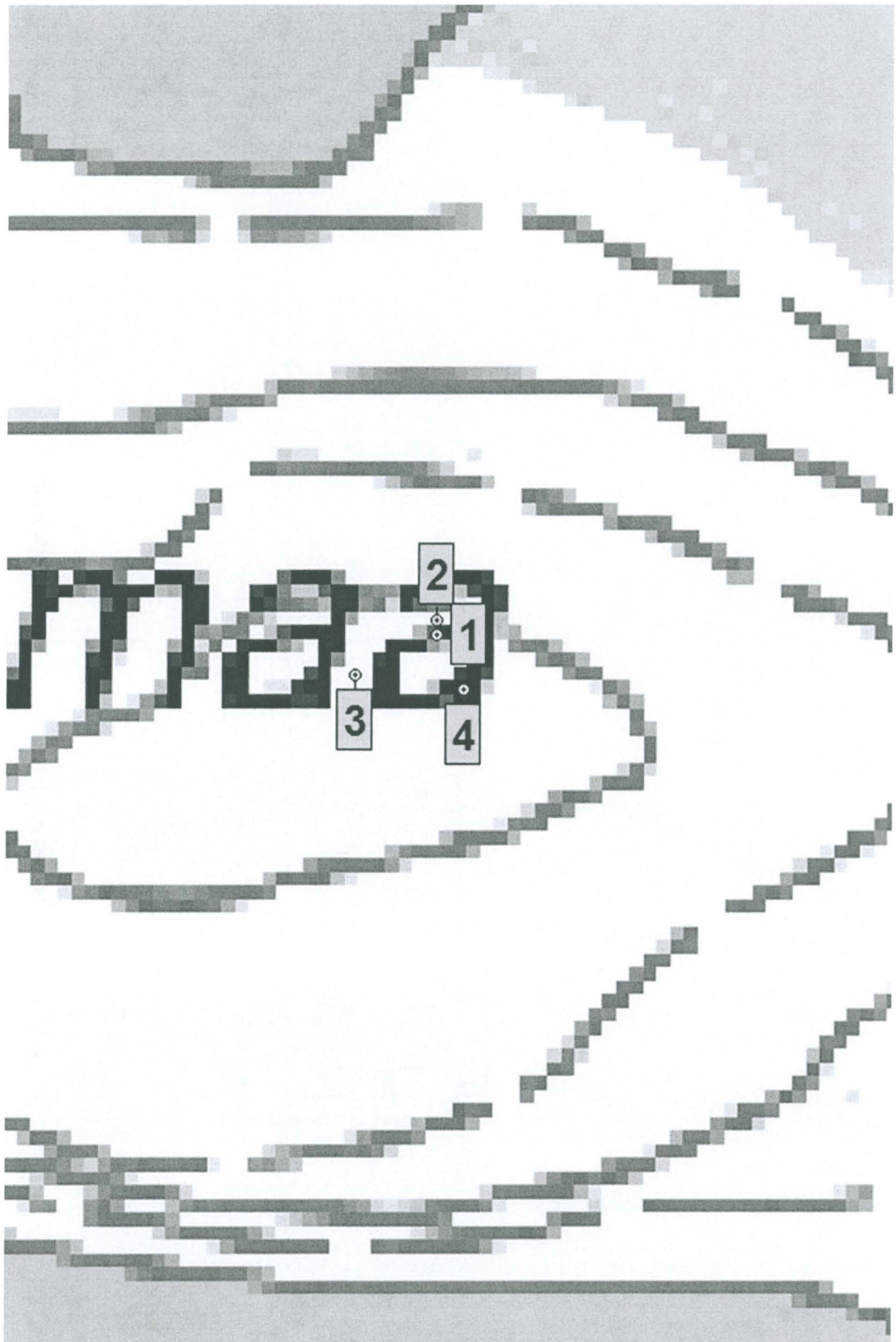
Kartta 3. Suurenos Maanmittauslaitoksen avoimien aineistojen tiedostopalvelusta 24.11.2015 ladatusta kartasta R5232R. 1:1000.