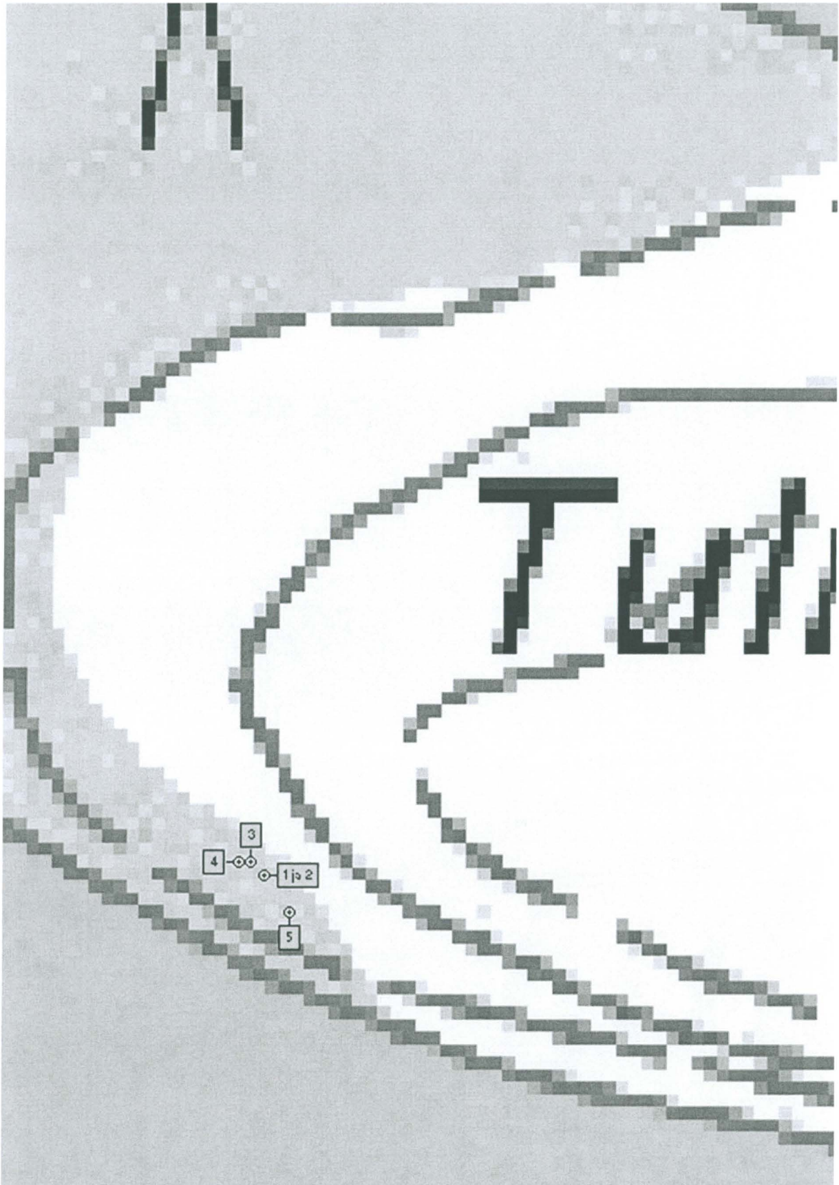
Kartta 3. Suurenos Maanmittauslaitoksen avoimien aineistojen tiedostopalvelusta 24.11.2015 ladatusta kartasta R5232R. 1:1000.