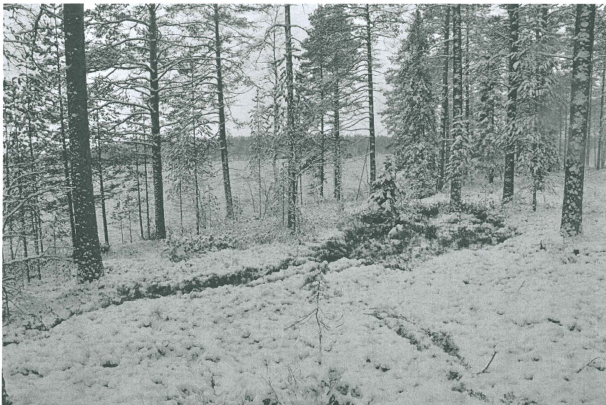
Kuva 1. Löytöalue koillisesta. KaiM 8090.