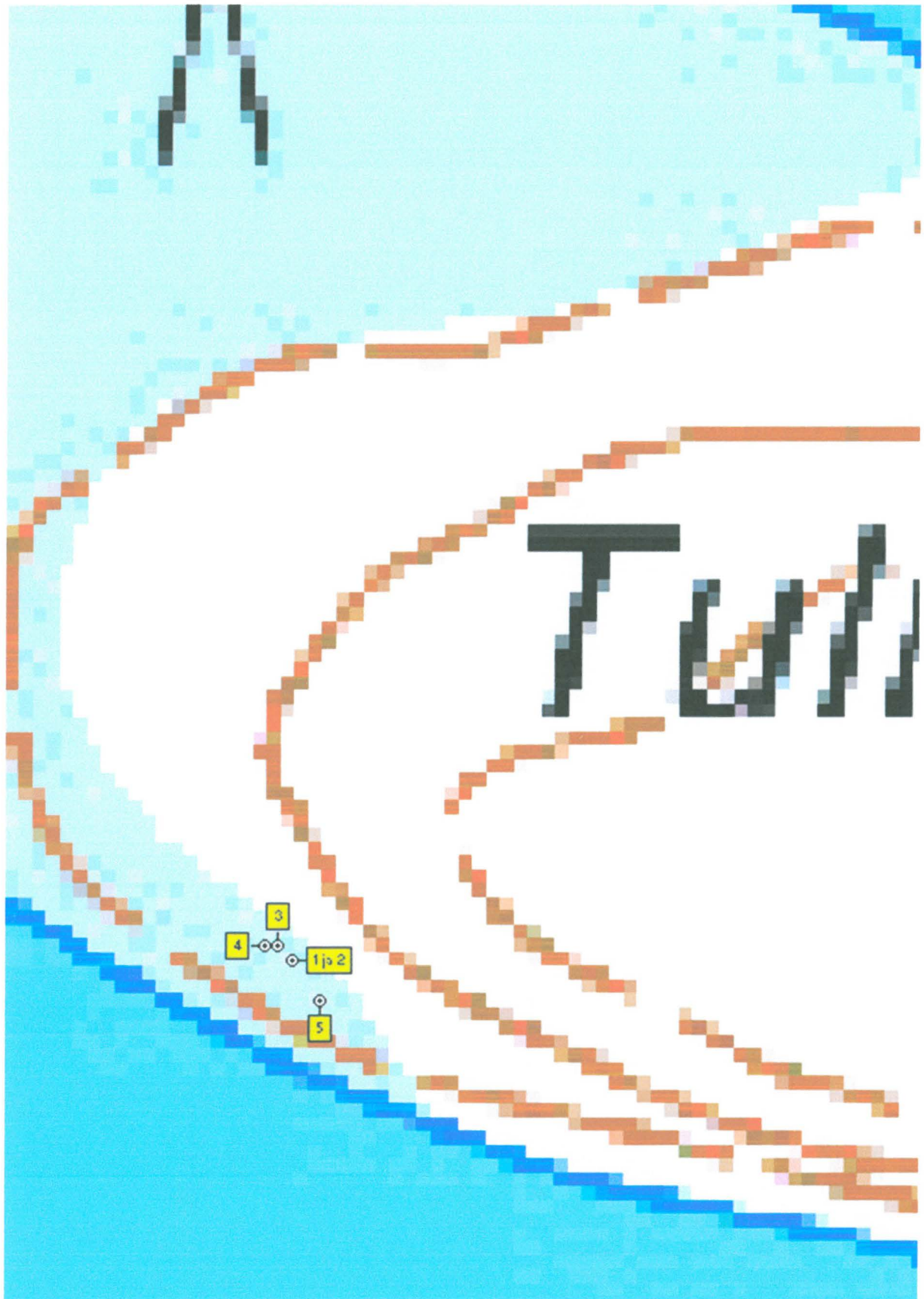
Kartta 3. Suurennon Maanmittauslaitoksen avoimien aineistojen tiedostopalvelusta 24.11.2015 ladatusta kartasta R5232R. 1:1000.