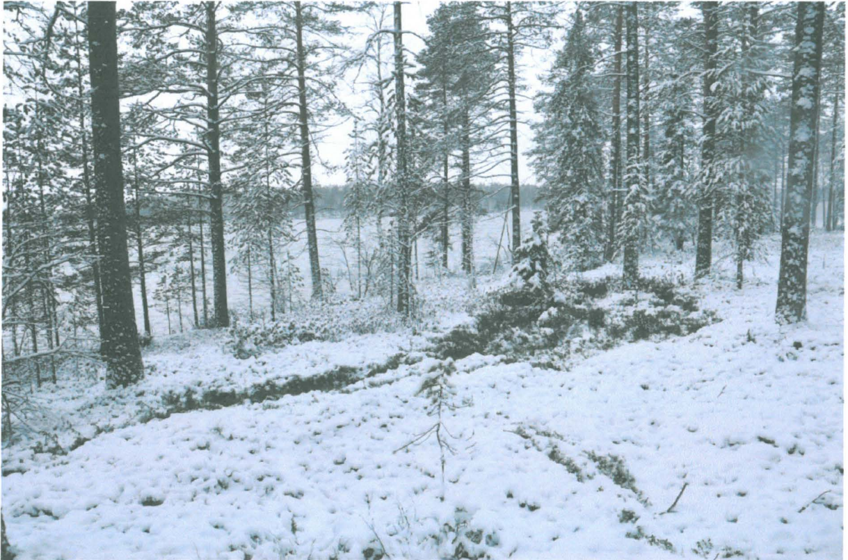
Kuva 1. Löytöalue koillisesta. KaiM 8090.