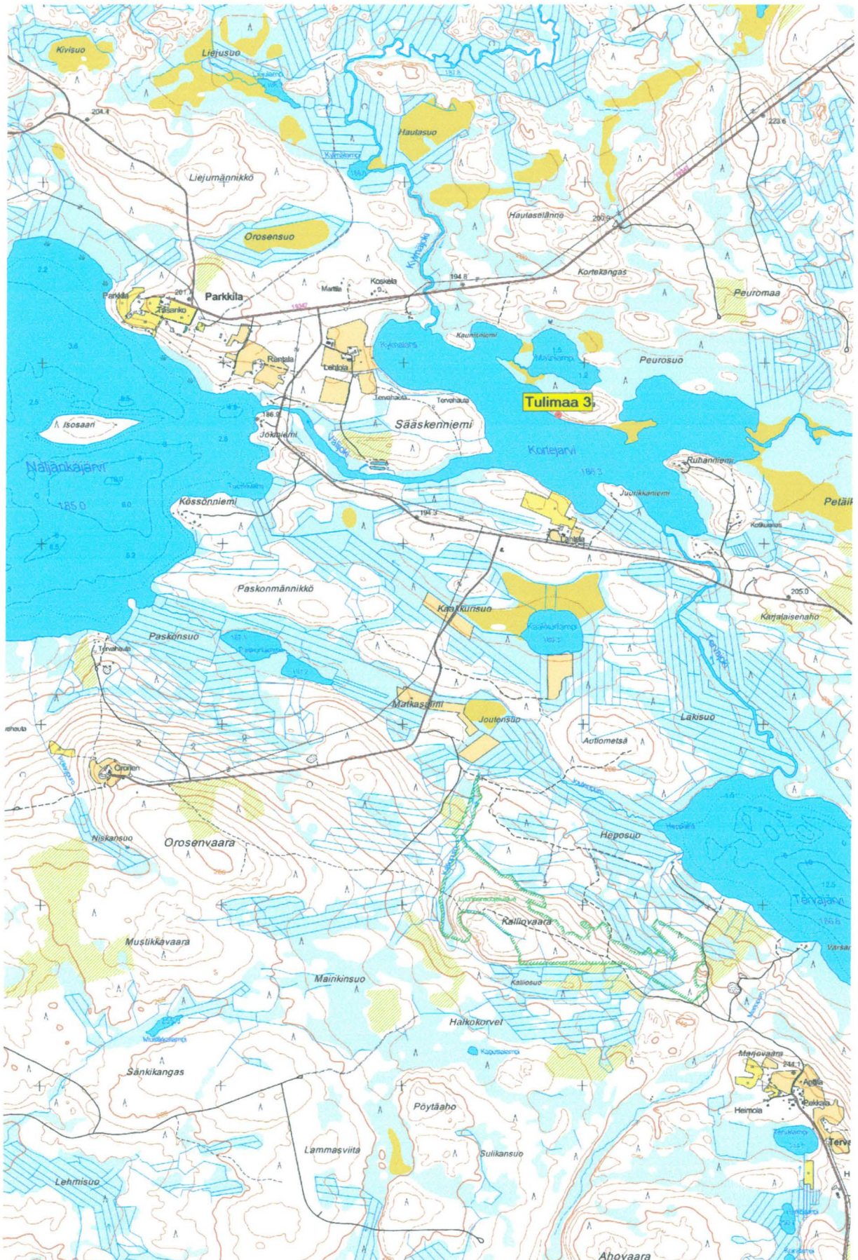
Kartta 2. Kopio Maanmittauslaitoksen avoimien aineistojen tiedostopalvelusta 24.11.2015 ladatusta kartasta R5232R. 1:25 000.