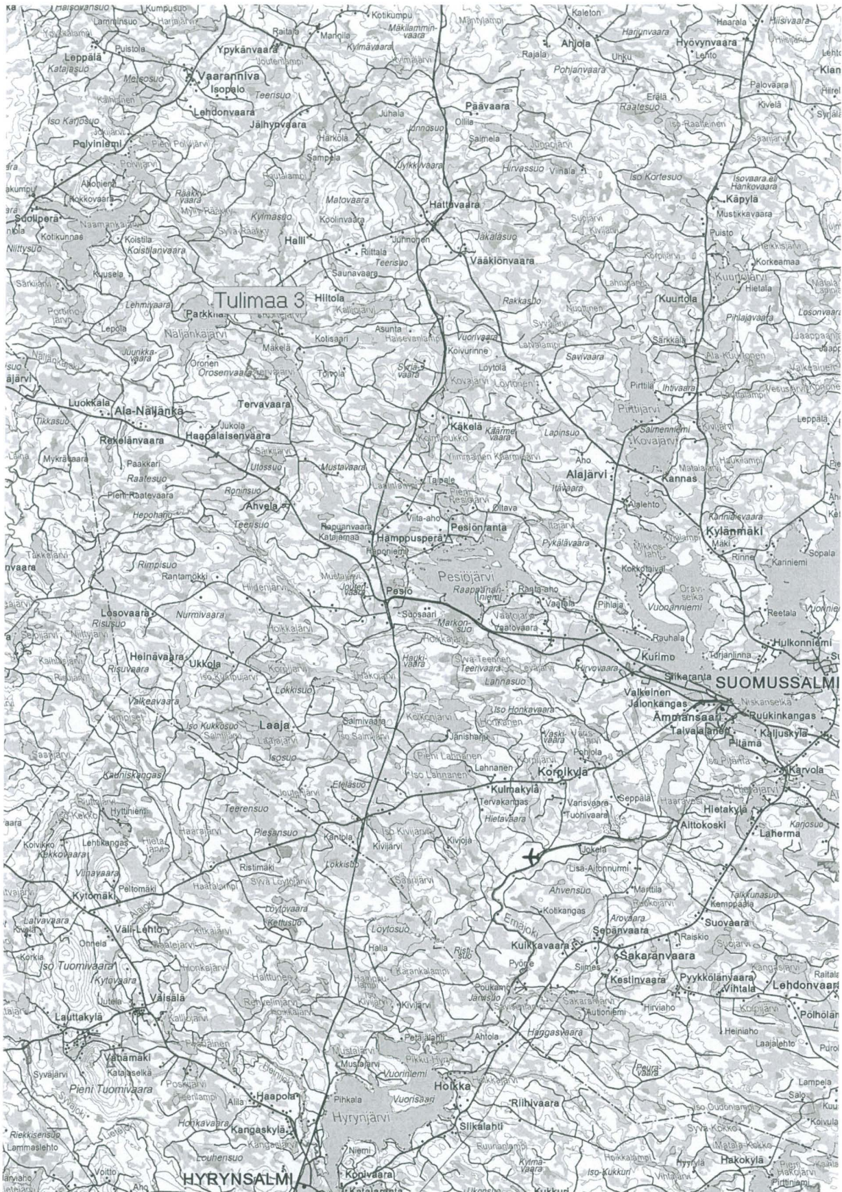
Kartta 1. Kopio Maanmittauslaitoksen avoimien aineistojen tiedostopalvelusta 27.8.2014 ladatusta kartasta UR5L_RVK. 1:250 000.