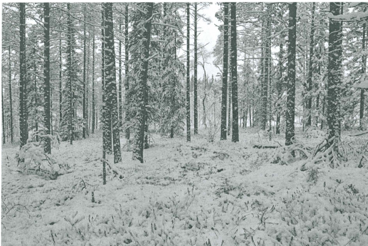
Kuva 1. Yleiskuva alueesta, kuvattu idästä. KaiM 8087:1.