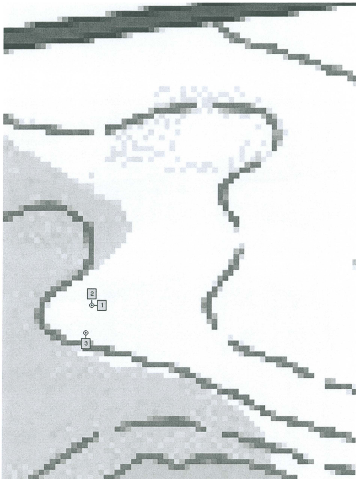
Kartta 3. Suurennos Maanmittauslaitoksen avoimien aineistojen tiedostopalvelusta 24.11.2015 ladatusta kartasta R5232R. 1:1000.