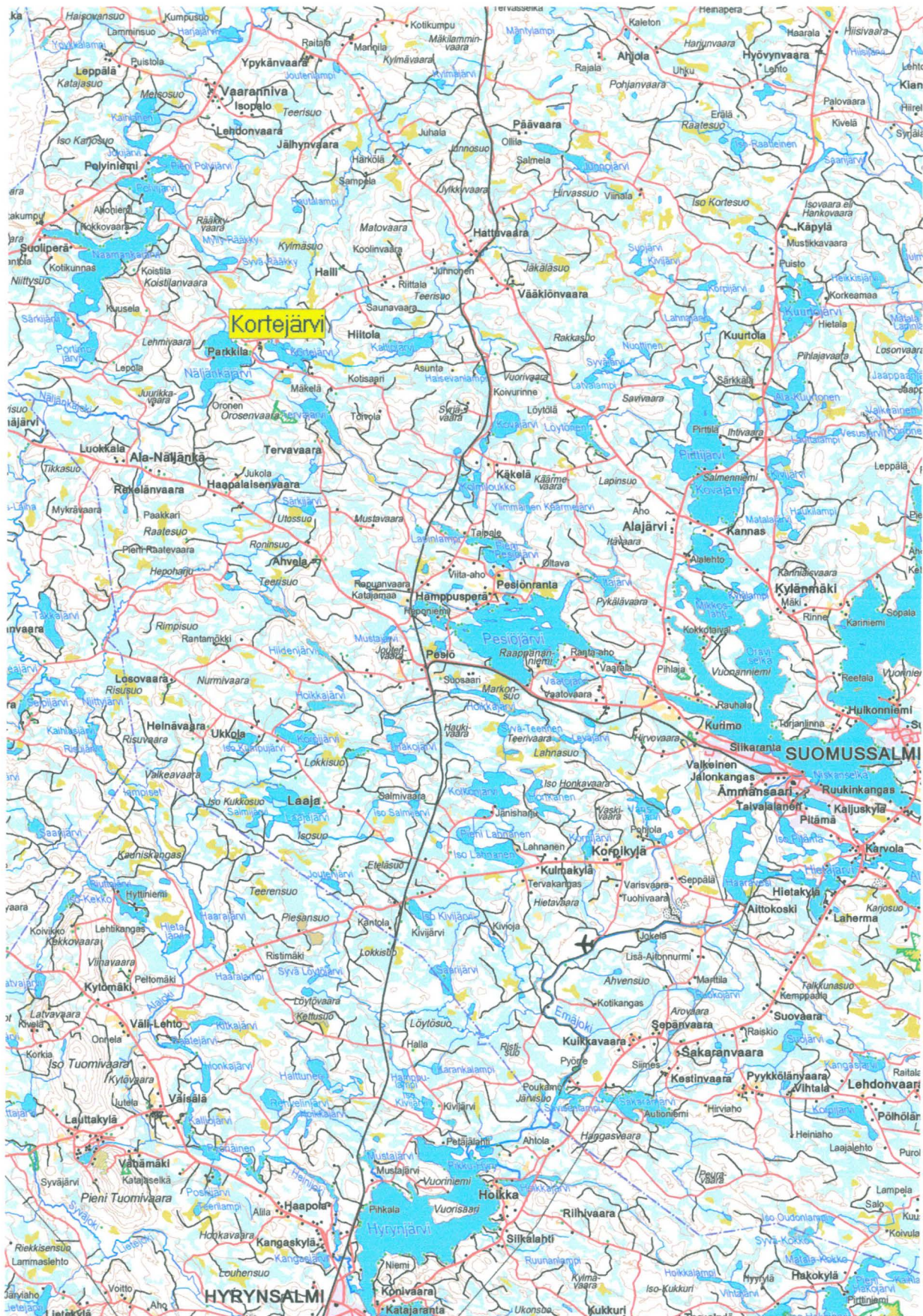
Kartta 1. Kopio Maanmittauslaitoksen avoimien aineistojen tiedostopalvelusta 27.8.2014 ladatusta kartasta UR5L_RVK. 1:250 000.