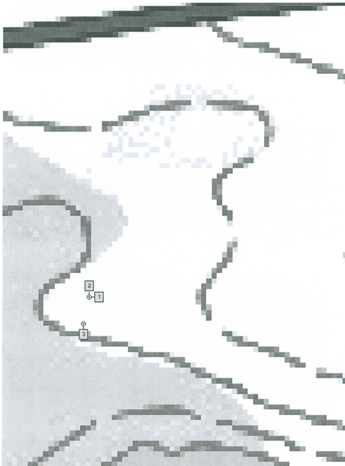
Kartta 3. Suurennos Maanmittauslaitoksen avoimien aineistojen tiedostopalvelusta 24.11.2015 ladatusta kartasta R5232R. 1:1000.