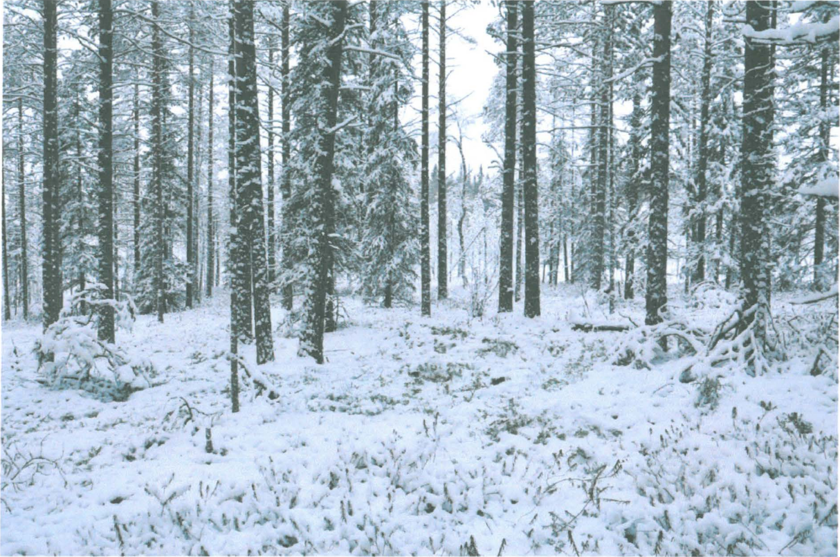
Kuva 1. Yleiskuva alueesta, kuvattu idästä. KaiM 8087:1.