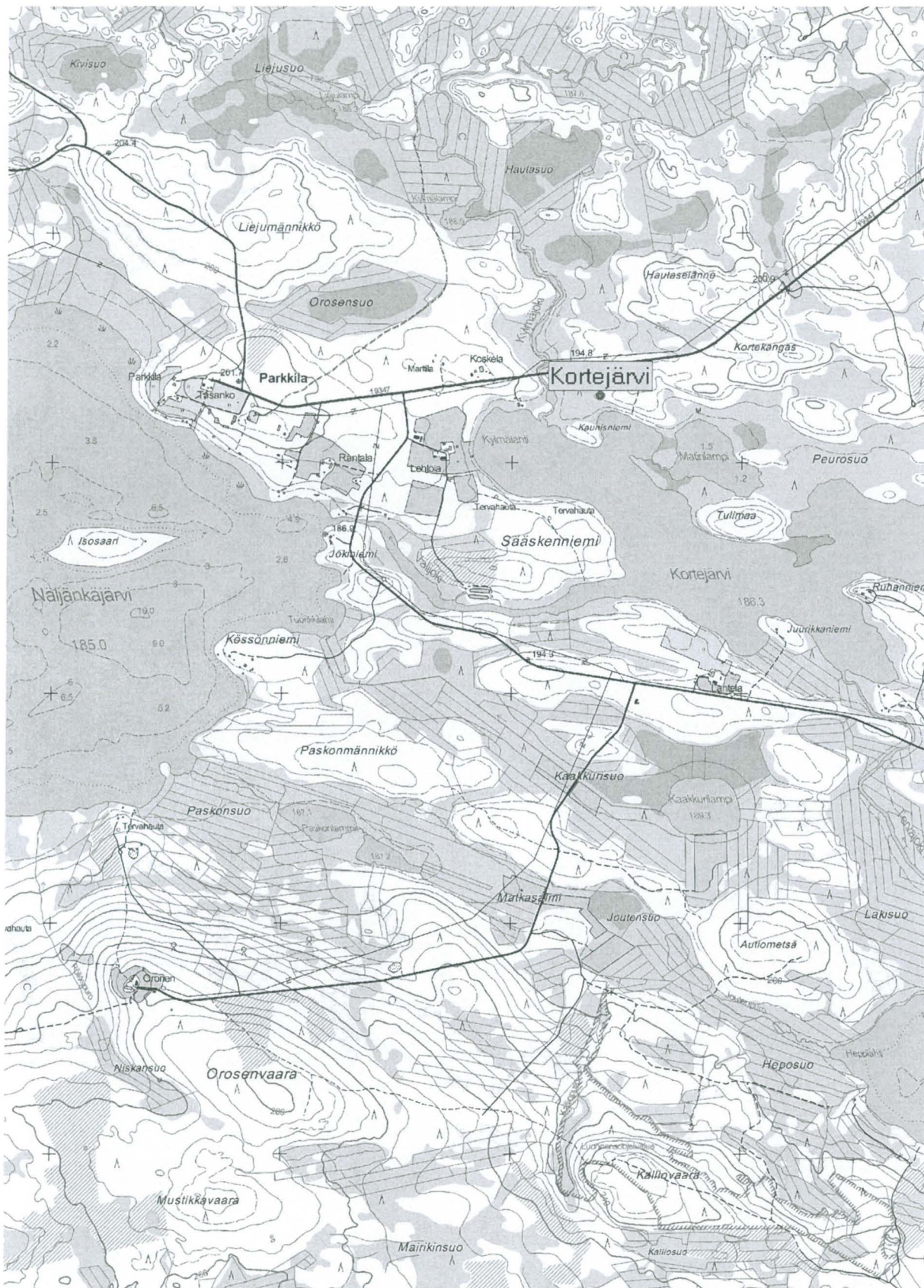
Kartta 2. Kopio Maanmittauslaitoksen avoimien aineistojen tiedostopalvelusta 24.11.2015 ladatusta kartasta R5232R. 1:25 000.