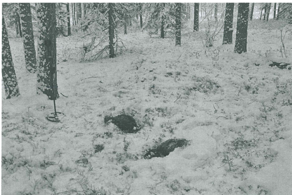
Kuva 2. Solkien löytökohdat. Kuvattu koillisesta. KaiM 8087:2.