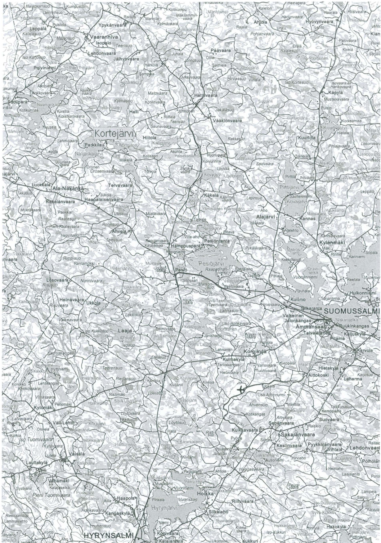
Kartta 1. Kopio Maanmittauslaitoksen avoimien aineistojen tiedostopalvelusta 27.8.2014 ladatusta kartasta UR5L_RVK. 1:250 000.