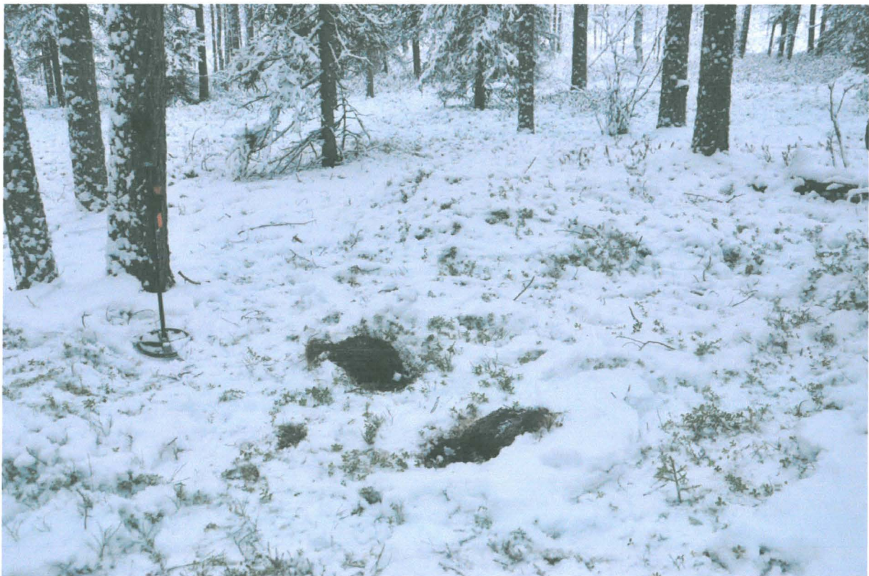
Kuva 2. Solkien löytökohtat. Kuvattu koillisesta. KaiM 8087:2.