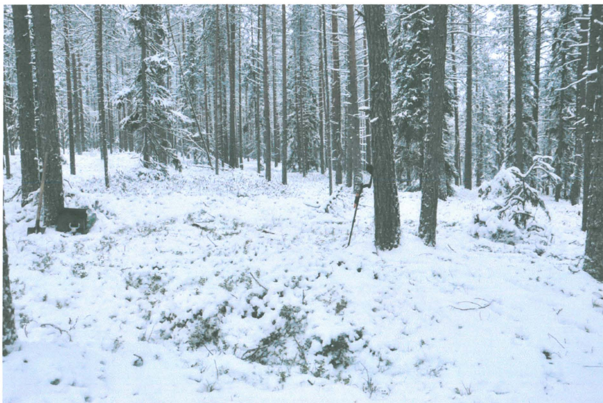
Kuva 4. Solkien löytökohdan länsipuolella oleva kumpare. Kuvattu lännestä. KaiM 8087:5.