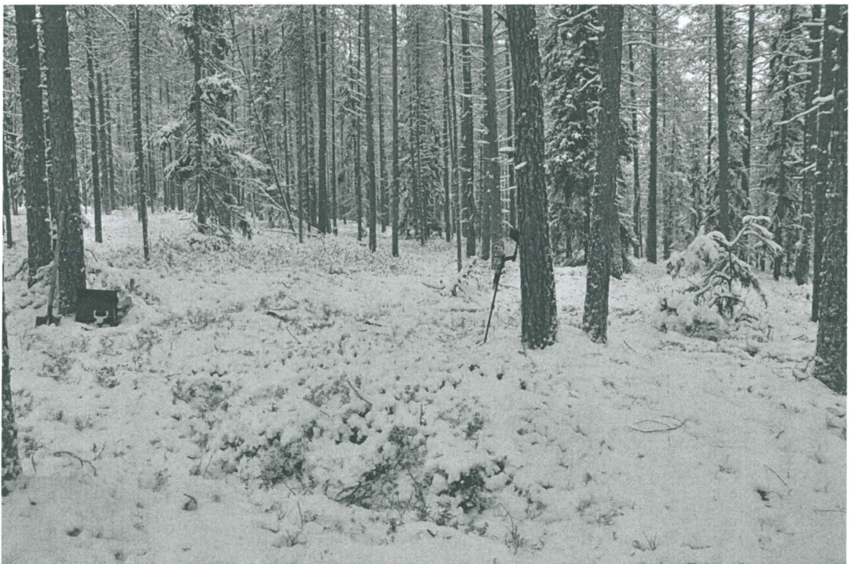
Kuva 4. Solkien löytökohdan länsipuolella oleva kumpare. Kuvattu lännestä. KaiM 8087:5.