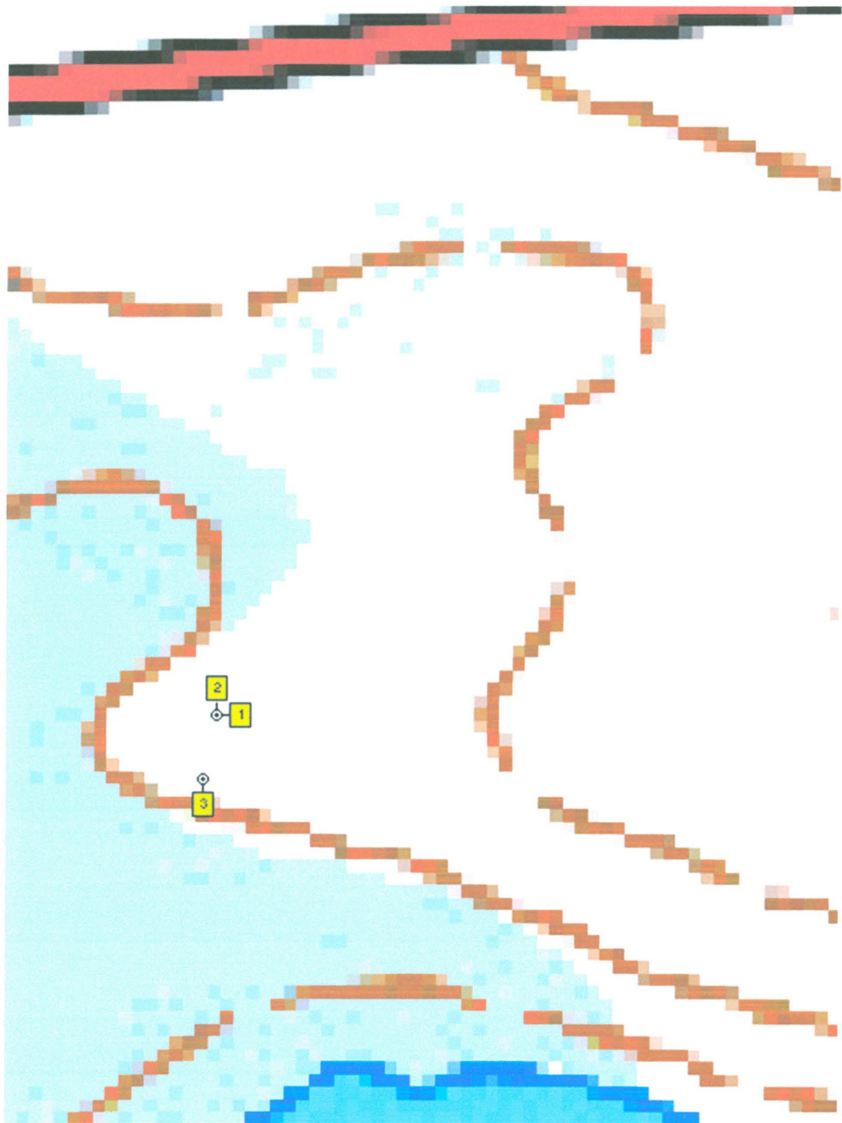
Kartta 3. Suurennos Maanmittauslaitoksen avoimien aineistojen tiedostopalvelusta 24.11.2015 ladatusta kartasta R5232R. 1:1000.