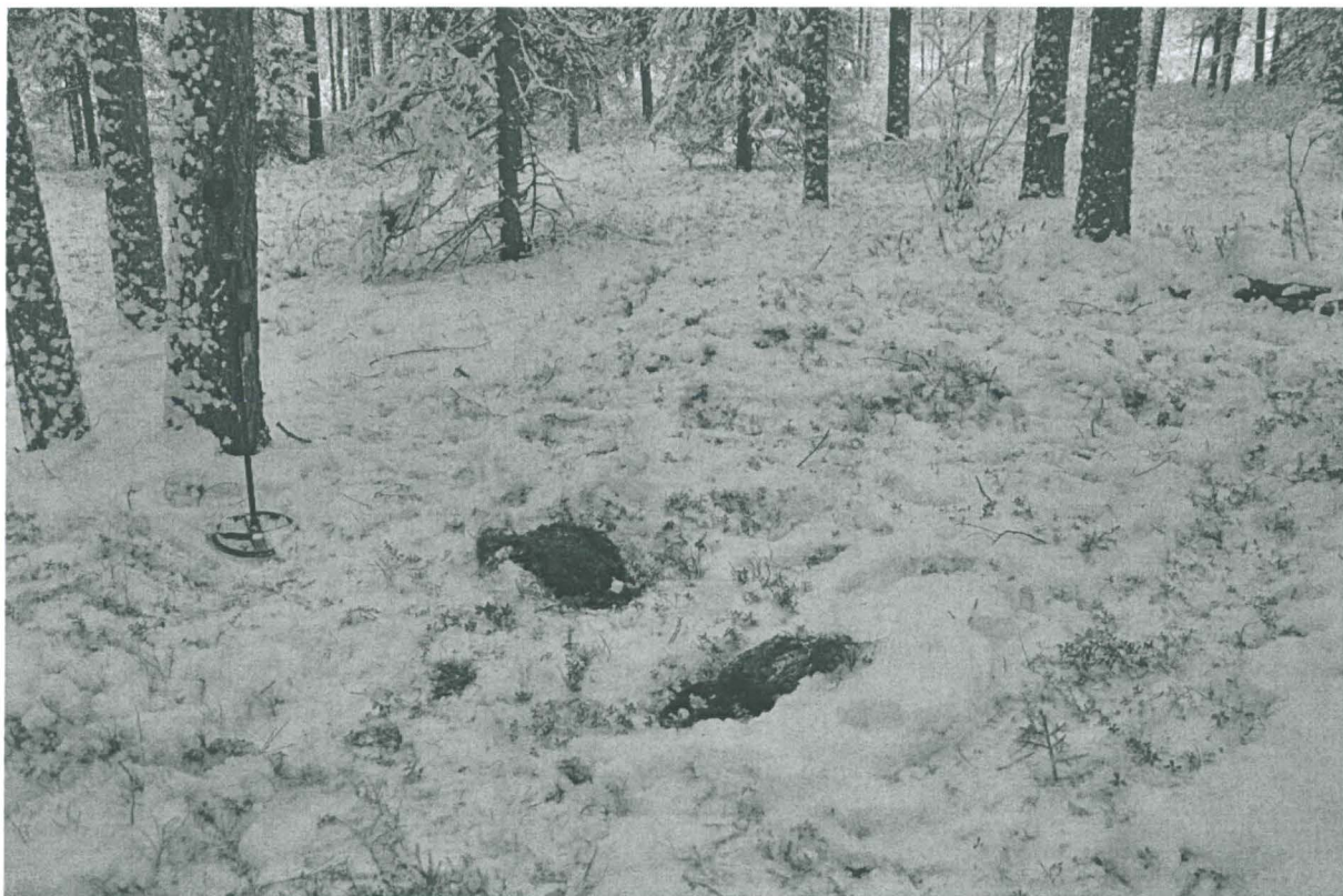
Kuva 2. Solkien löytökohtat. Kuvattu koillisesta. KaiM 8087:2.