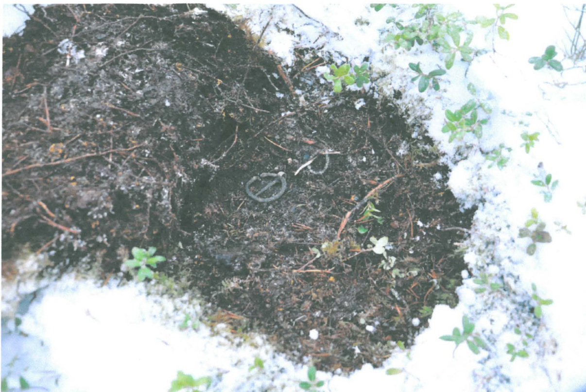
Kuva 3. Solki 2 löytöpaikallaan. KaiM8087:3.