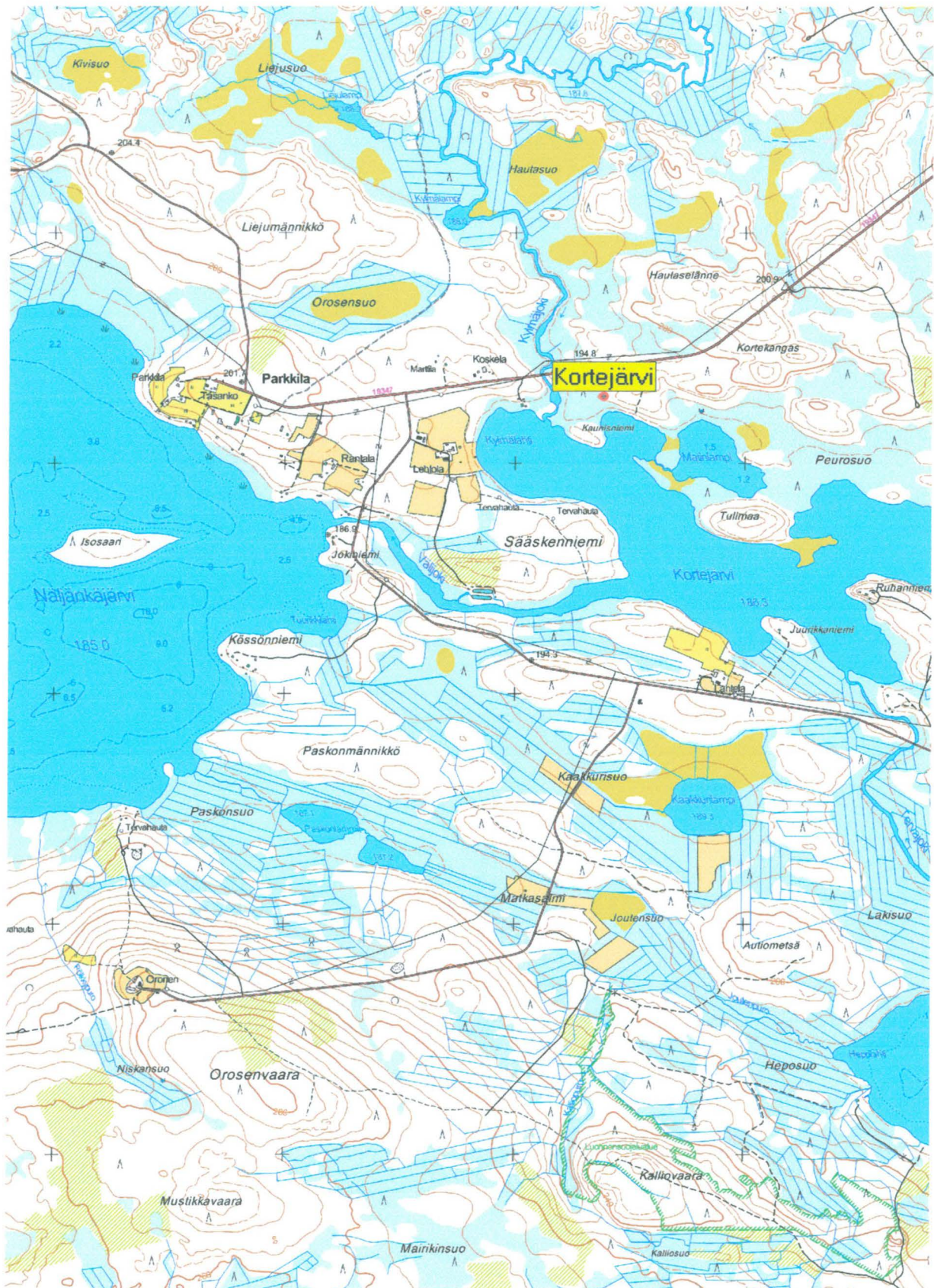
Kartta 2. Kopio Maanmittauslaitoksen avoimien aineistojen tiedostopalvelusta 24.11.2015 ladatusta kartasta R5232R. 1:25 000.