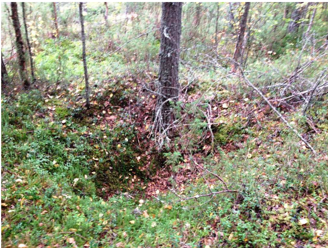
Kuva 2. Kaijankallion pirtin vieressä oleva kuoppa.