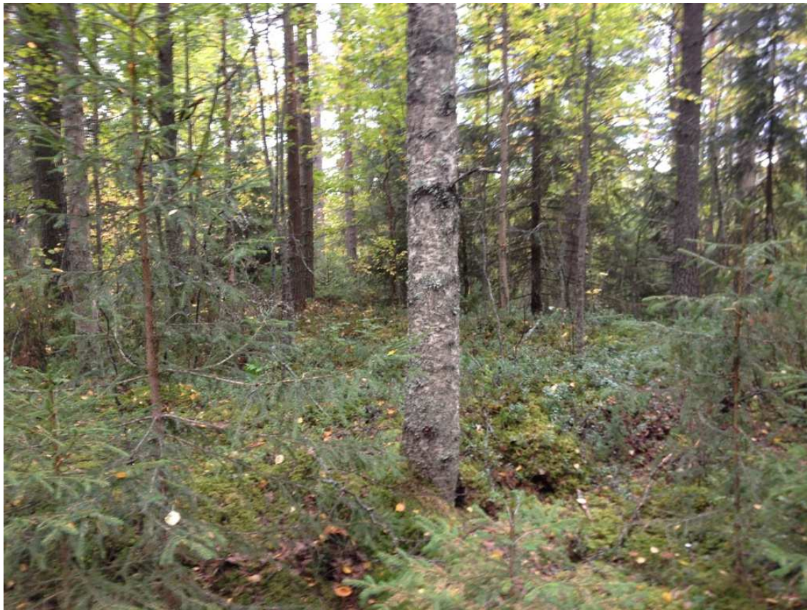
Kuva 1. Kaijankallion pirtin kivijalkaa