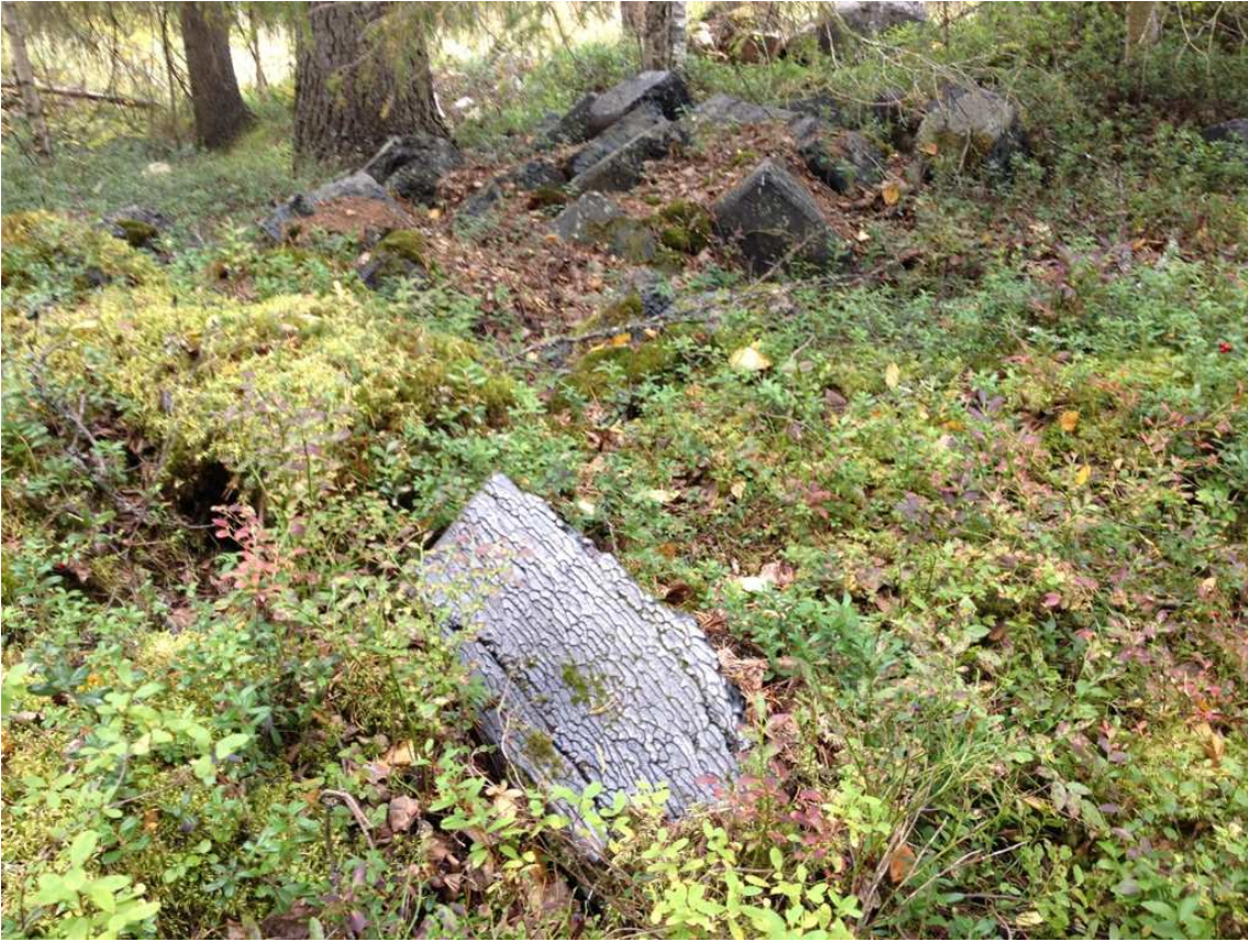
Kuva 3. Slagiharkkoja alueen pohjoisosassa.