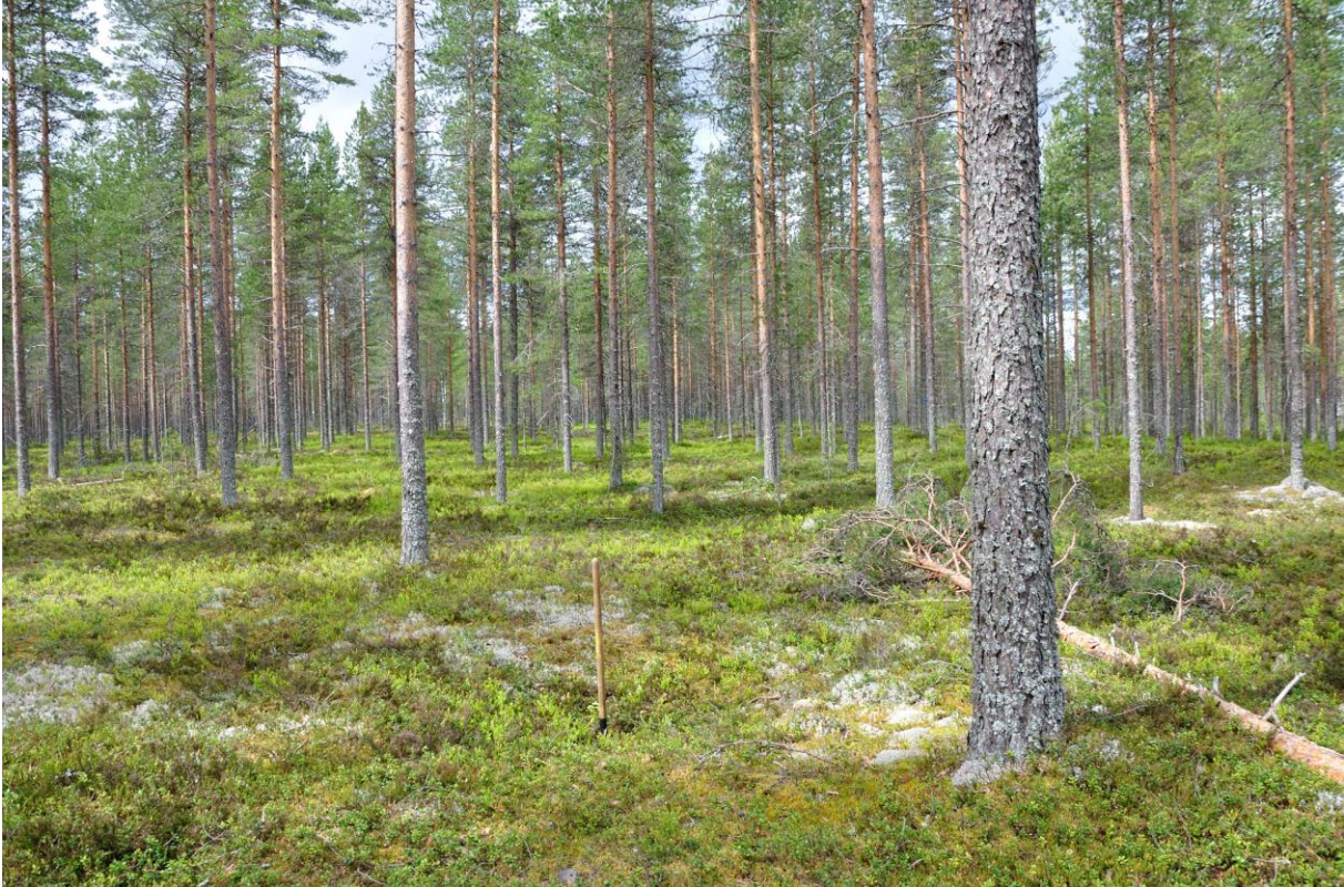
Kuva 1. Kuoppa 1. Kuvattu idästä. KaiM 8091:1.