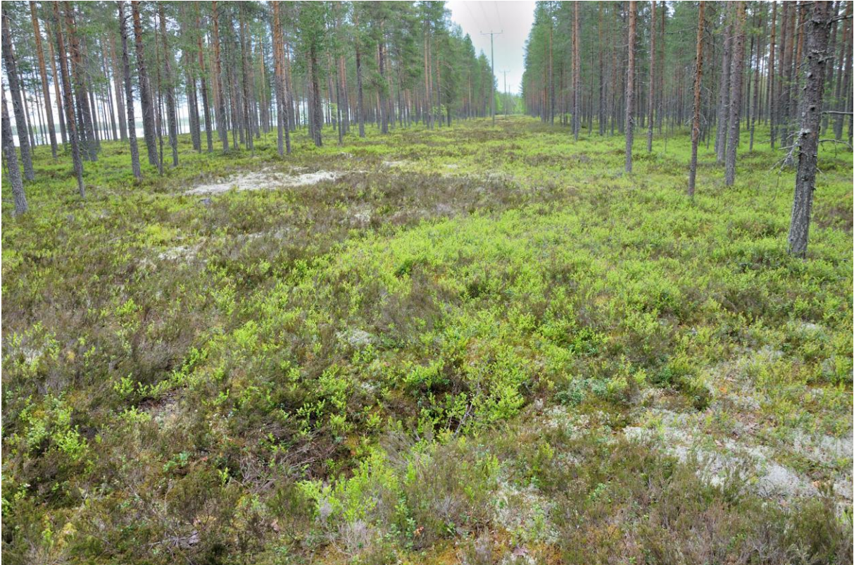
Kuva 3. Kuoppa 7 sähkölinjan alla. Kuvattu lännestä. KaiM8091:5