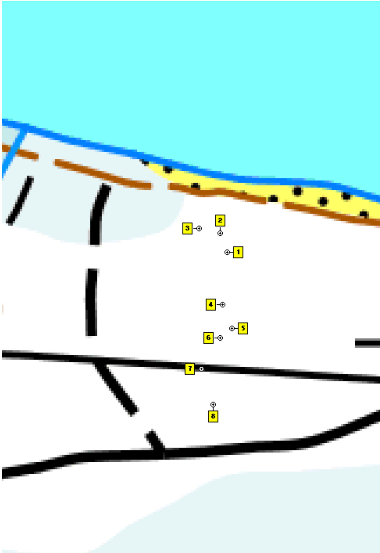
Kartta 3. Suurennos Maanmittauslaitoksen avointen aineistojen tiedostopalvelusta 10.12.2015 ladatusta kartasta R5113L. 1:1000.