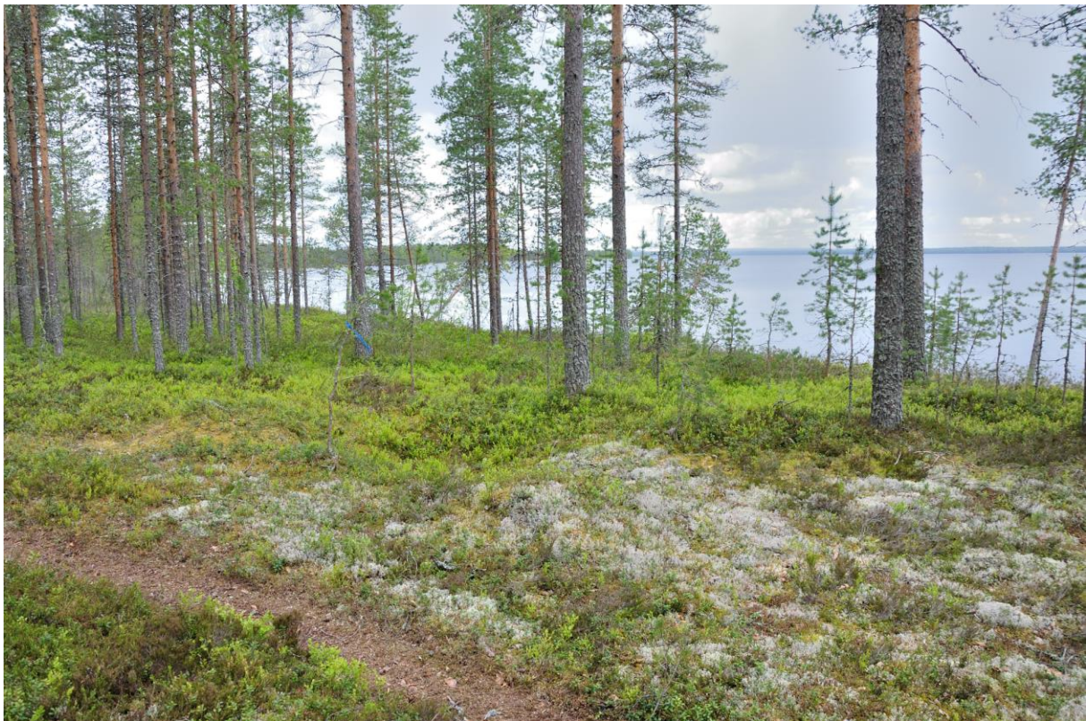
Kuva 2. Kuoppa 3. Kuvattu kaakosta. KaiM 8091:3.