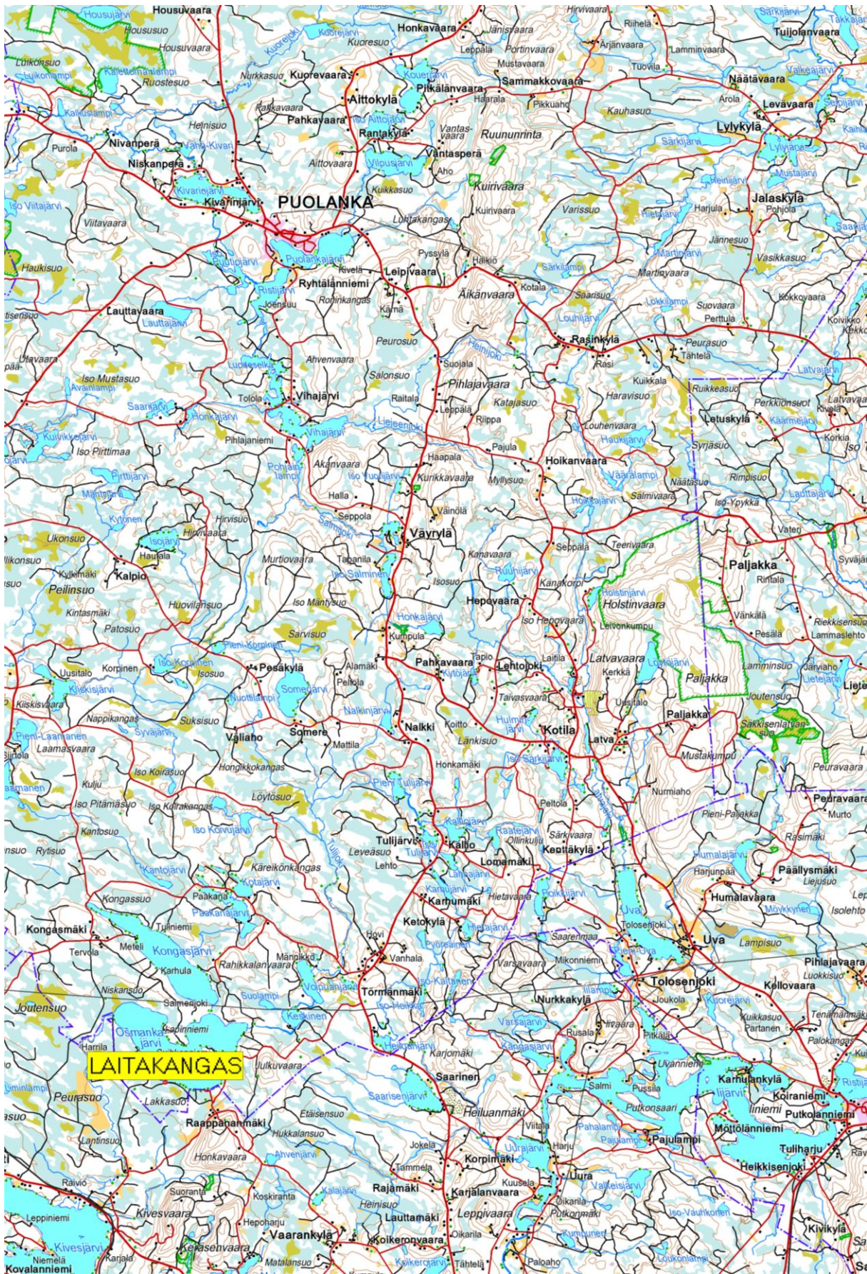
Kartta 1. Ote Maanmittauslaitoksen avointen aineistojen tiedostopalvelusta 26.11.2014 ladatusta kartasta UR5L_RVK. 1:250 000.