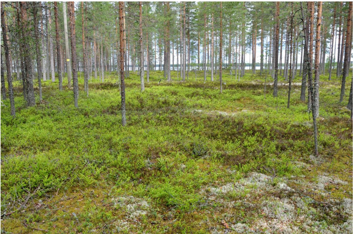
Kuva 4. Kuoppa 8. Kuvattu etelästä, KaiM 8091:6.