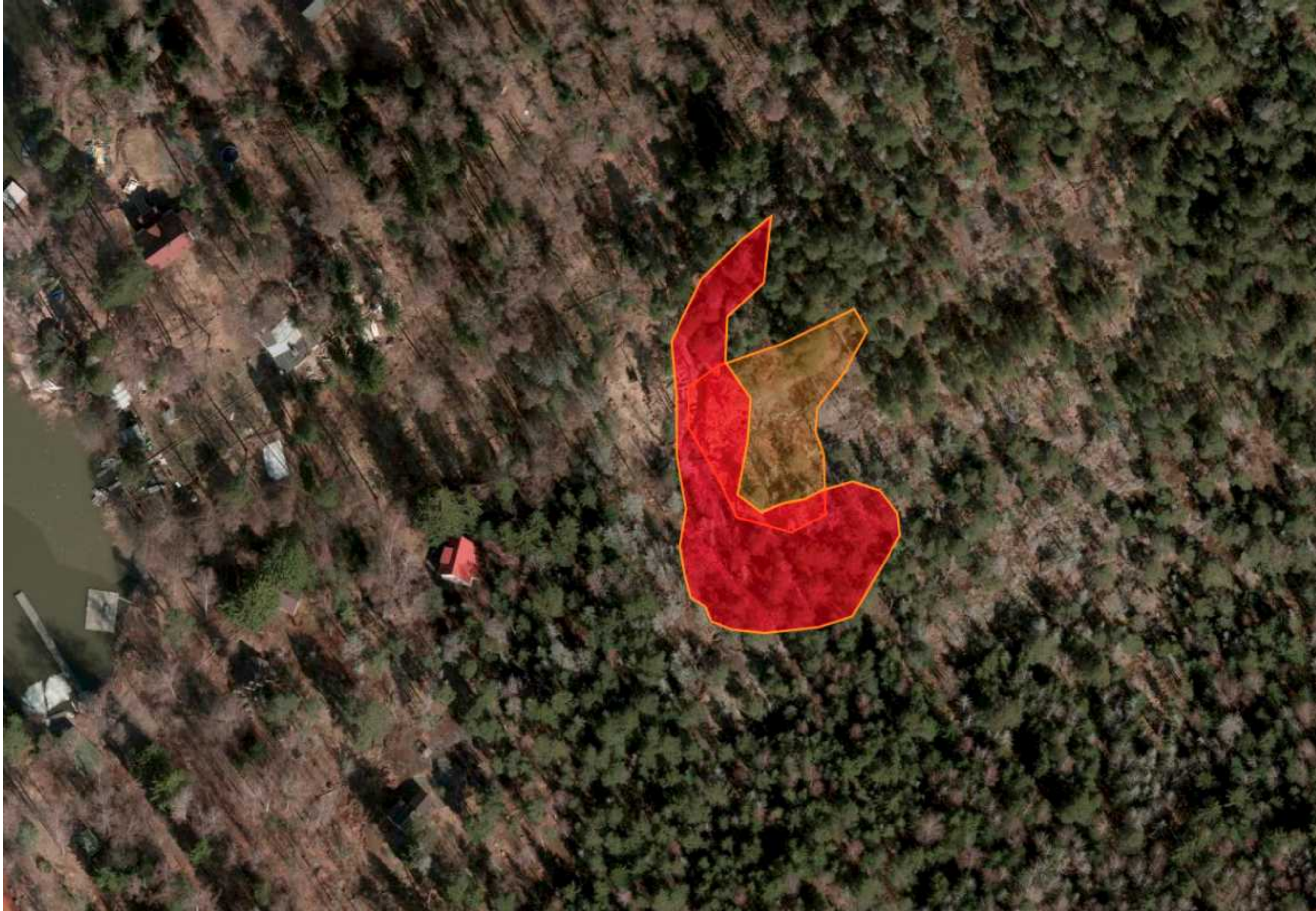
Ortokuva vuodelta 2010, jossa punaisella on esitetty liuskekivilouhoksen laajuus.