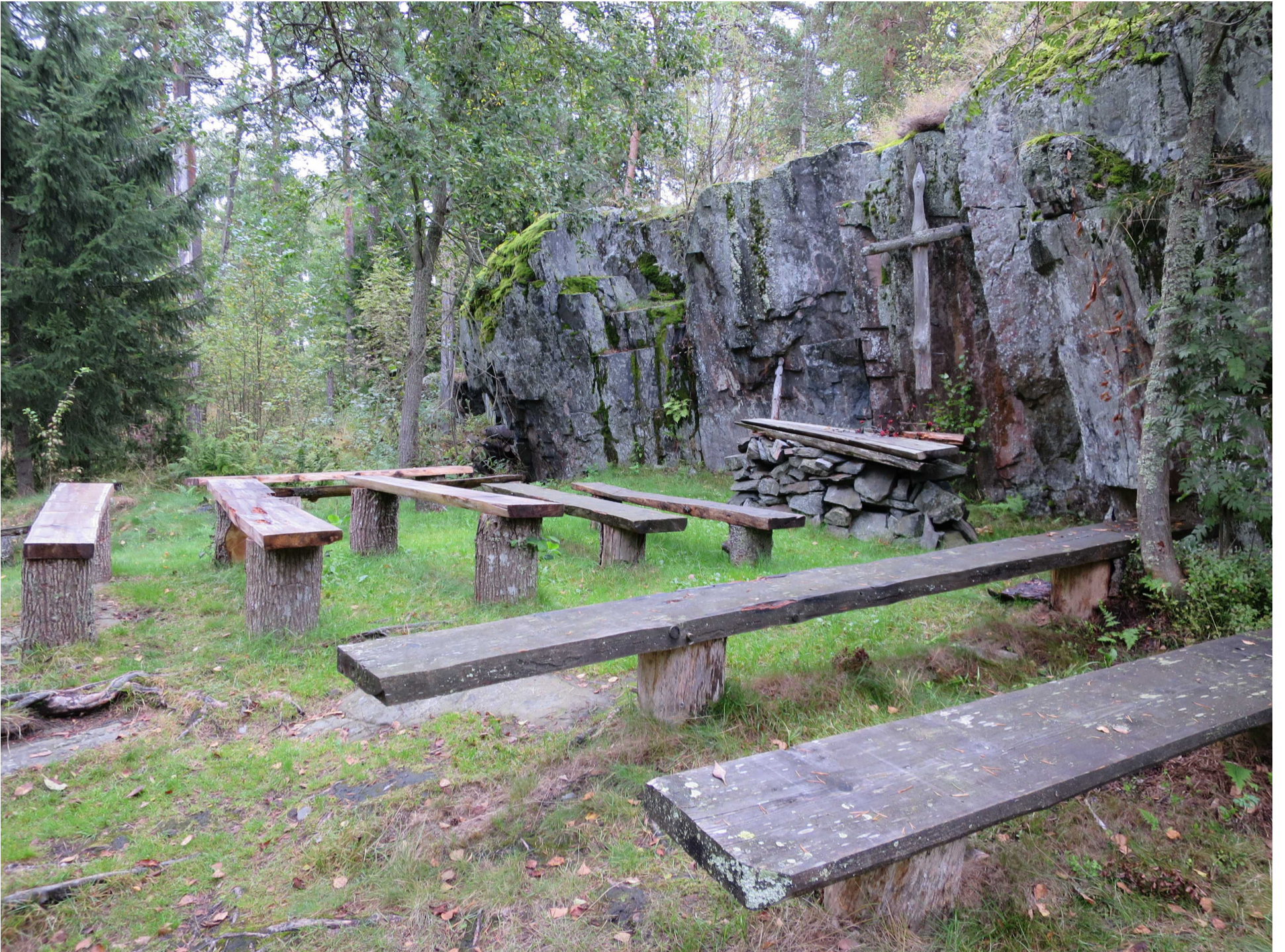
Liuskekivilouhos jyrkän seinämän kohdalla. Edessä näkyy hartauspaikka. Kuvaussuunta pohjoinen.