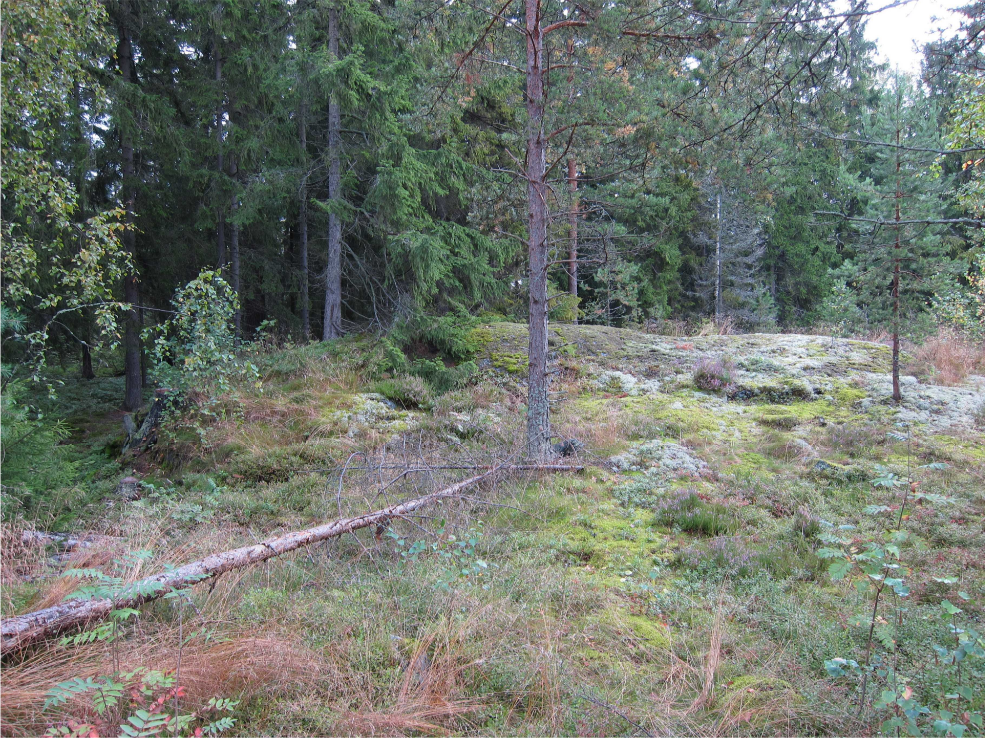
Kalliomäen korkein kohta. Kuvattu lännestä.