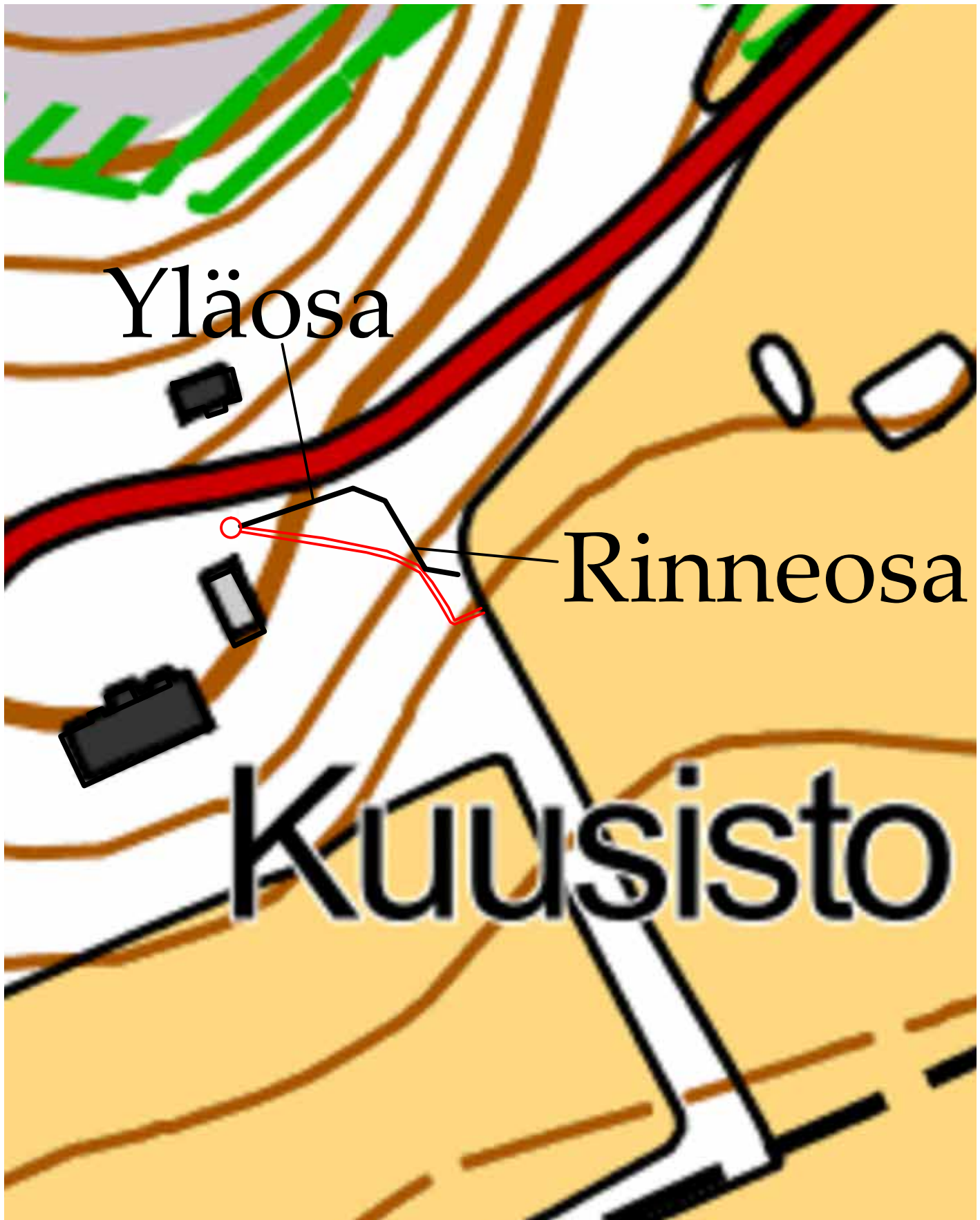
Karttakuva 3. Yleiskarttapohjaan (1:1250) merkitty mustalla toteutunut putkilinjaus ja sen eri osat. Punaisella merkitty suunnitelman mukainen putkilinjaus. Karttapohja MML ja lisäykset K.Uotila / Muuritutkimus.