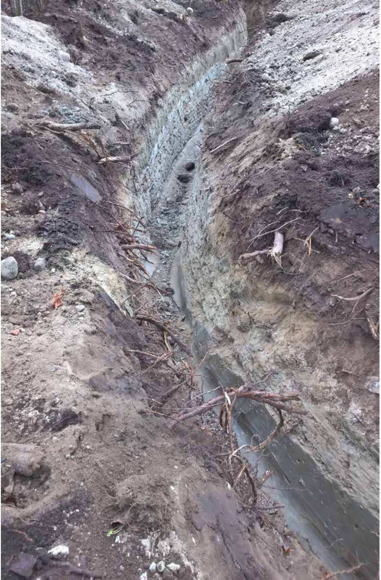
Kuva 2. Putkikaivannon rinteen kaarreosa. Esillä itäinen - ja läntinen profiili. NW. K.Uotila. Marras- kuu 2015.