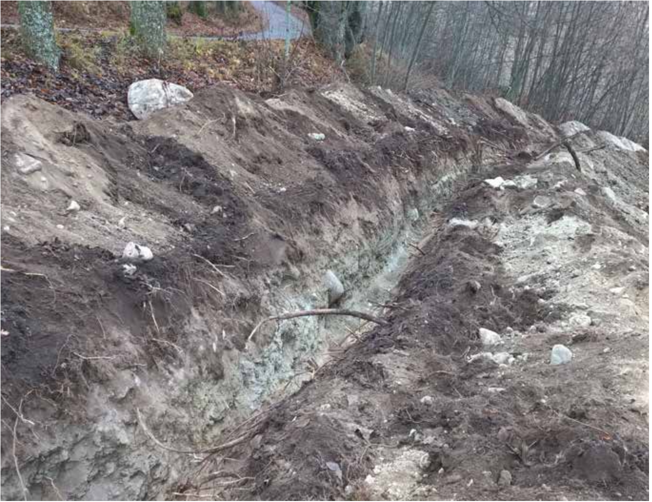
Kuva 3. Putkikaivannon yläosa. Esillä pohjoinen profiili. SW. K.Uotila. Marraskuu 2015.