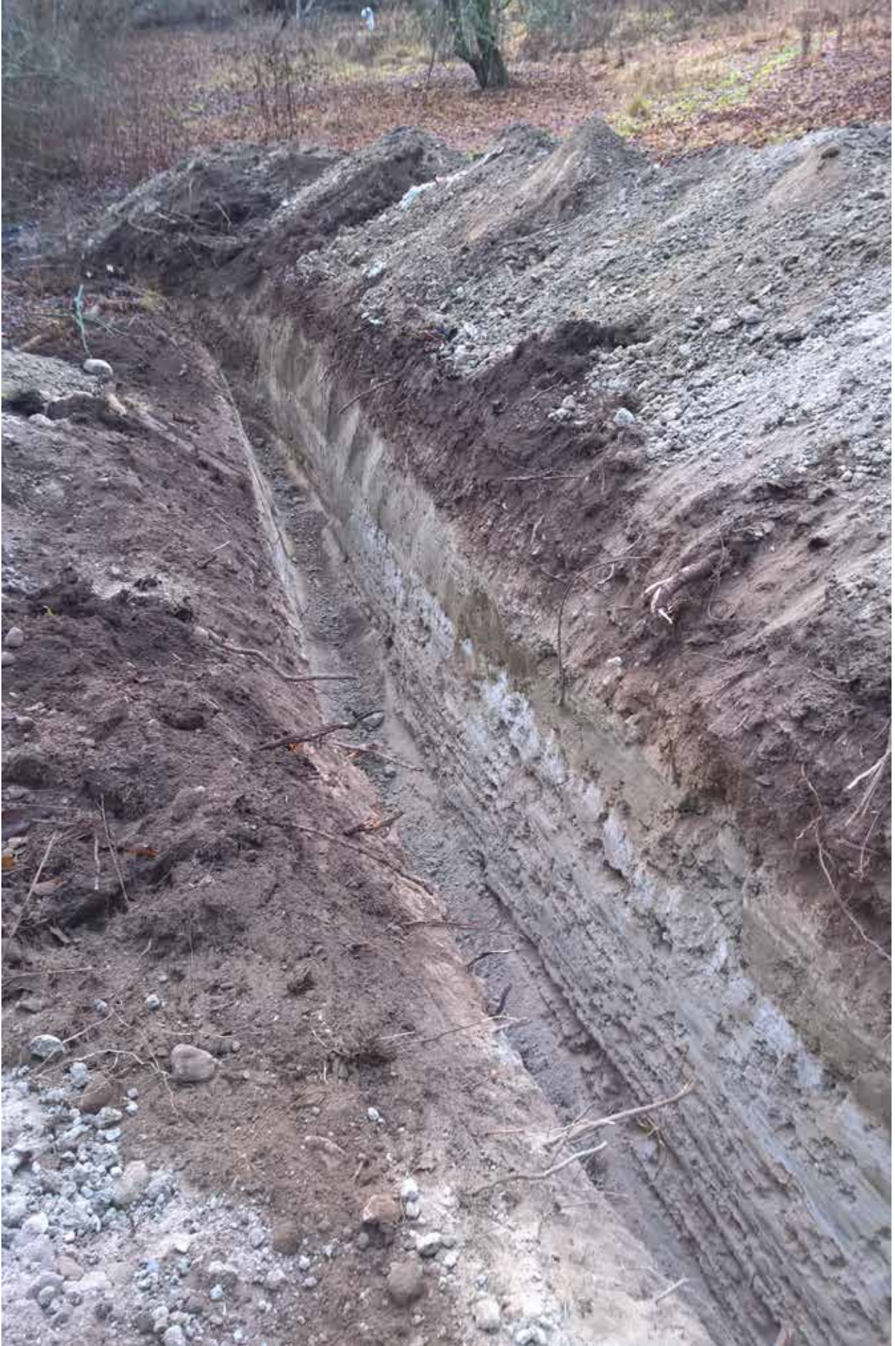
Kuva 1. Putkikaivannon rinteen ala- ja keskiosa. Esillä läntinen profiili. NE. K.Uotila. Marraskuu 2015.