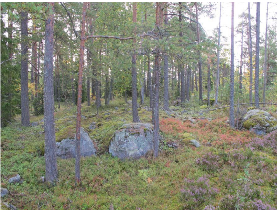
Kuva 2: Kohde, lähikuva. W.