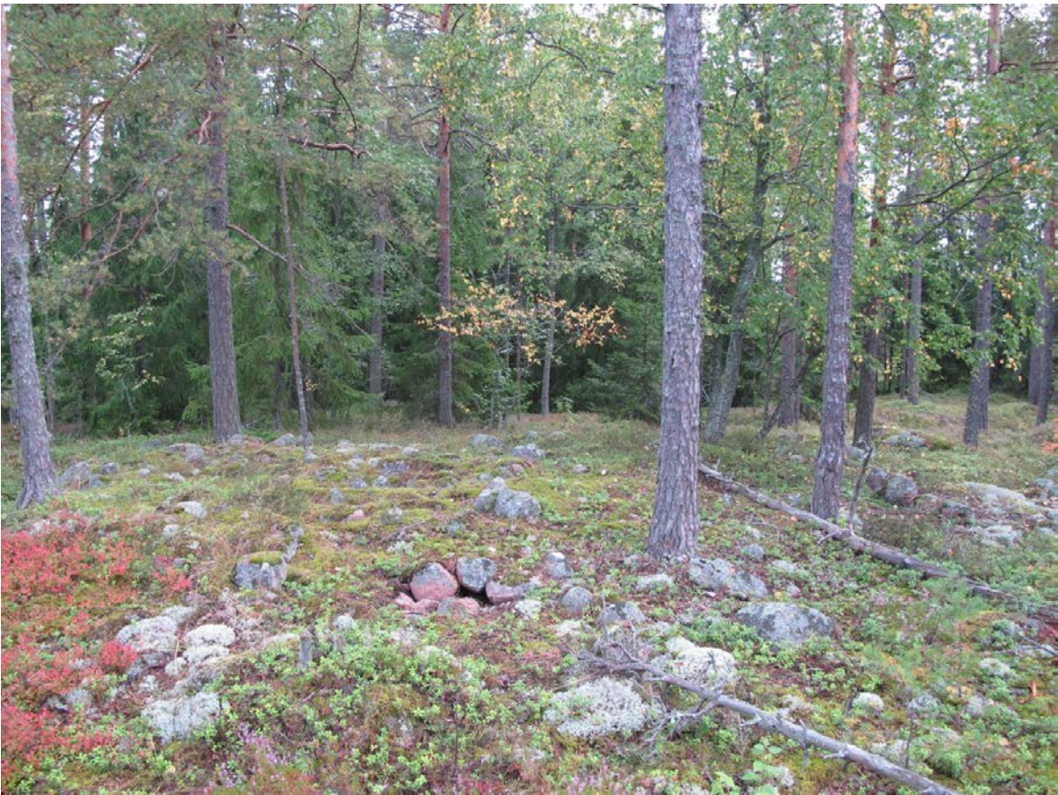
Kuva 3: Kohde suunnasta S.