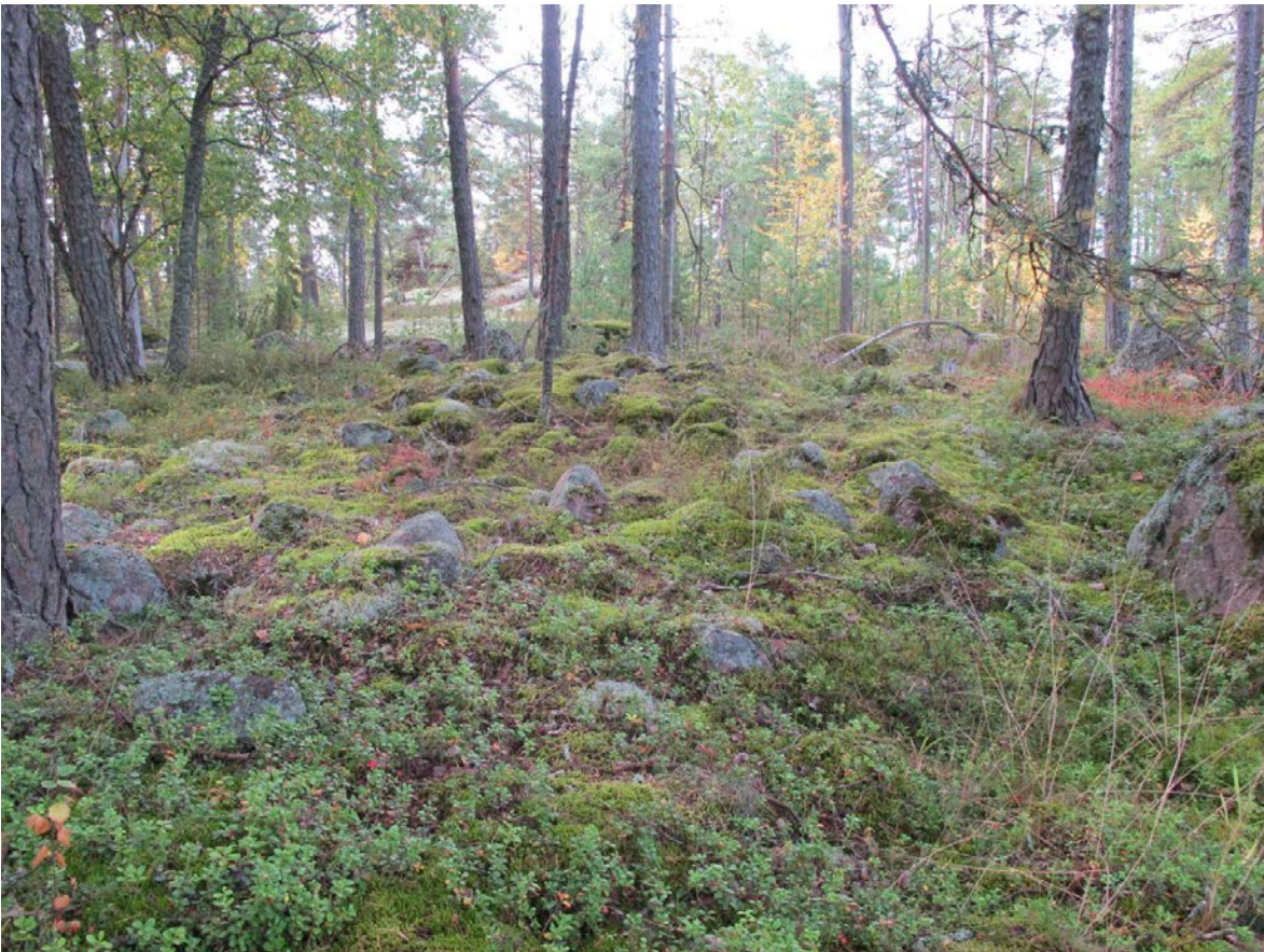
Kuva 4: Kohde suunnasta N. Taustalla jäkäläkasvuston peittämä kallioalueen korkein laki.