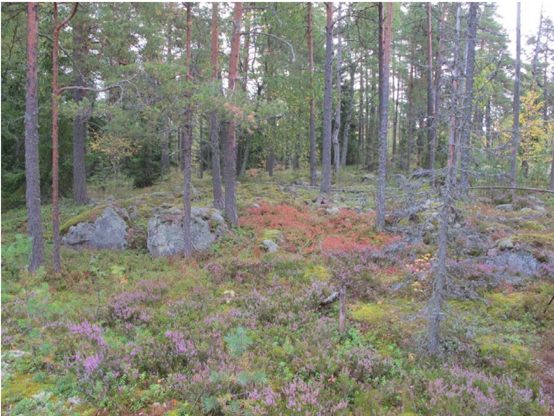
Kuva 1: Kohde ja sitä ympäröivää maastoa. W.