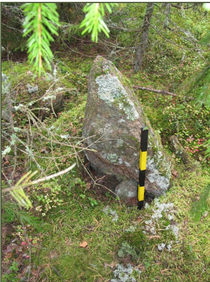
Kuva 5: Pystykivi ja sen takana oleva tukikivi. SW.