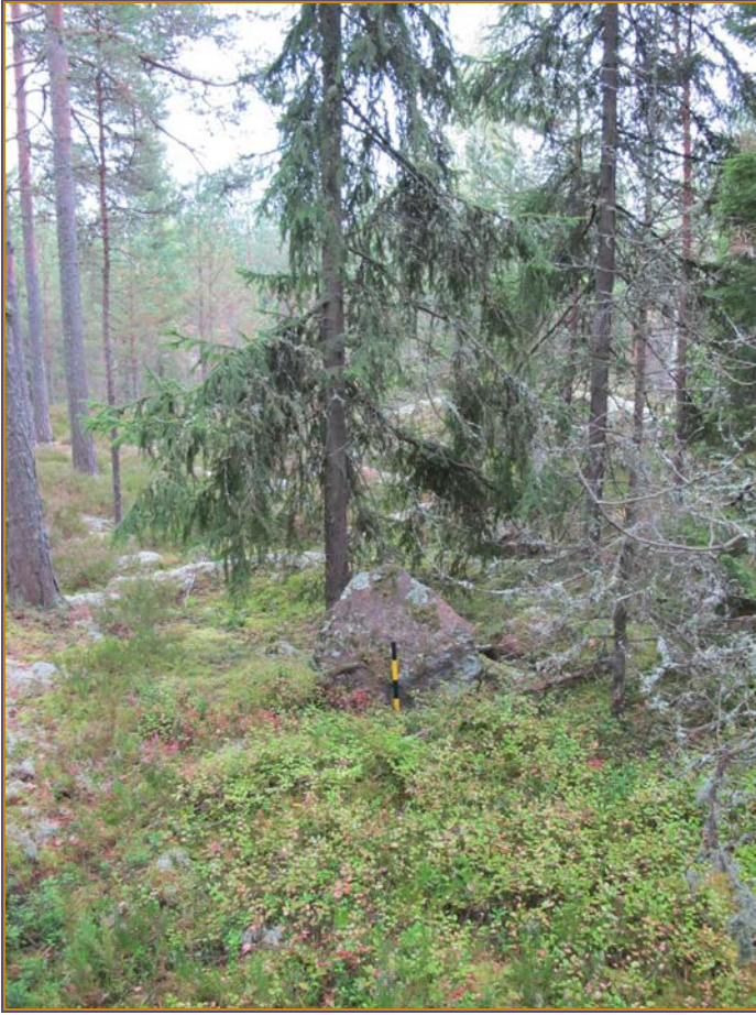
Kuva 4: Kohteen lähistöllä sijaitseva pystykivi. SE.