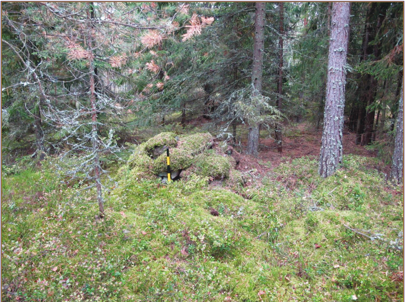
Kuva 3: Lähikuva kohteesta. W.