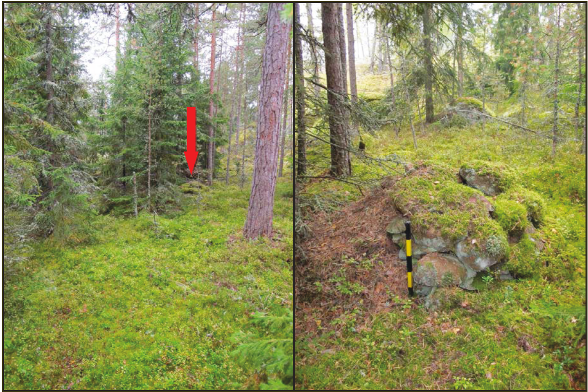
Kuvat 1-2: Yleiskuva (vas.) ja lähikuva kohteesta. N.