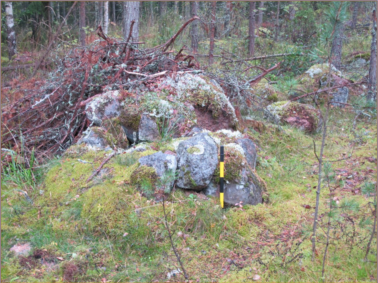
Kuva 3: Lähikuva kohteesta. N.