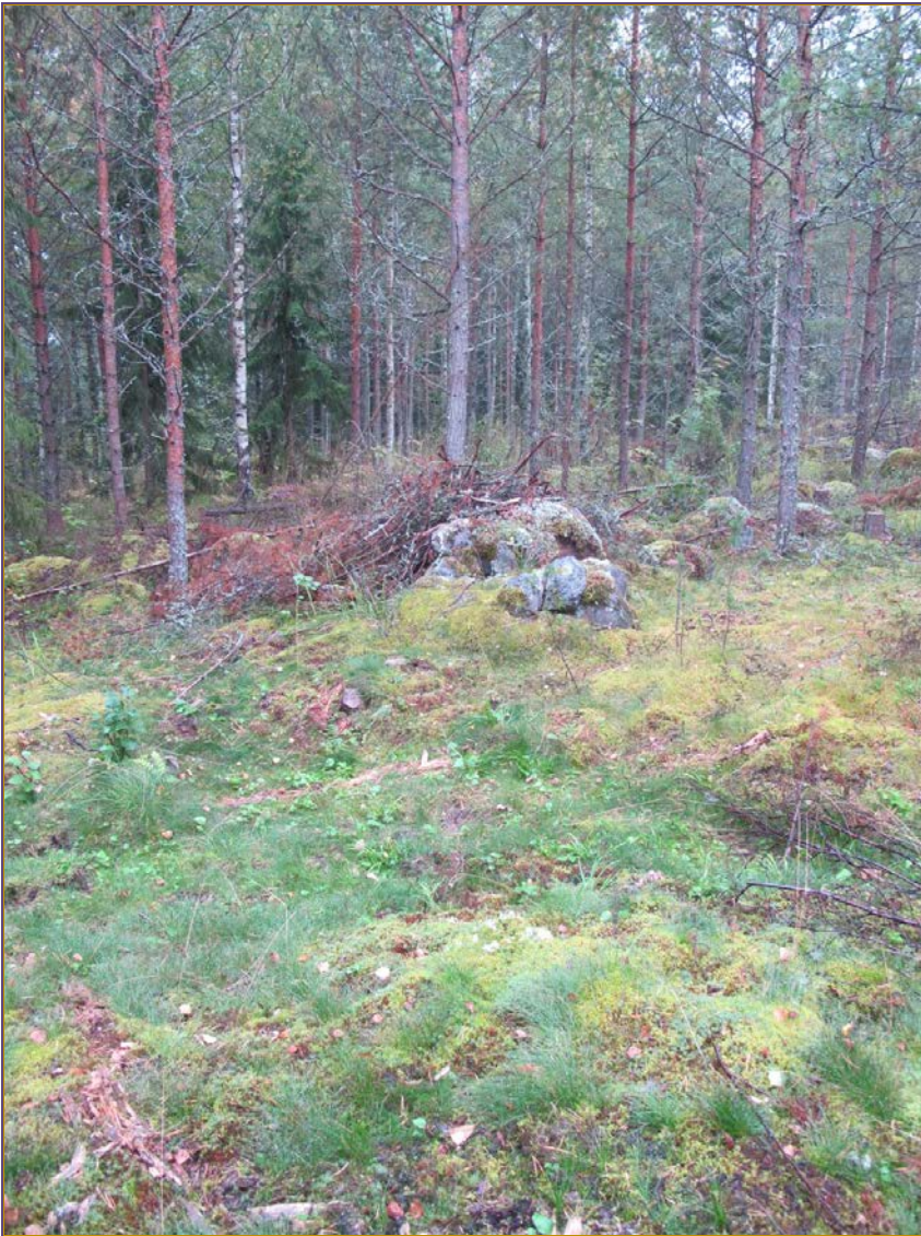
Kuva 1: Kohde ja sitä ympäröivää maastoa. NW.