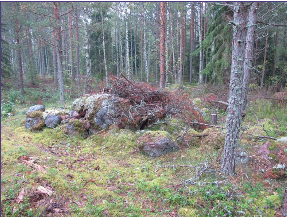
Kuva 2: Kohde ja sen editse kulkeva tie. SW.