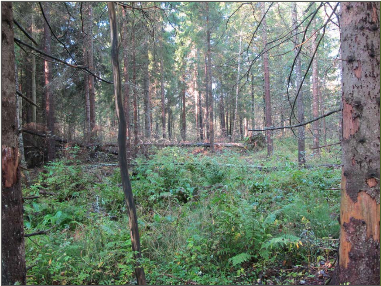
Kuva 1: Yleiskuva umpeenkasvaneesta peltoalueesta. S.