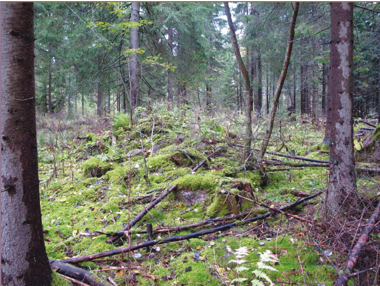
Kuva 4: Röykkiö 3. N.