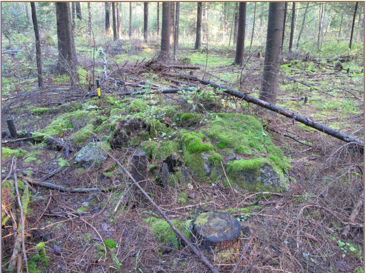
Kuva 2: Röykkiö 1. N.