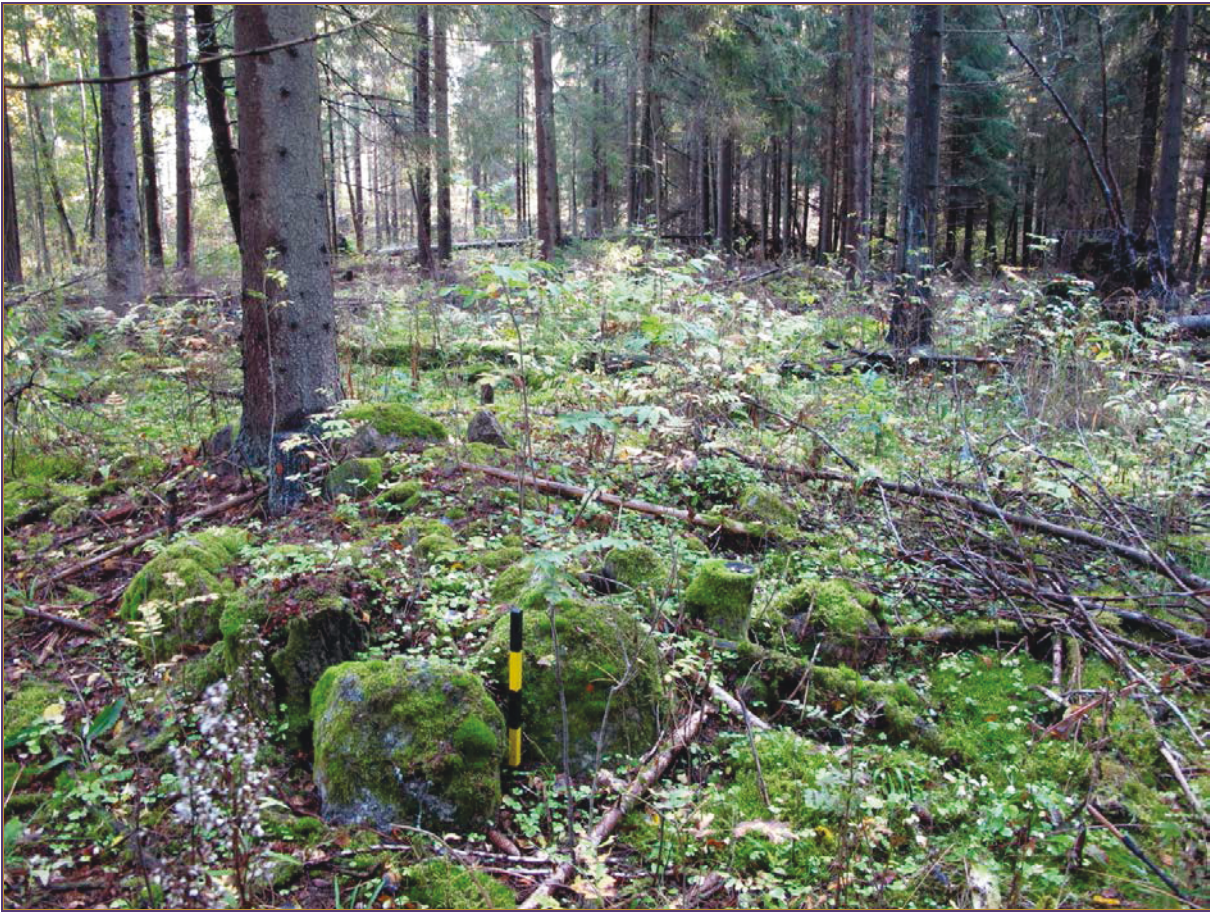
Kuva 3: Röykkiö 2. NE.