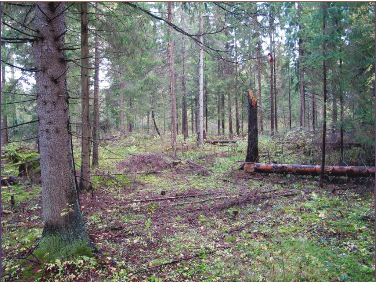
Kuva 6: Yleiskuva vanhasta pelto- ja myöhemmästä niittyalueesta. N.