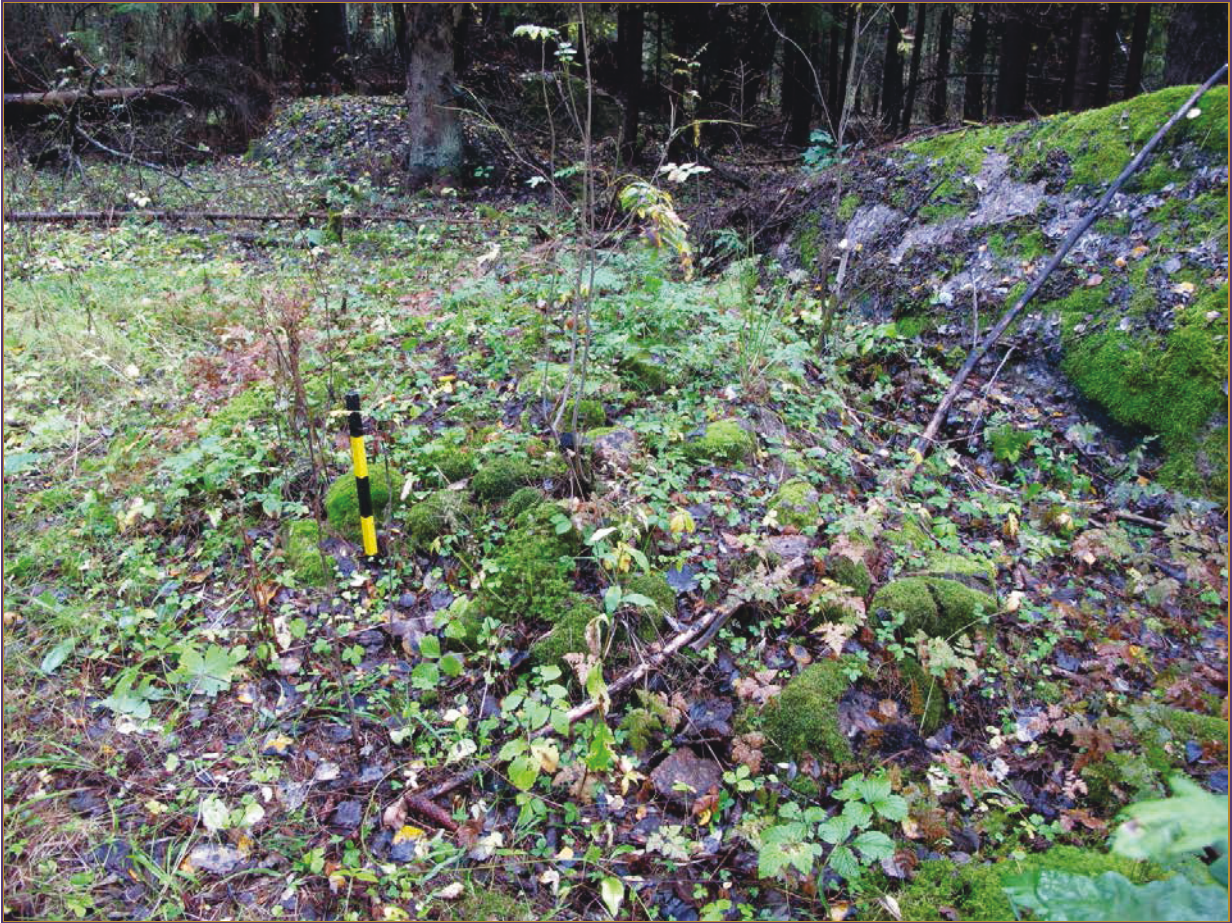
Kuva 5: Röykkiö 4. E.