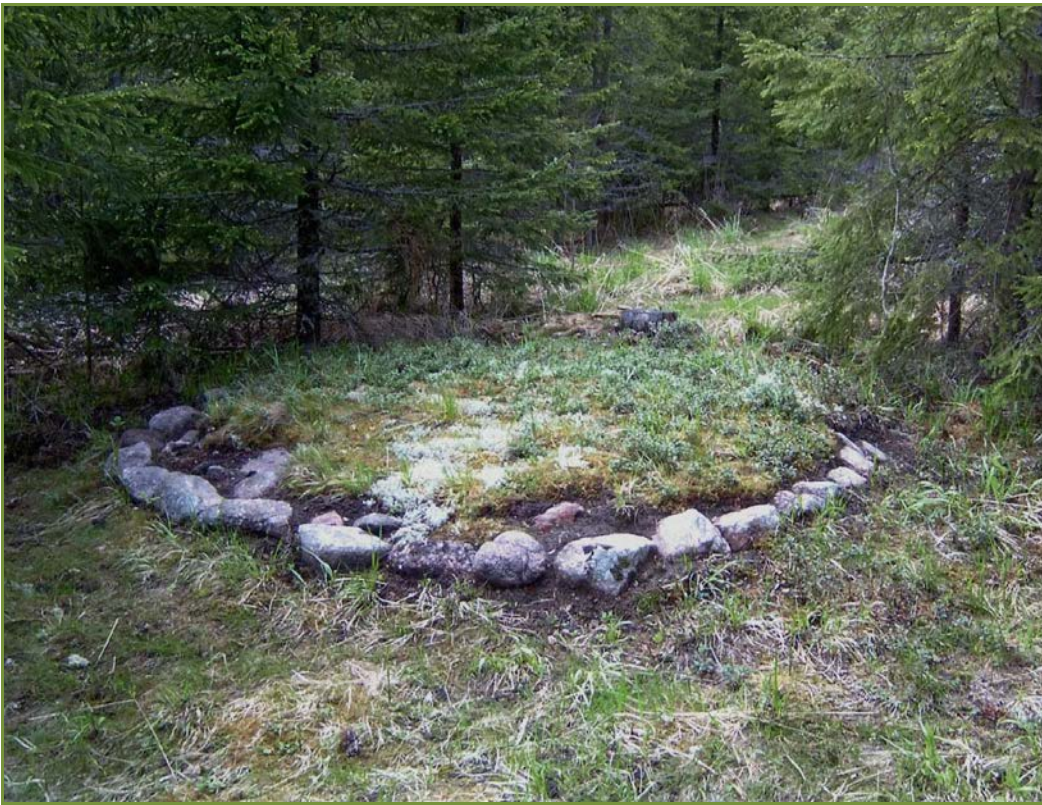
Kuva 3: Kelovuori 1. Vuonna 2015 tarkastettu aumanpohja paljastettuna ja kuvattuna vuonna 2006/2007. SW.