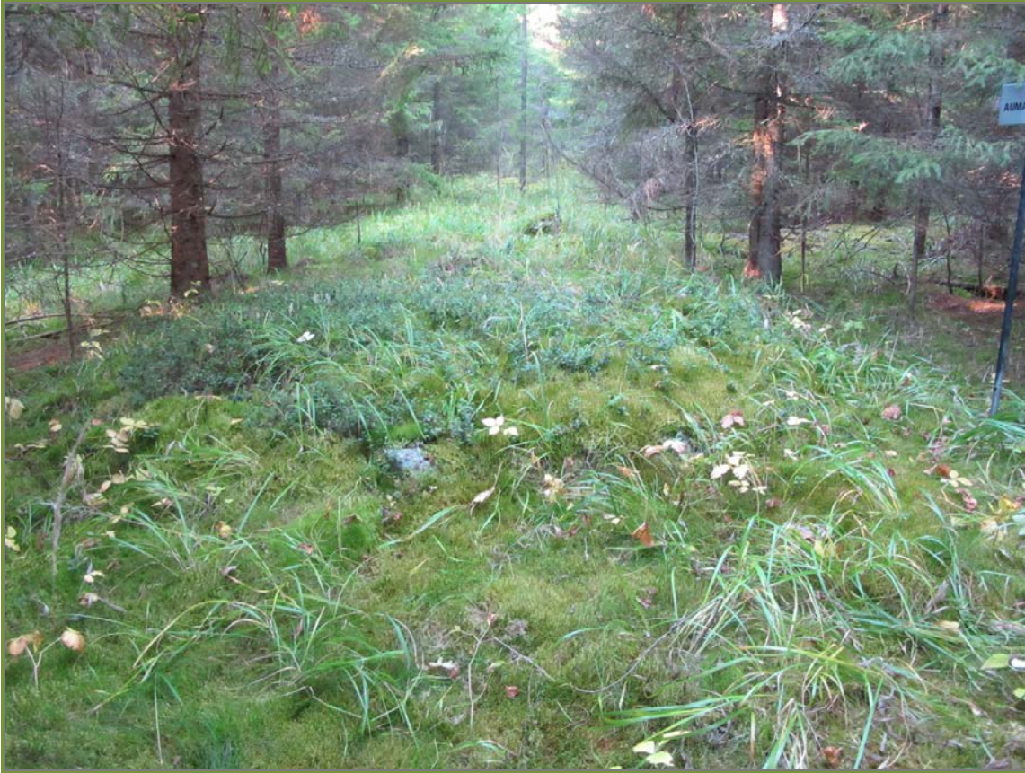
Kuva 1: Kelovuori 1. Kohteen sijainti maastossa. S.