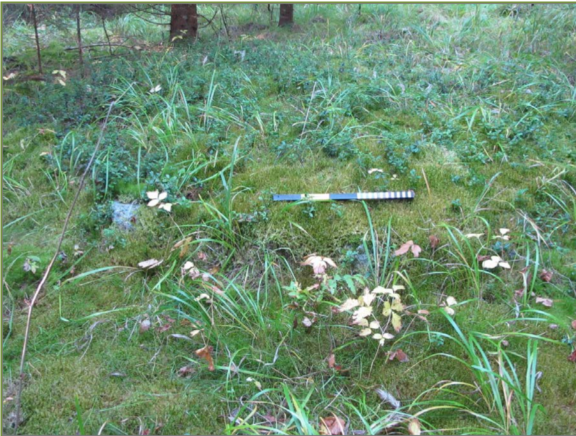
Kuva 2: Kelovuori 1. Aumanpohjan kehäkiveystä. Lähikuva. SW.