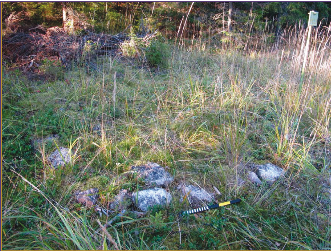
Kuva 6: Kelovuori 2. Aumanpohja nykyisessä asussaan. Lähikuva. SW.