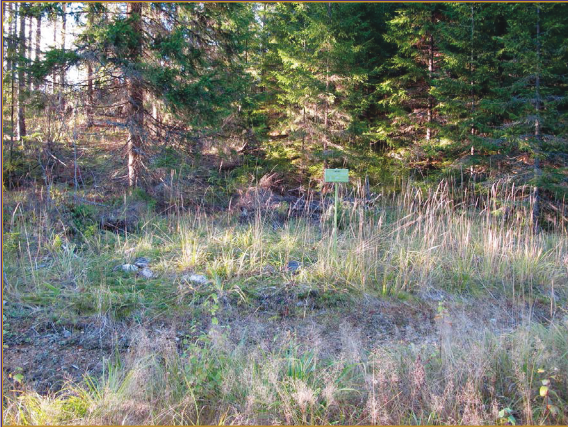
Kuva 5: Kelovuori 2. Aumanpohjan sijainti maastossa. S.