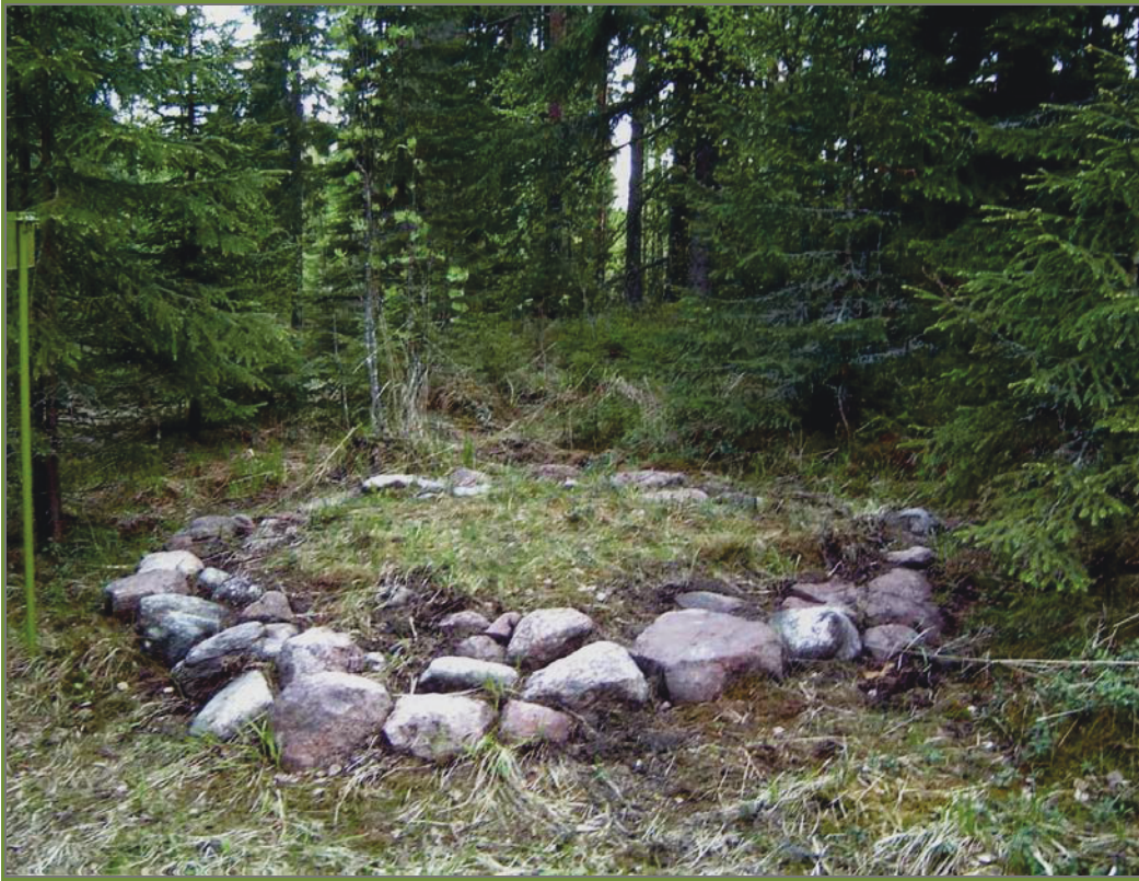
Kuva 7: Kelovuori 2. Vuonna 2015 tarkastettu aumanpohja paljastettuna ja kuvattuna vuonna 2006/2007. SW.