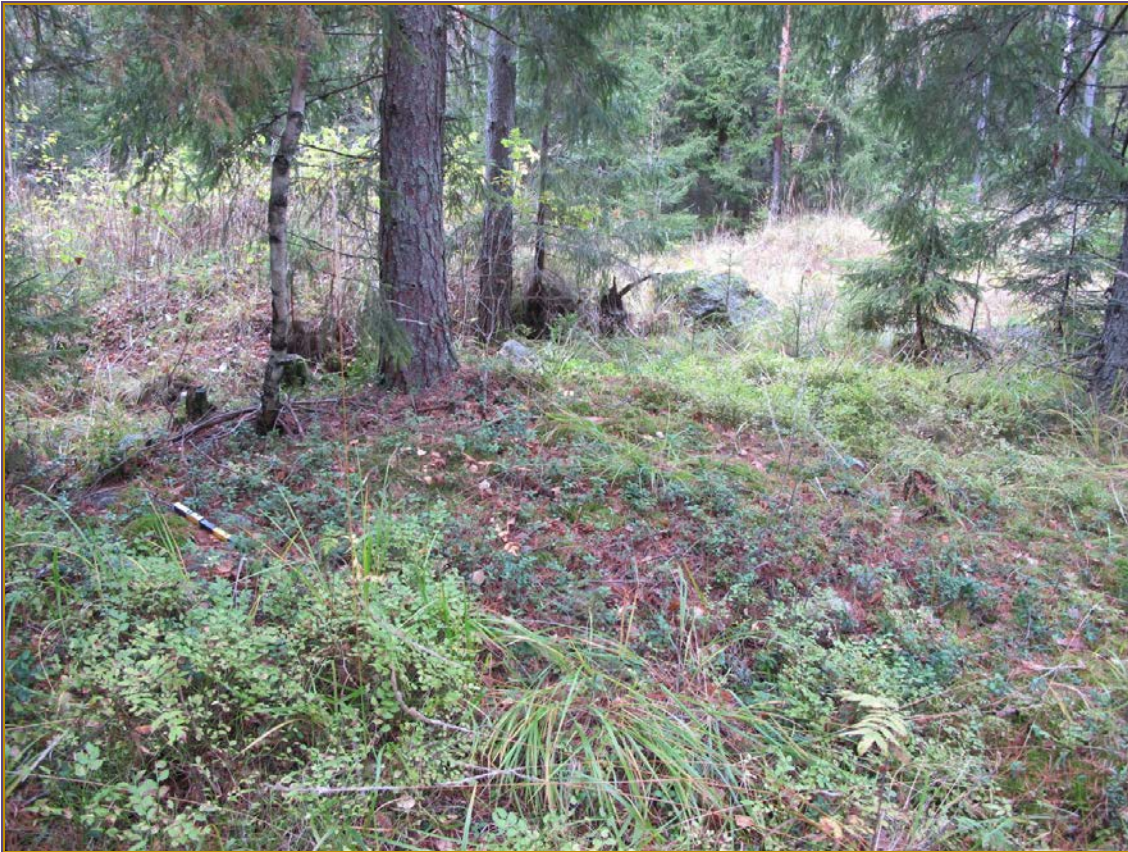
Kuva 1: Kohteen sijainti maastossa. Taustalla kulkee vanha hiekkatie Purhoon. N.