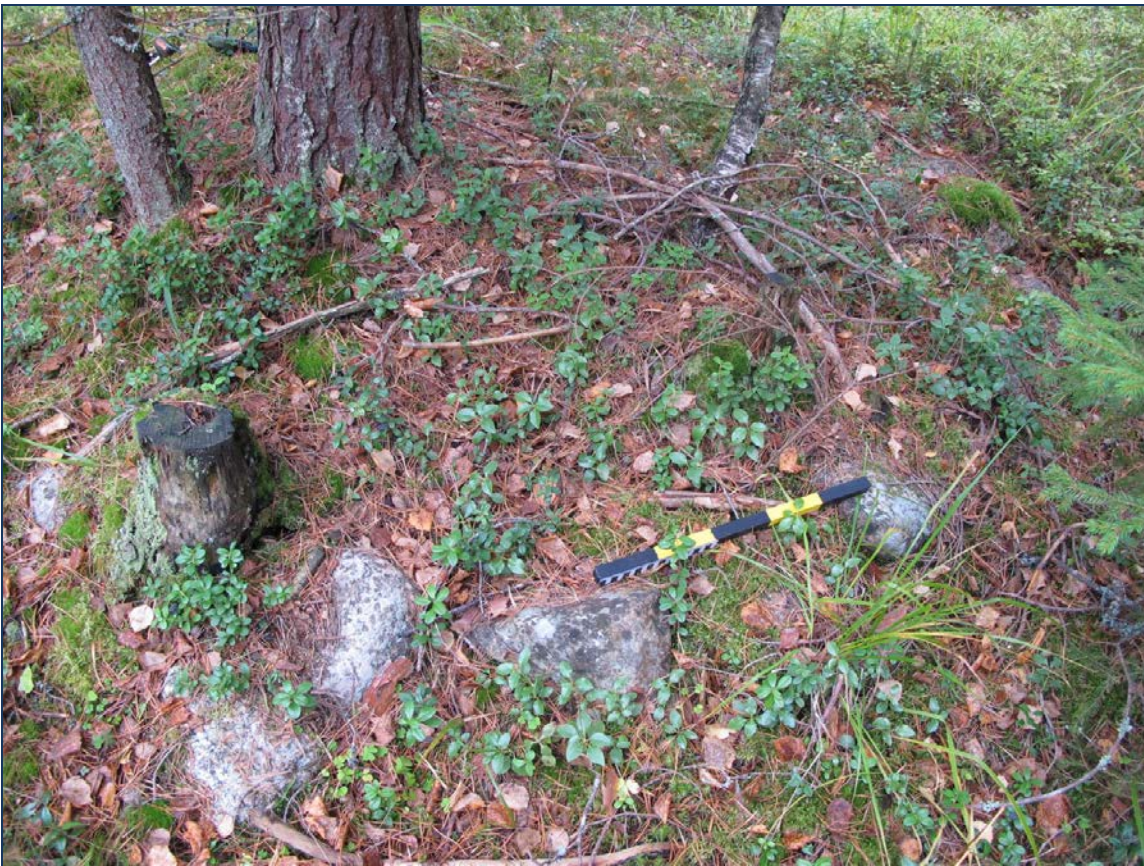
Kuva 3: Aumanpohjan S-sivustaa nykyisessä asussaan. Lähikuva.