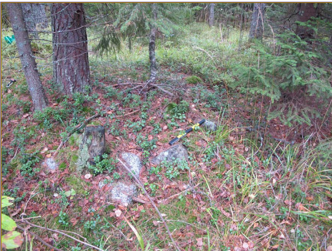
Kuva 2: Aumanpohjan S-sivustaa nykyisessä asussaan. Lähikuva. S.