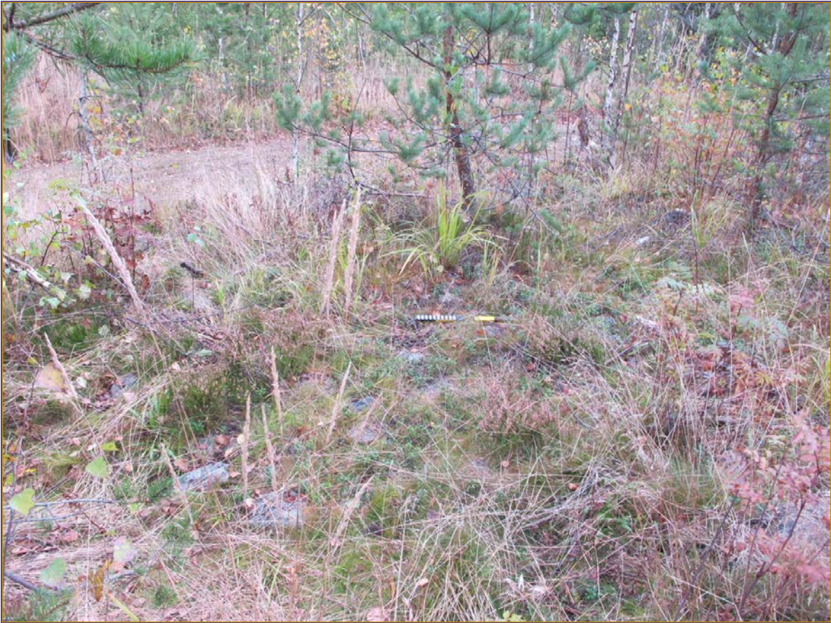
Kuva 1: Kohteen sijainti maastossa. Vieressä metsäautotie. N.