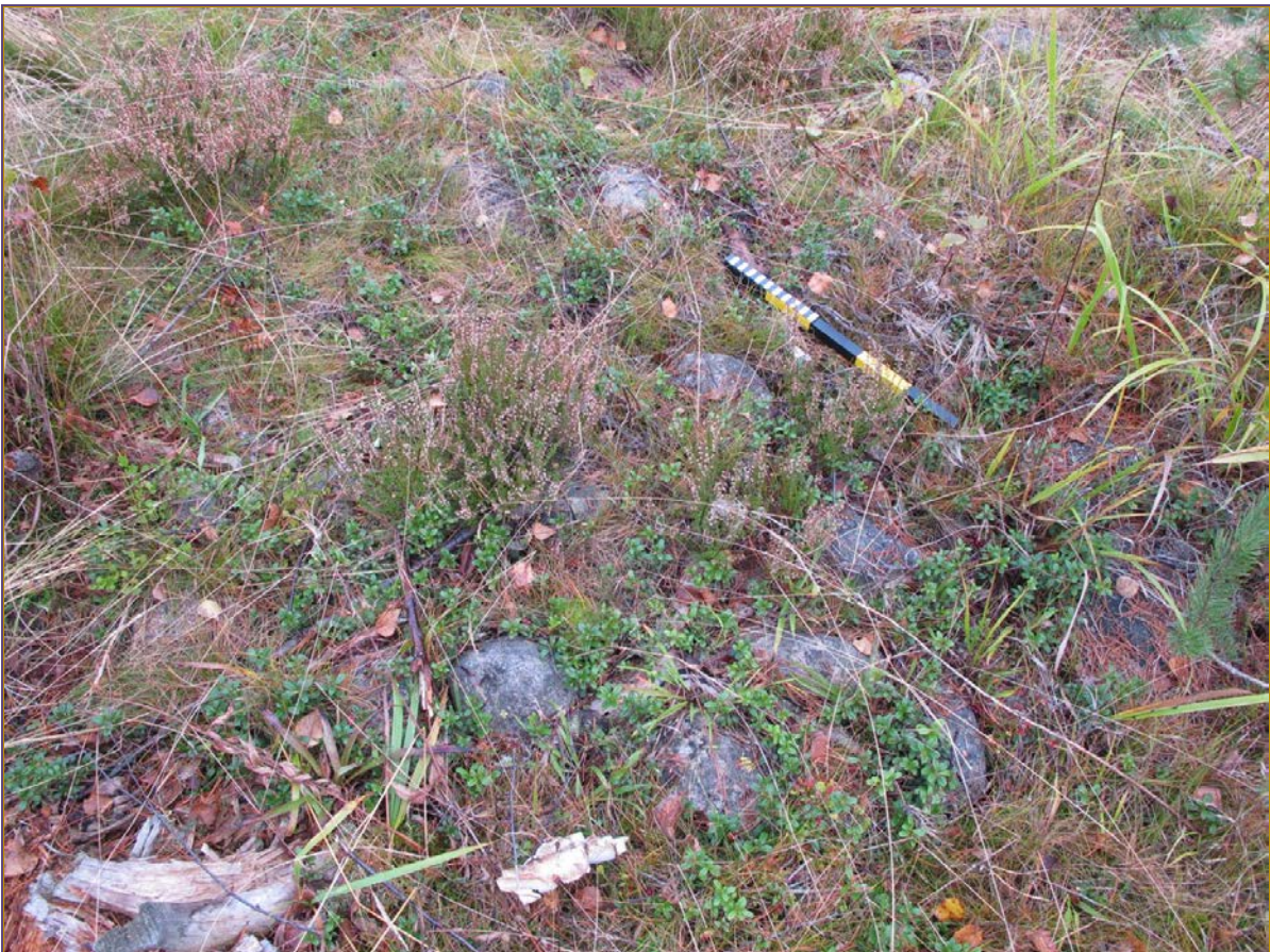
Kuva 2: Aumanpohjan kiveystä, lähikuva. N.