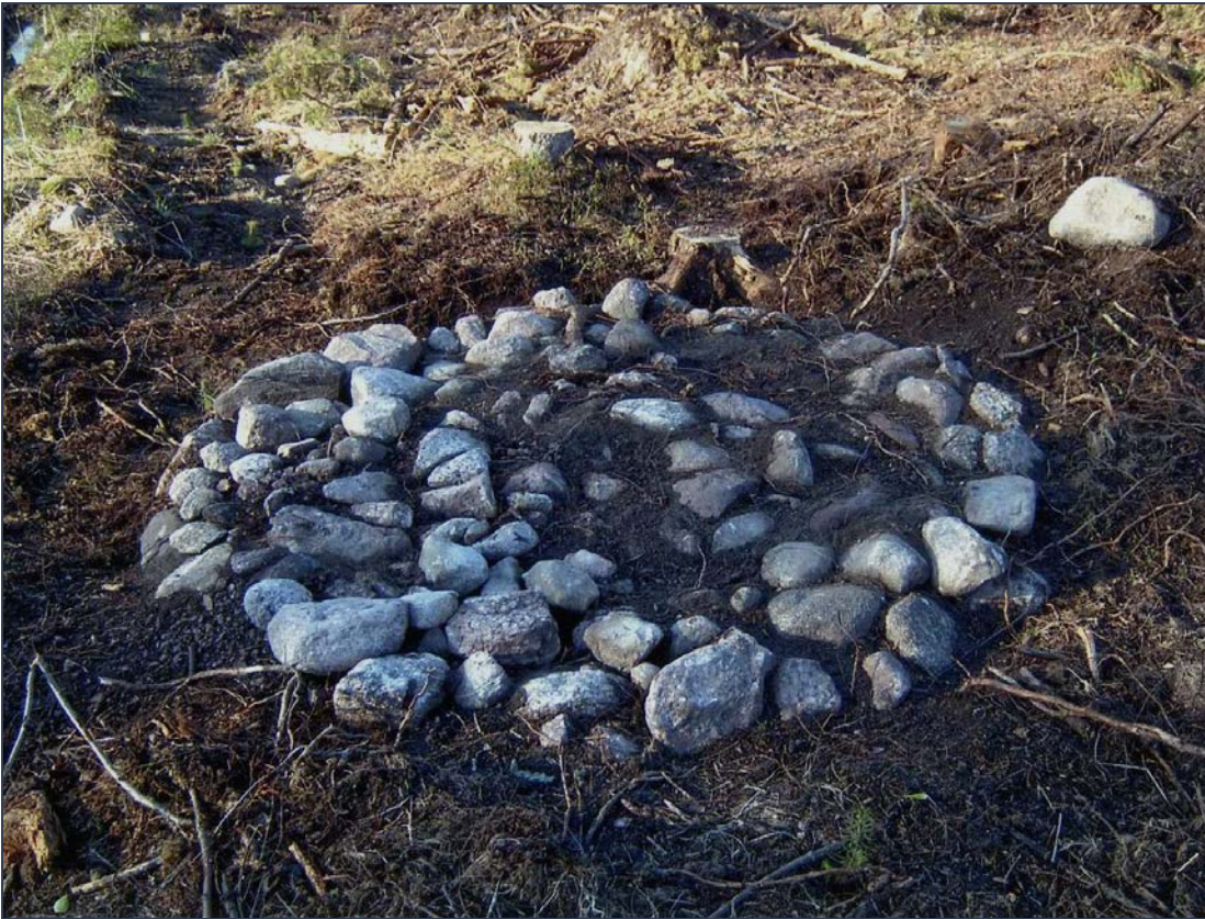
Kuva 3: Vuonna 2015 tarkastettu aumanpohja paljastettuna ja kuvattuna vuonna 2006/2007.