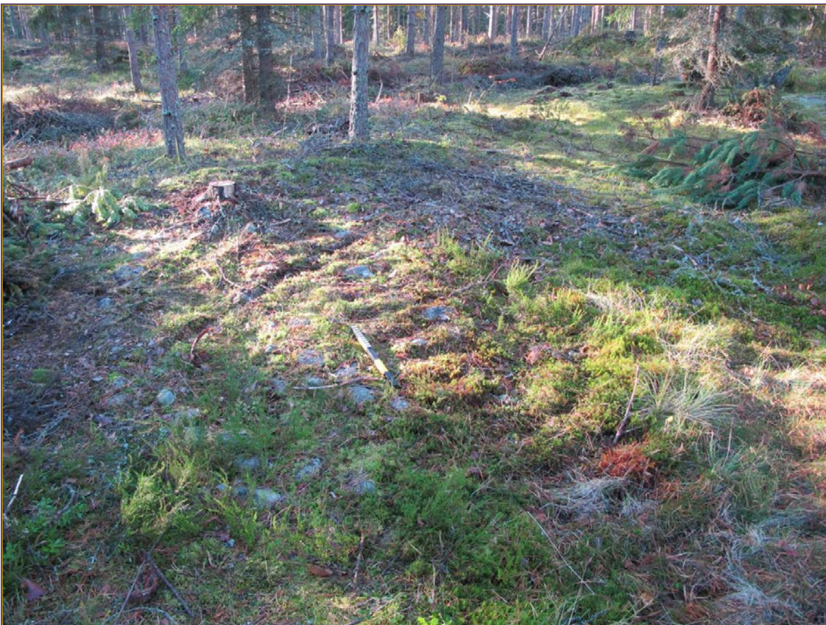
Kuva 4: Kohde suunnasta NE. Lähikuva.