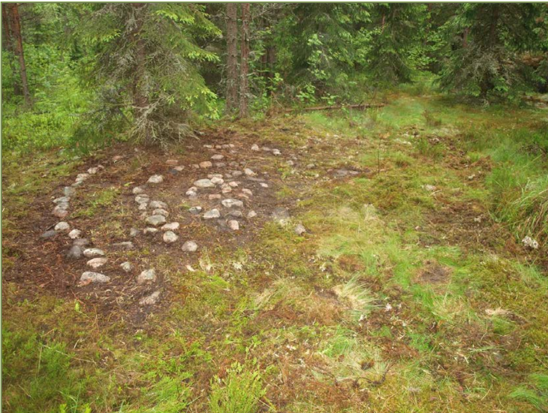
Kuva 2: Kohde vuonna 2009 pintaturpeen alta paljastettuna. NE.