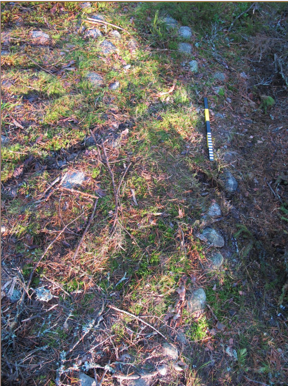
Kuva 4: Lähikuva rakenteen E-reunan kivikehistä. SW.