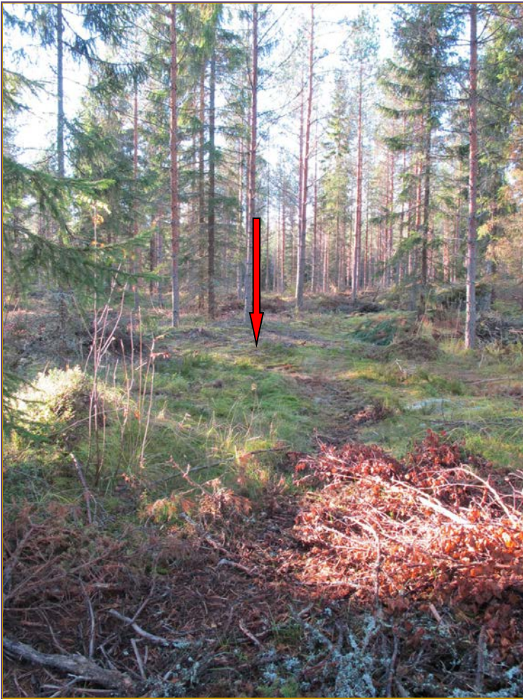
Kuva 1: Kohde ja sitä ympäröivää maastoa suunnasta NE.