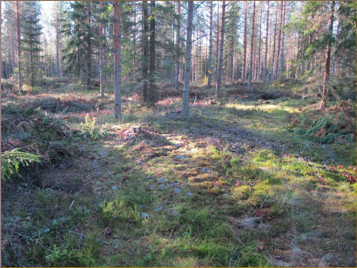
Kuva 3: Kohde suunnasta NE.