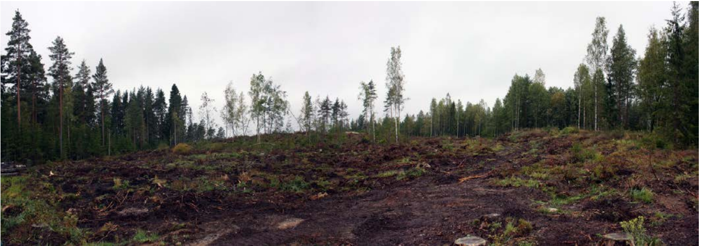
Kuva 2. Löytöalue B, kuvattu luoteesta. AKDG 4685:2