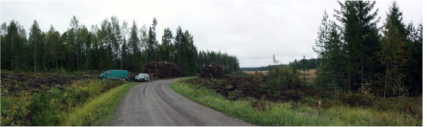
Kuva 1. Löytöalue A tien oikealla puolella ja löytöalue B tien vasemmalla puolella, kuvattu etelästä. AKDG 4685:1