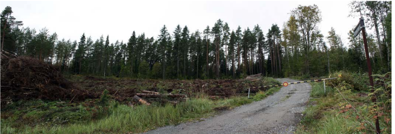
Kuva 4. Näkymä kohti metsänreunan lähellä olevaa löytöaluetta D, kuvattu kaakosta. AKDG 4685:4