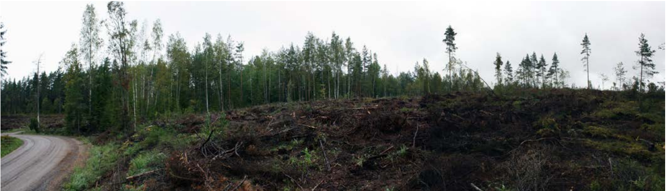
Kuva 3. Löytöalue C, kuvattu kaakosta. AKDG 4685:3