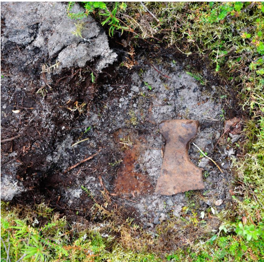
Kuva2. Kirves ja sen jättämä jälki hiekassa turpaan alla. KaiM 8076:1.