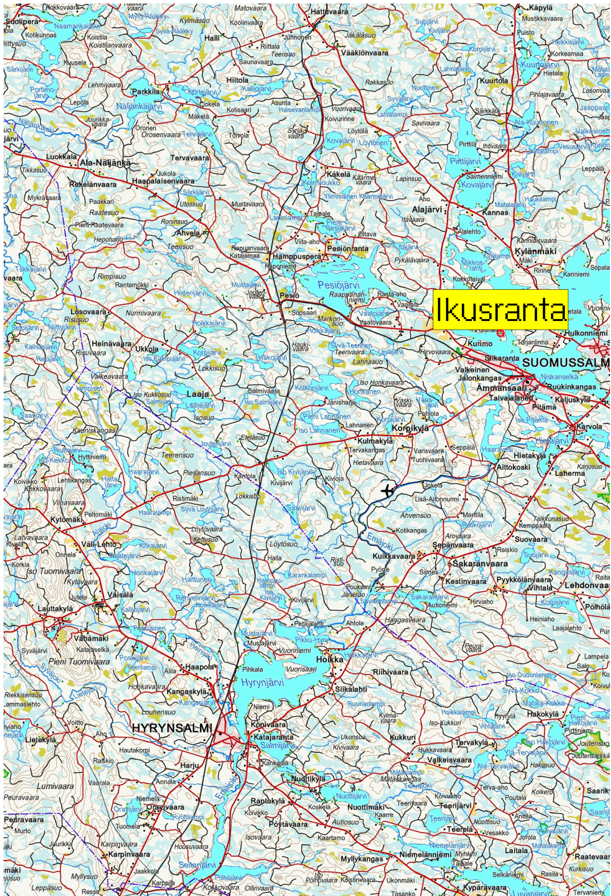
Kartta 1. Kopio Maanmittauslaitoksen avoimien aineistojen tiedostopalvelusta 27.8.2014 ladatusta kartasta UR5L_RVK. 1:250 000.