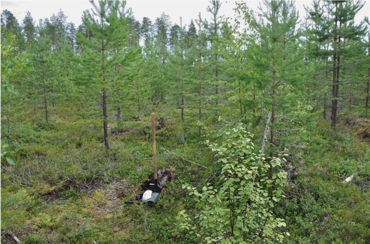
Kuva 1. Lappio on kirveen löytöpaikan vieressä. Kuvattu eteläkaakosta. KaiM 8076:2.