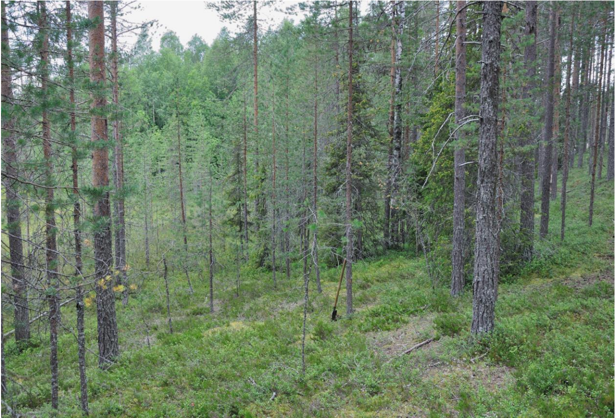
Kuva 3. Kulkusen löytöpaikka on lapion vieressä. Kuvattu idästä. KaiM 8079:5.