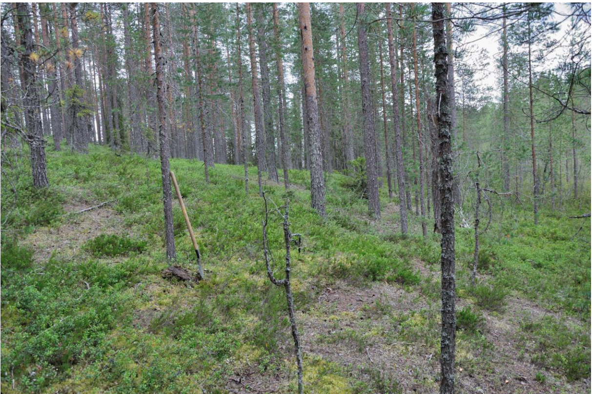
Kuva 4. Kulkusen löytöpaikka on lapion vieressä. Kuvattu lännestä. KaiM 8079:7.