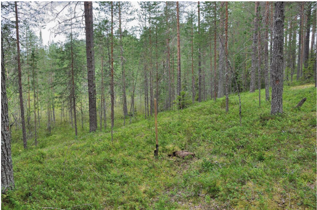
Kuva 2. Veitsen löytöpaikka on lapion oikealla puolella. Kuvattu idästä. KaiM 8079:2.