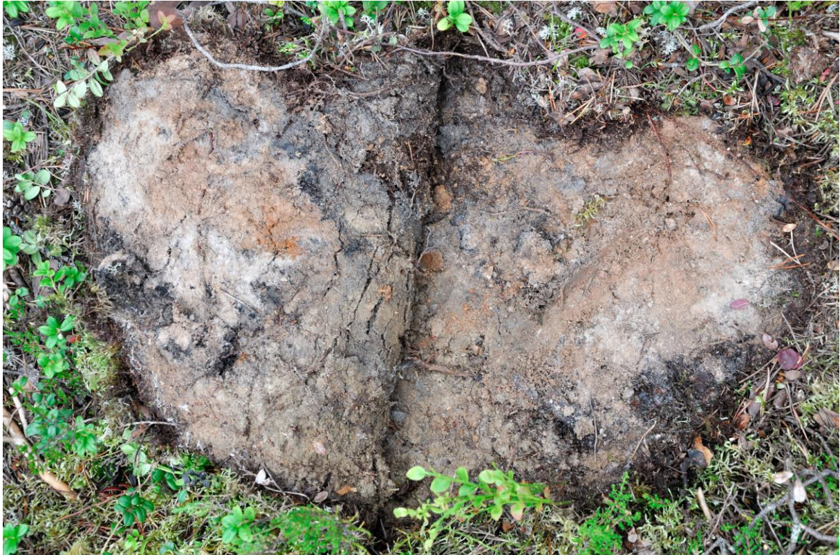
Kuva 1. Veitsi turpeen alla hiekassa. 8079:1.