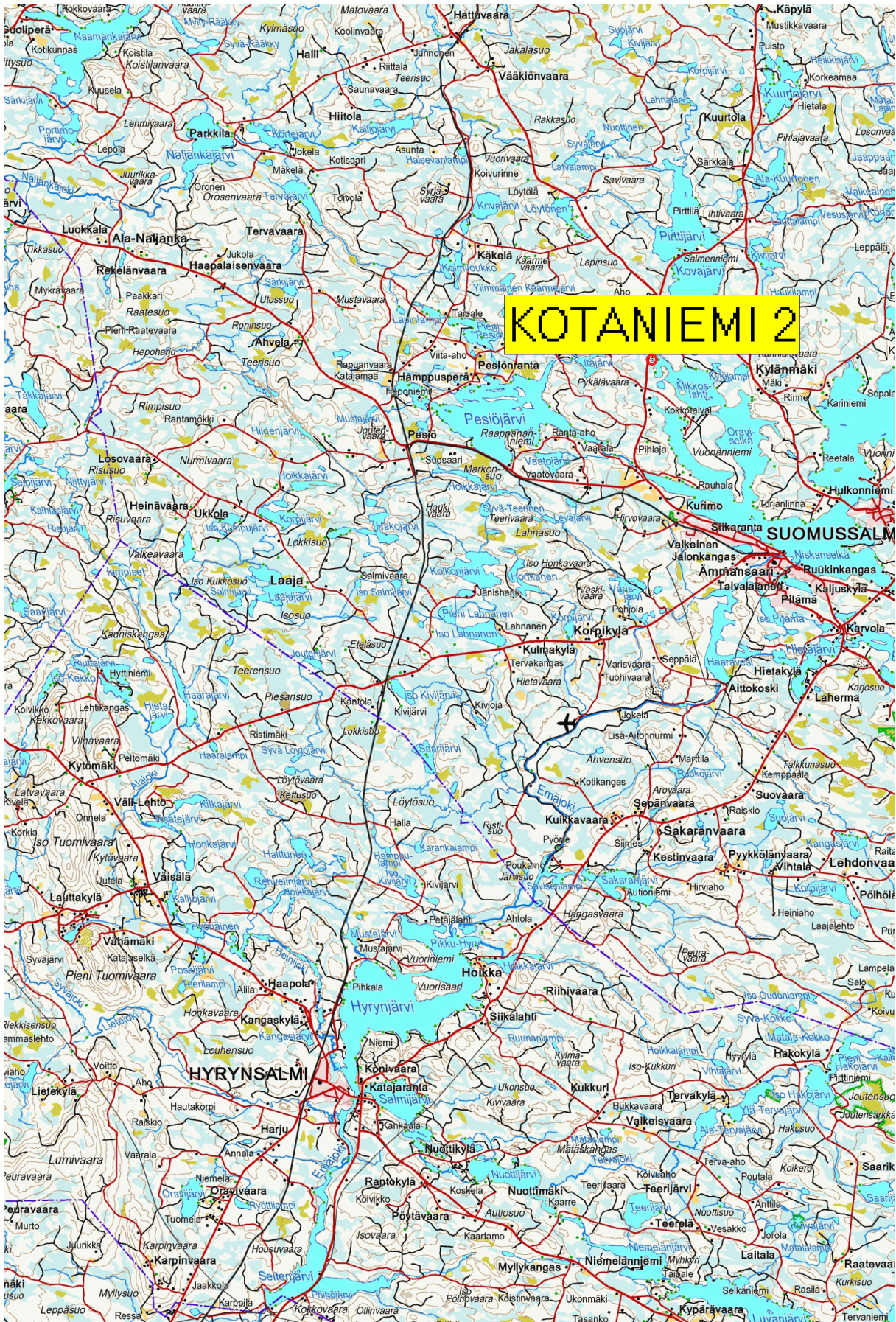
Kartta 1. Kopio Maanmittauslaitoksen avoimien aineistojen tiedostopalvelusta 27.8.2014 ladatusta kartasta UR5L_RVK. 1:250 000.