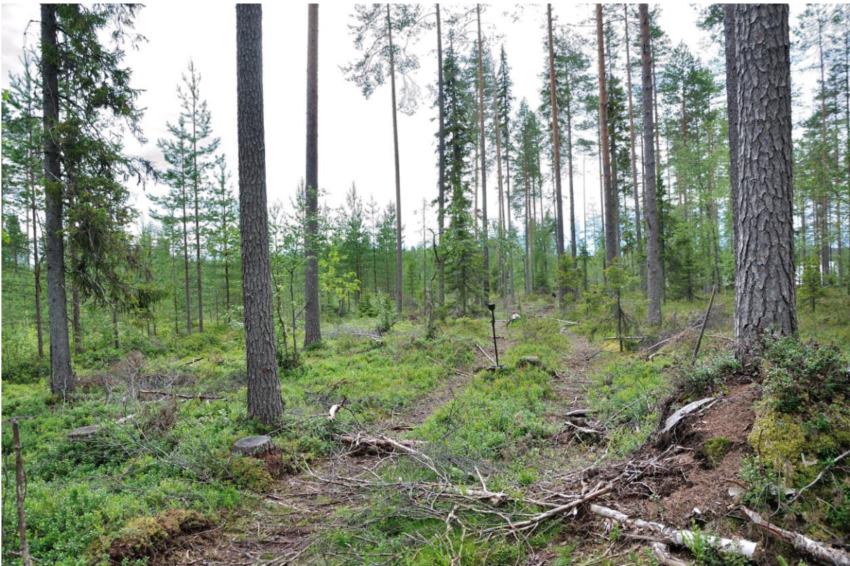
Kuva 2. Löytöalue pohjoisesta. KaiM 8077:3.