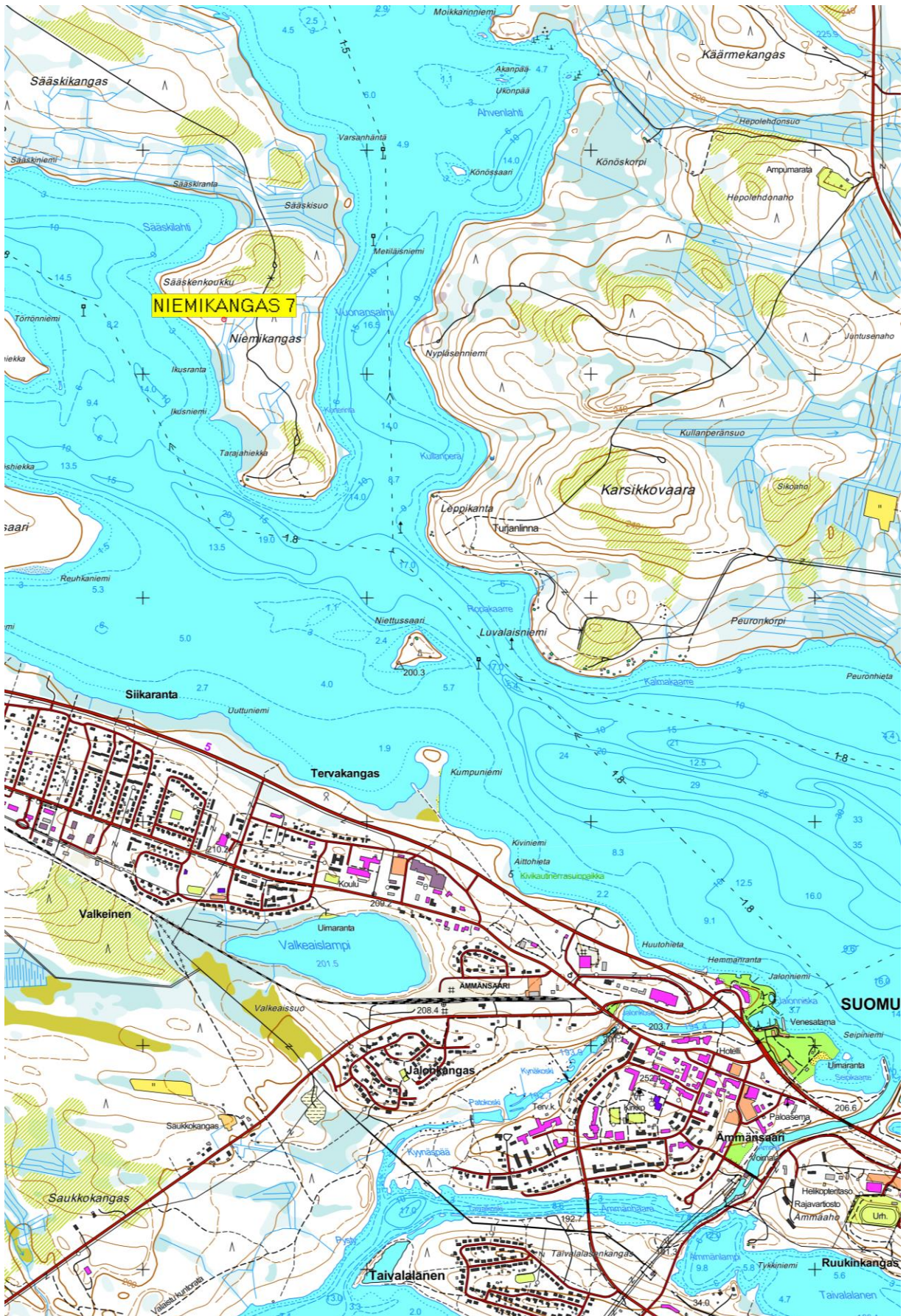
Kartta 2. Kopia Maanmittauslaitoksen avoimien aineistojen tiedostopalvelusta 29.10.2015 ladatusta kartasta R5233R. 1:25 000.