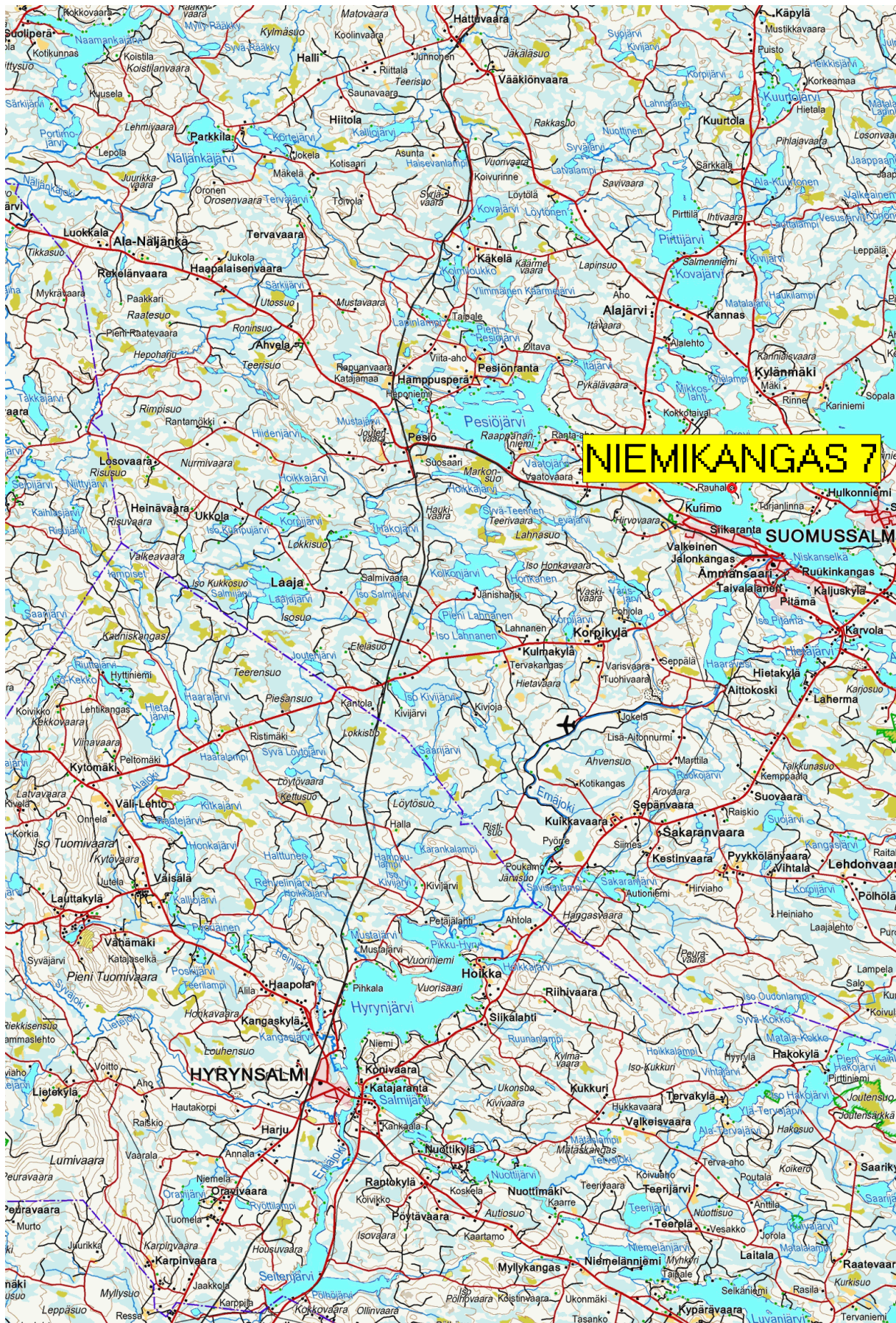
Kartta 1. Kopio Maanmittauslaitoksen avoimien aineistojen tiedostopalvelusta 27.8.2014 ladatusta kartasta UR5L_RVK. 1:250 000.