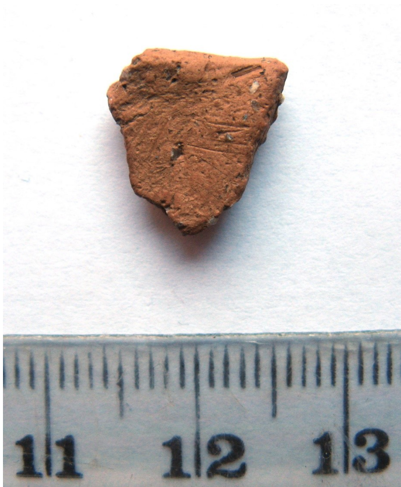
KM 40574:2 saviastian reunapala