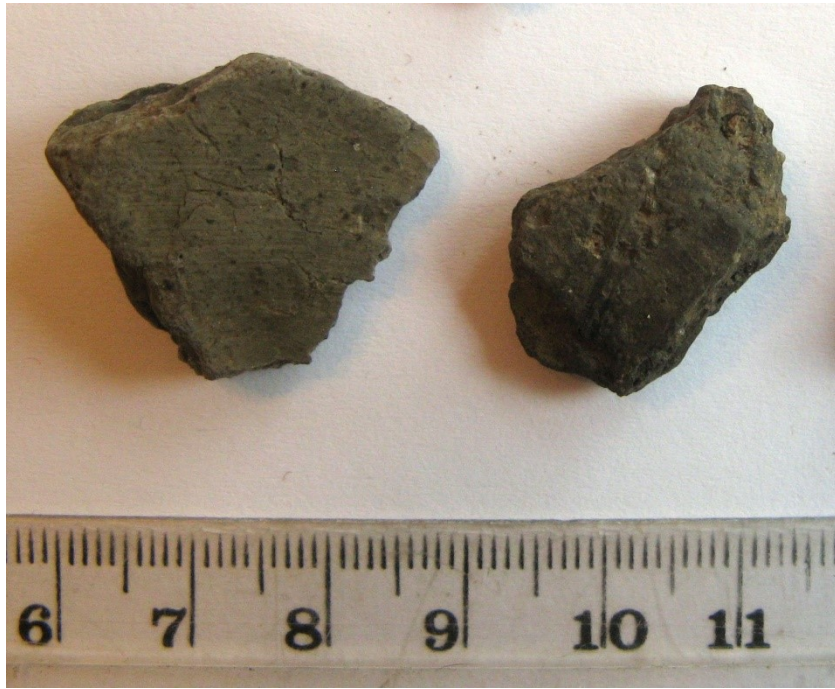
KM 40574:1 saviastianpaloja