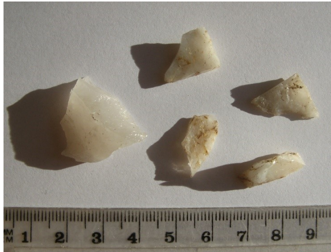
KM 40574:9 kvartsi-iskoksia