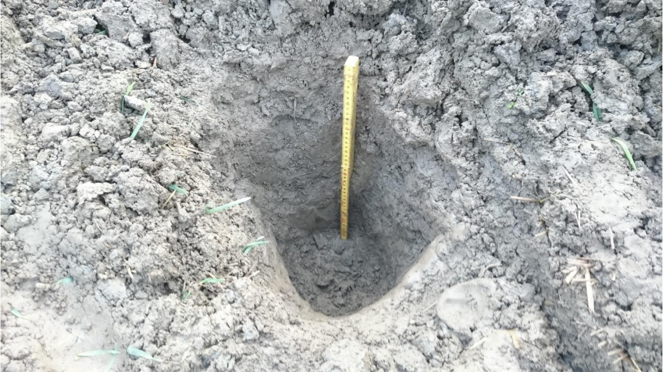
Kuva 11. Koekuoppa 4.