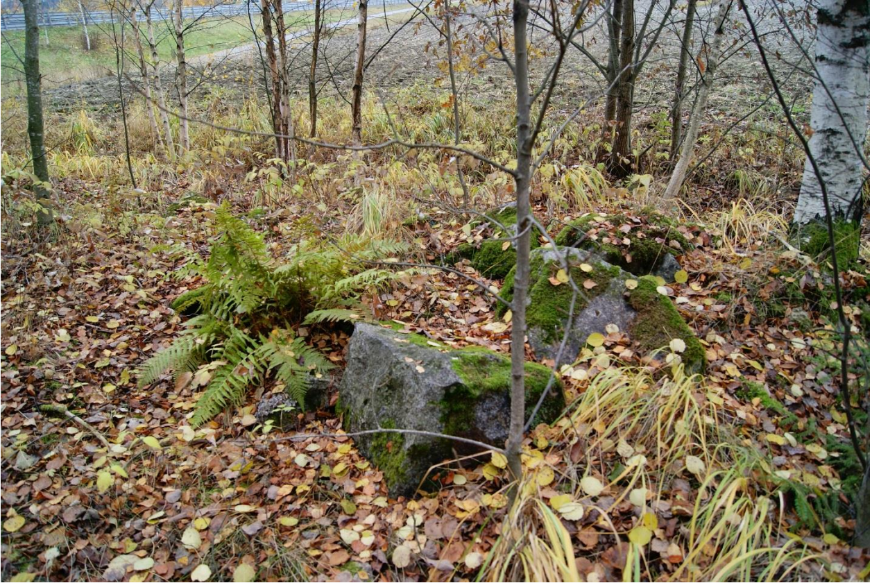
Kuva 5. Kohde Soukko 1. Kivijalkaa paikalla sijainneesta rakennuksesta. Kuvattu etelästä.