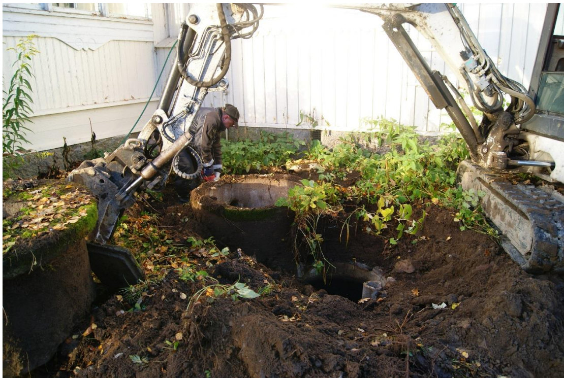
Kuva 2. Vanhojen jätevesikaivojen poistoa. Kuvattu itäkoillisesta.