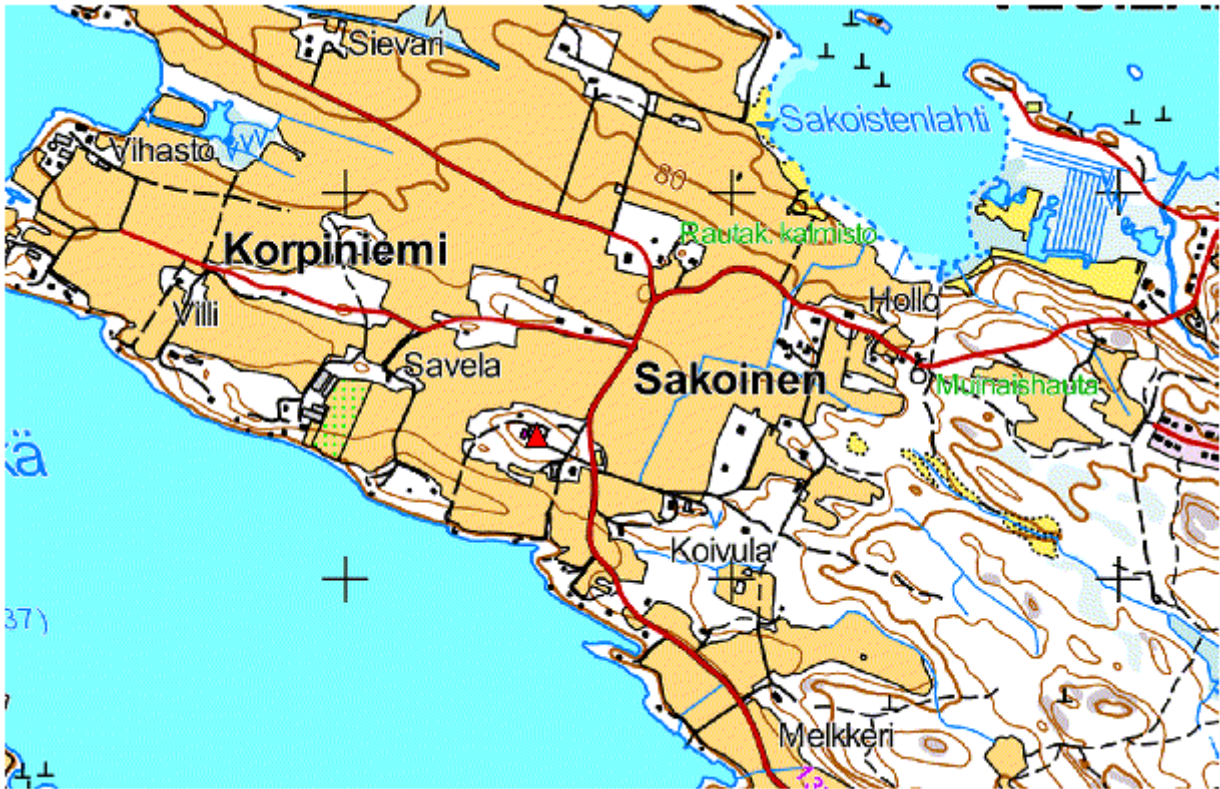
Kartta 2. Lähestymiskartta 2. Rautiala merkitty karttaan punaisella kolmiolla. Lisäykset karttaan: Eva Gustavsson