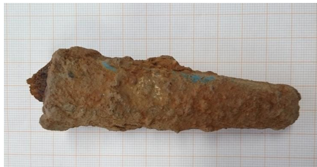
Kuva 11. Jonkinlainen kahva. Paksummalla reunalla jäänteitä pyöreästä puosasta. Pinnalla sinistä metalli/emalipinnoitetta.