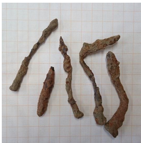
Kuva 4. Käsintähtöjä nauvoja. Pitkä taitettu esine ilmeisimmin hakanen. Lyhyt rautaesine mahdollisesti naulan osa.