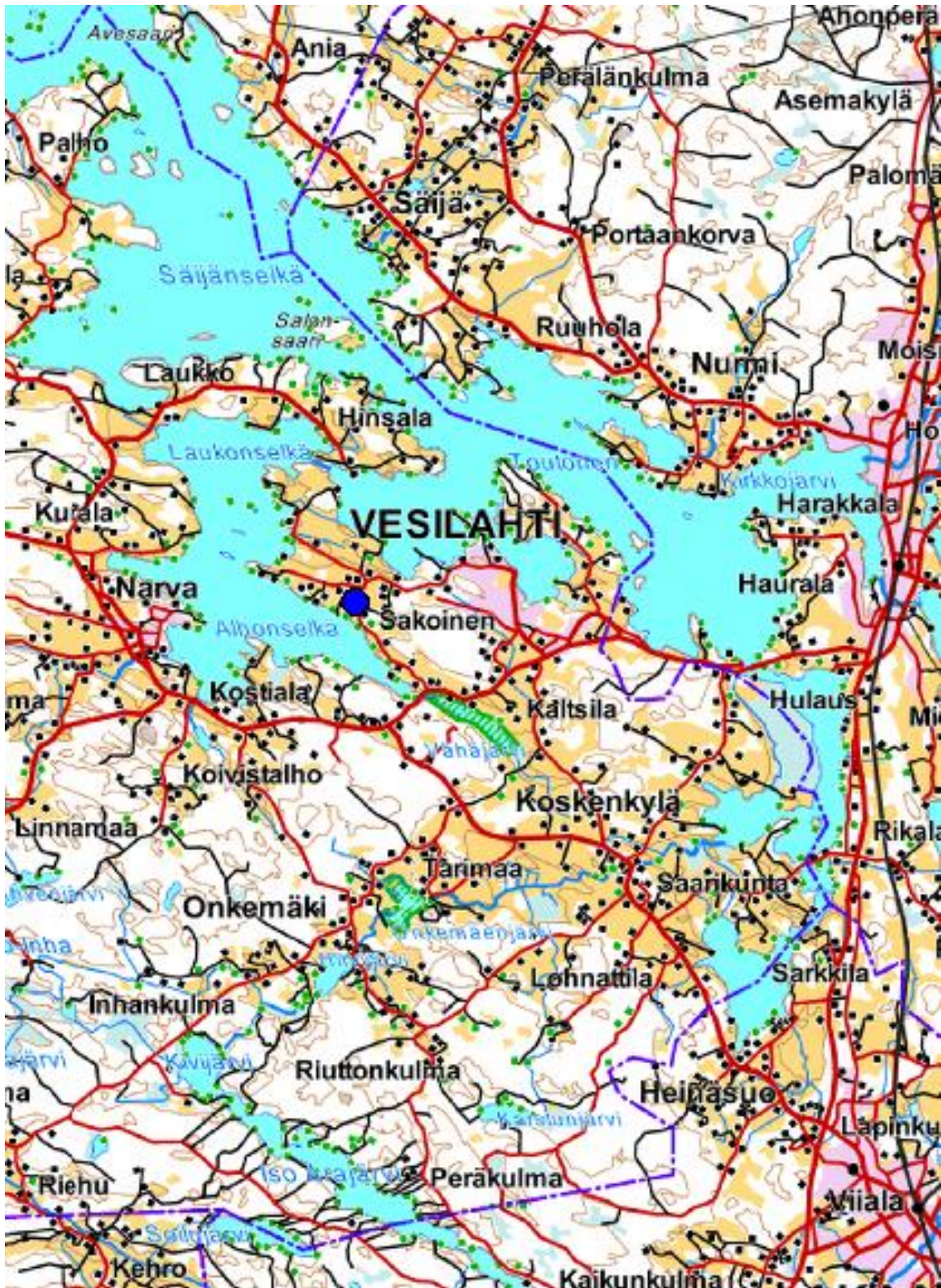
Kartta 1. Lähestymiskartta 1. Rautialan sijainti merkittynä sinisellä pallolla. Pohjakartta © Maanmittauslaitos 2015. Lisäykset karttaan: Eva Gustavsson