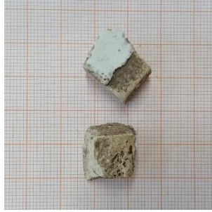
Kuva 8. Valkoista paksuseinäistä keramiikkaa.