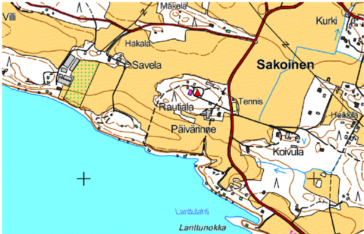
Kartta 3. Lähestymiskartta 3. Rautiala merkitty karttaan punaisella kolmiolla. Pohjakartta ©Maanmittauslaitos 2015. Lisäykset karttaan: Eva Gustavsson