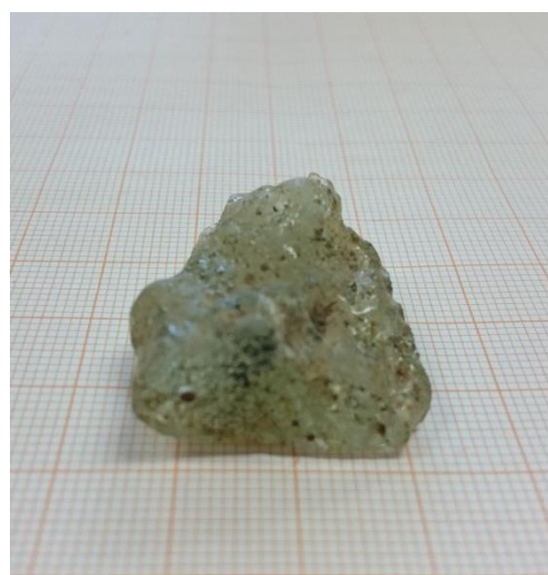
Kuva 6. Muovimaisista lasikuonaa.