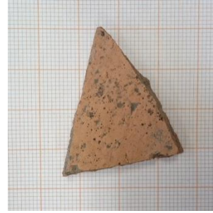
Kuva 9. Ohutseinäistä punasavikeramiikkaa.