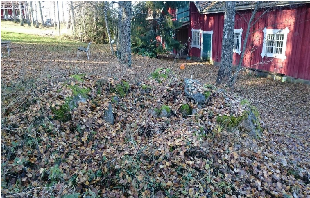
Kuva 12. Vanhan navetan itäkulman edustalla oleva röykkiö. Kuvattu itäkaakosta.

B. Cederhvarfin vuonna 1910 kartoittamat röykkiöt eivät sijoitu valvonta-alueelle. Alueen itäosalla, navetan itäkulman edustalla on havaittavissa suurehko röykkiö. Toinen on tästä röykkiöstä itään, vesoittuneen alueen reunamilla. Nämä röykkiöt voivat olla puutarhan muokkauksessa siirrettyjen entisten rakennusten perustuksia tai aikaisempaa perua. Otettava huomioon maankäyttöä suunniteltaessa.