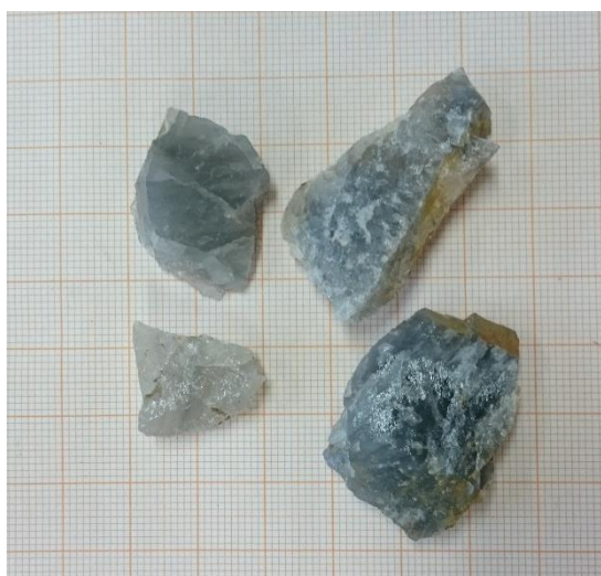
Kuva 5. Kvartsin paloja.