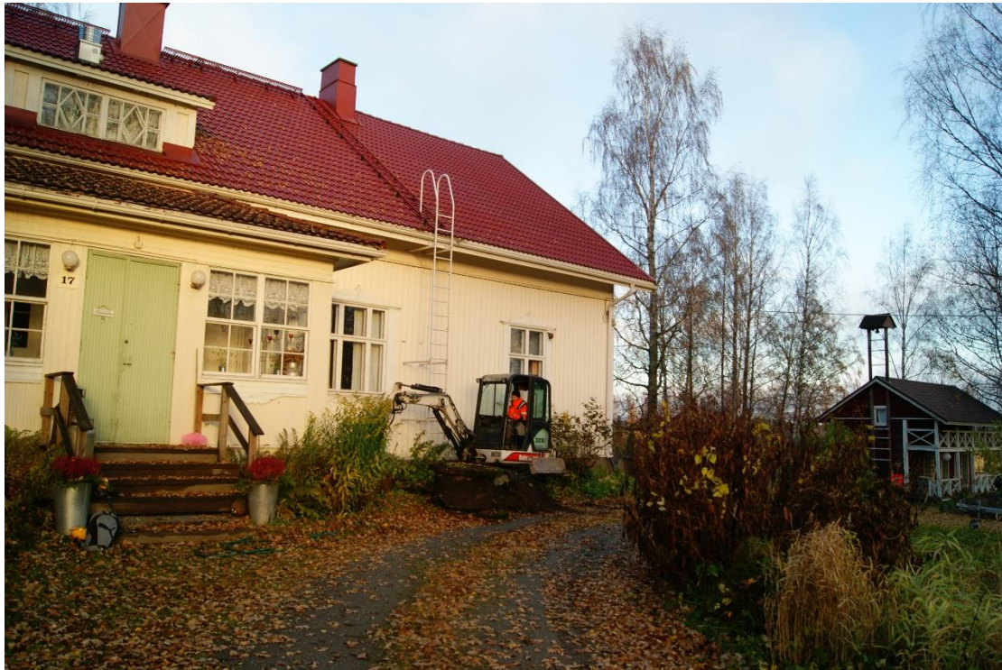
Kuva 1. Kaivaustöitä aloitellaan. Kuvattu kaakosta.