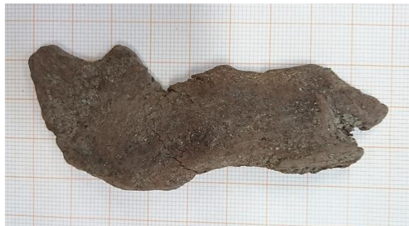
Kuva 3. Nahkainen kengänosa.