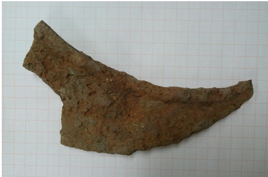
Kuva 10. Mahdollisesti äkeen terä tai muu maataloustyöväline.