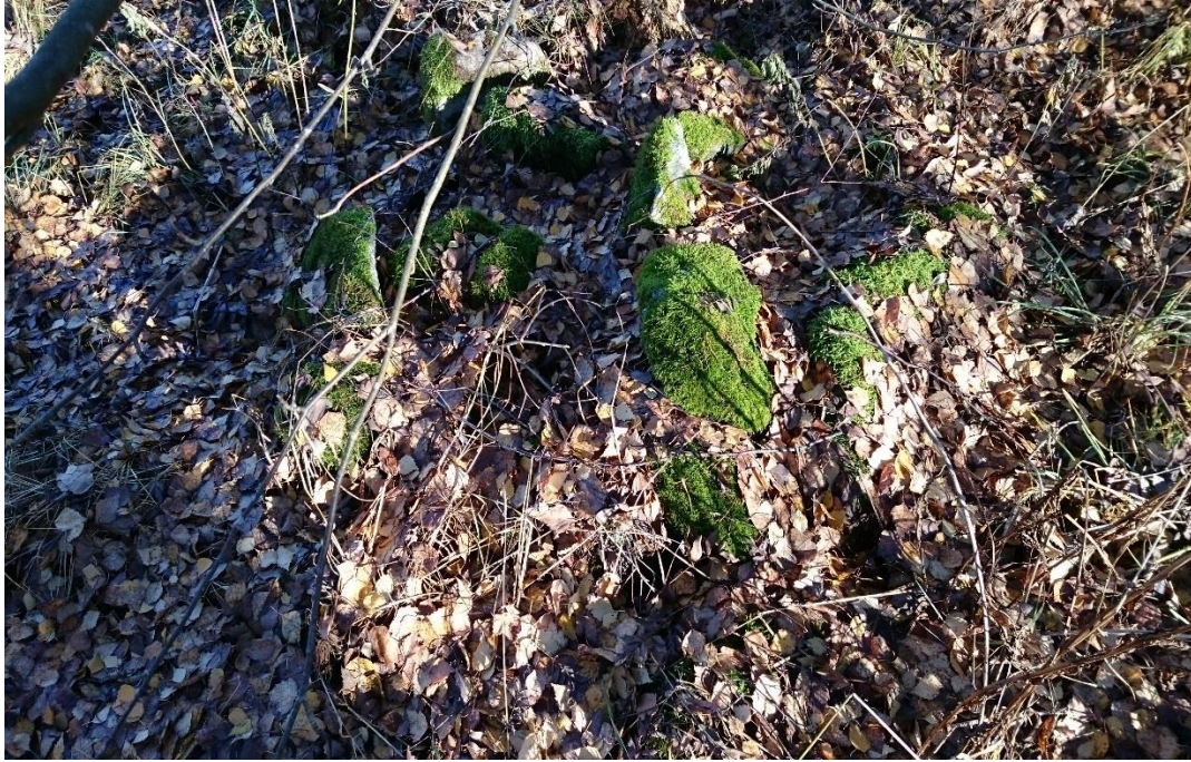
Kuva 13. Toinen röykkiö vesoittuneen alueen alussa. Kuvattu lännestä.