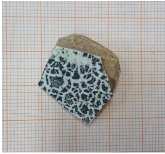
Kuva 7. Fajanssia.